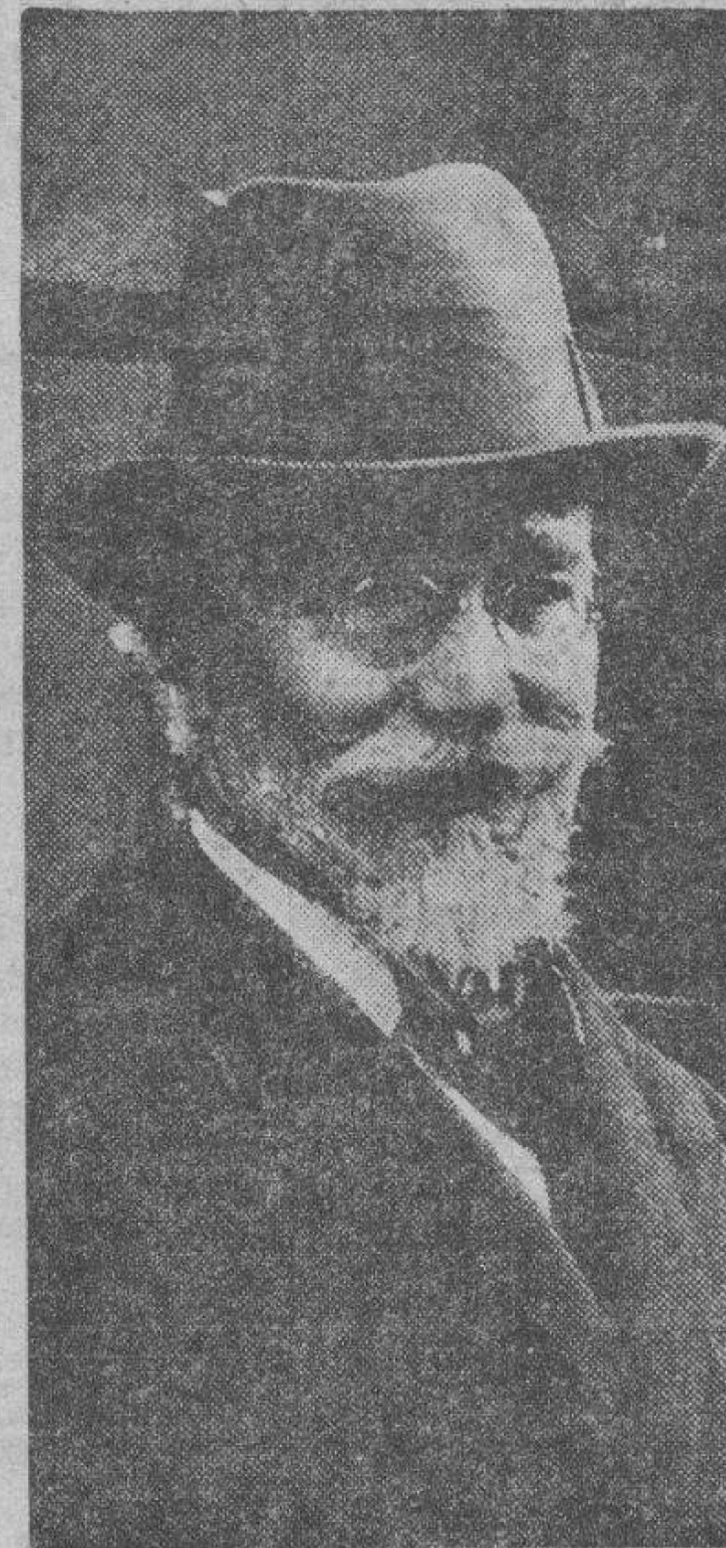
El señor Venizelos ha embarcado para Brindisi, desde donde se dirigirá a Roma.

En la capital italiana se entrevistará con los señores Mussolini y Grandi, continuando después su viaje a París, donde conferenciará con los señores Laval y Flandin.