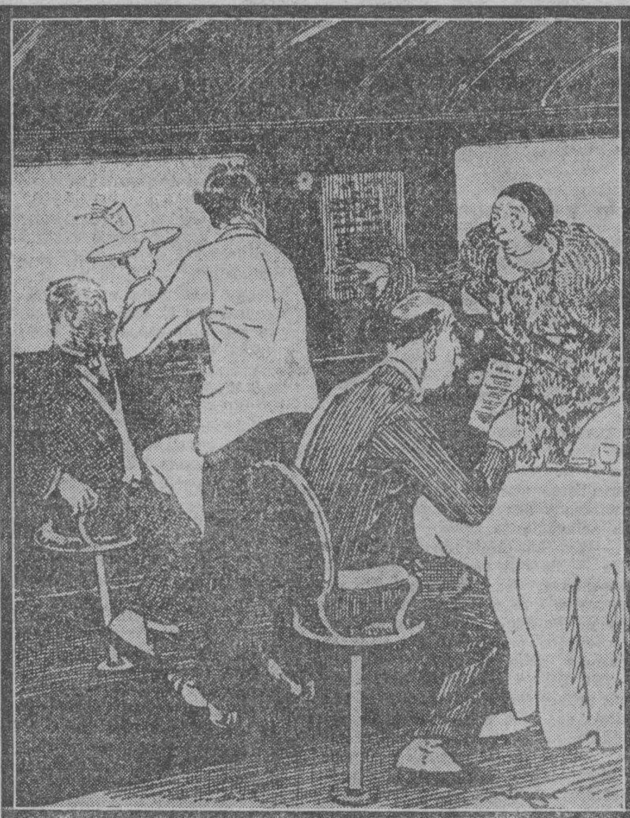
La pasajera del avión. — ¡Acaba de caerse un hombre! ¡Pronto, échense un paracaídas!

metros sobre el mar, y amenazado durante horas más largas por la más horrorosa de las tempestades de truenos que él ha experimentado en sus "raids" mundiales. Pero jamás apartado de su rumbo, jamás desconcertado. Cuando aterrizó quedaba en los depósitos combustible para otras dos horas de vuelo.