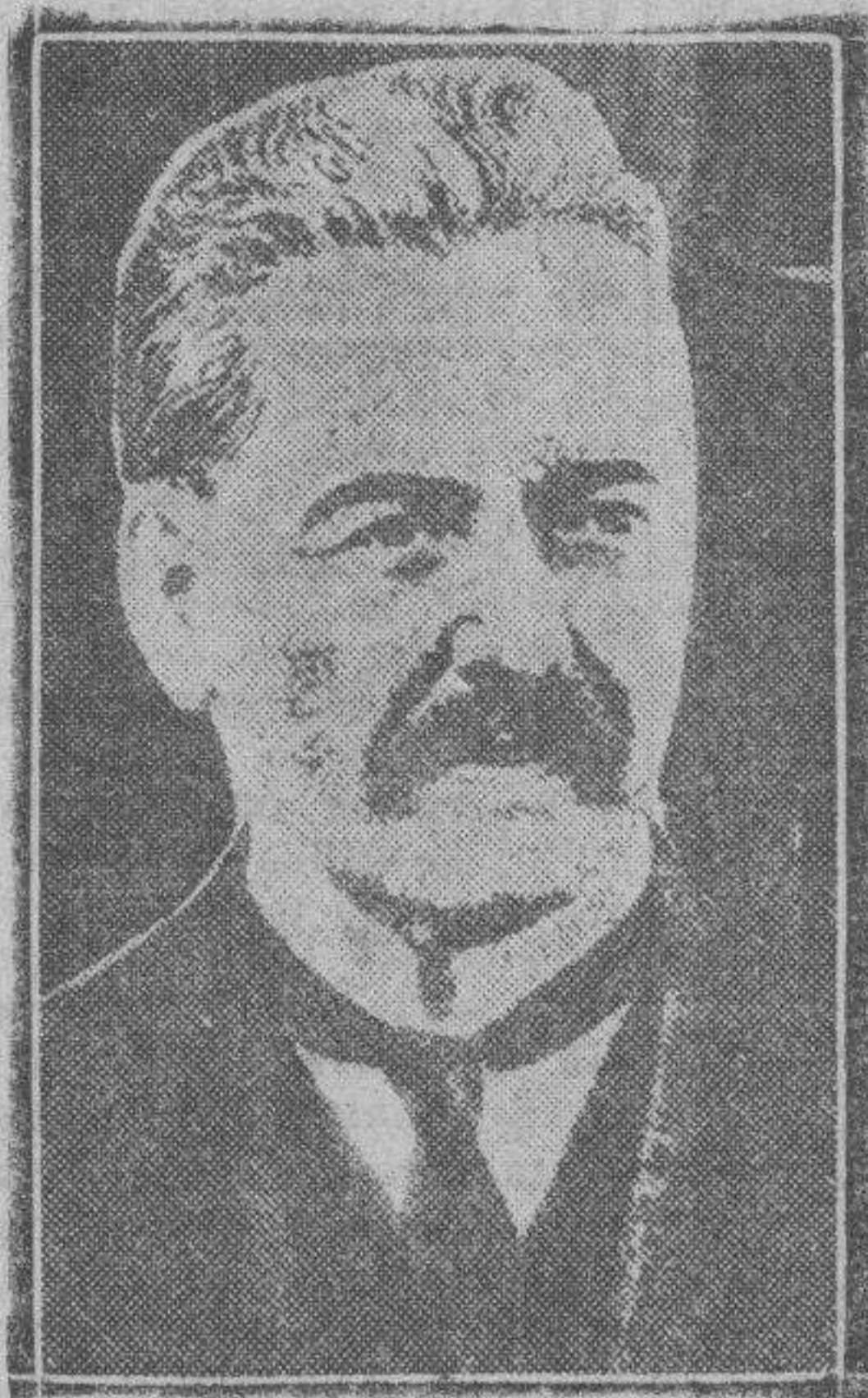
Se anuncia como muy próxima la autorización al expresidente Irigoyen, que actualmente se encuentra detenido en la isla de Martín Gracia, para que regrese libremente a la capital. El proceso judicial seguirá, sin embargo, su curso.