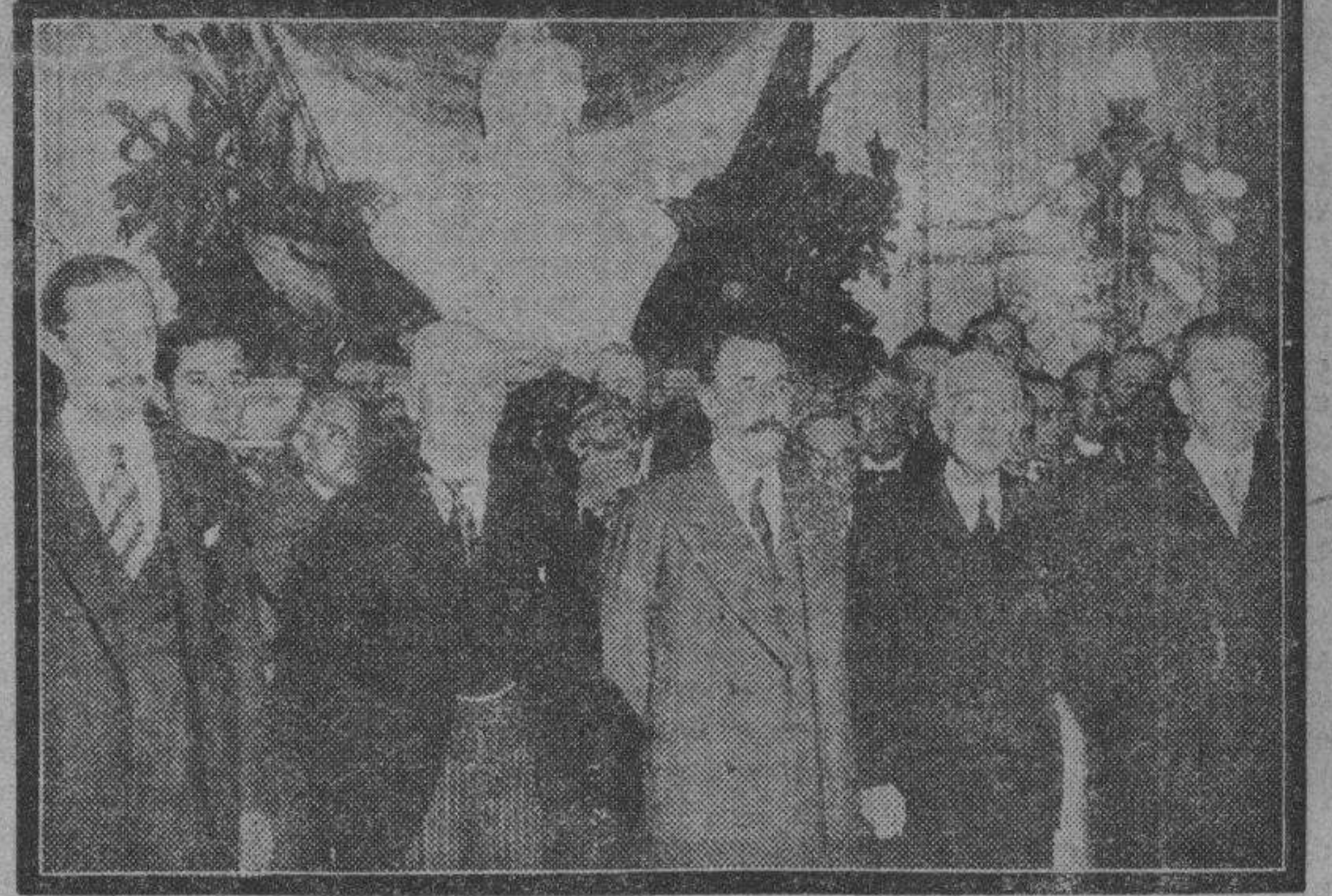
Adquiere actualidad en estos momentos en que se acaban de celebrar las elecciones presidenciales en la República Argentina, esta fotografía del día del juramento del último Gobierno que ha tenido el presidente Uriburu. En ella aparece el citado presidente del Gobierno provisional con los ministros.