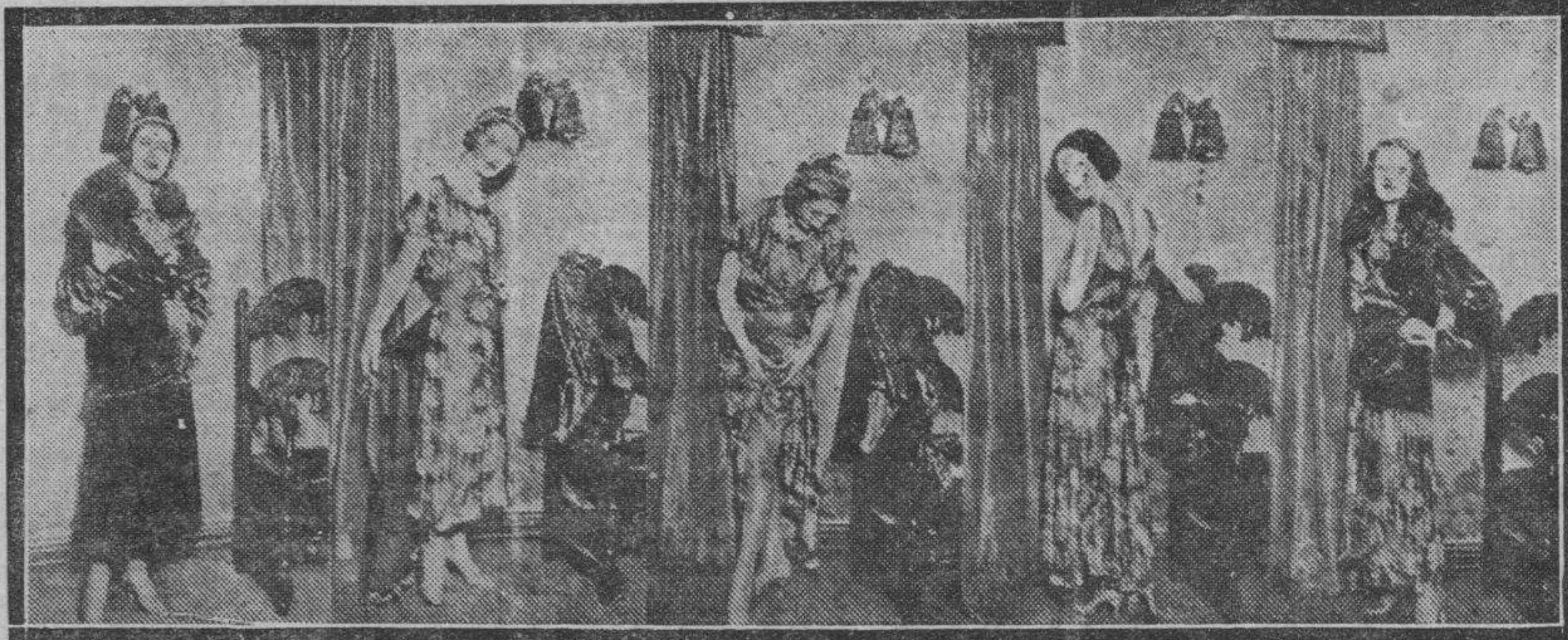
Los tiempos no están para derrochar ni tiempo ni dinero, y hay que ingeniarse en estas combinaciones de vestuario. En Londres, la célebre modista Fininella ha creado este vestido que puede tener cinco usos. Consta de chaqueta y falda, y lleva debajo otro vestido de doble falda con una capa desprendida. El traje, sobre ser más económico que cinco trajes, soluciona a las mujeres que trabajan el cambiar de indumento sin necesidad de ir a casa para hacer la transformación.