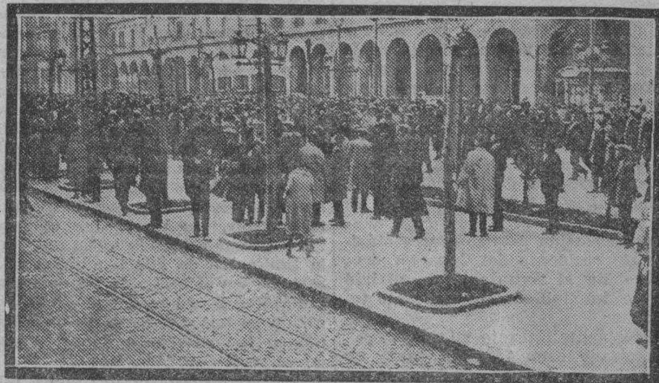
En la mañana de ayer organizaron los estudiantes una manifestación para solicitar colectivamente el indulto del capitán Sediles.