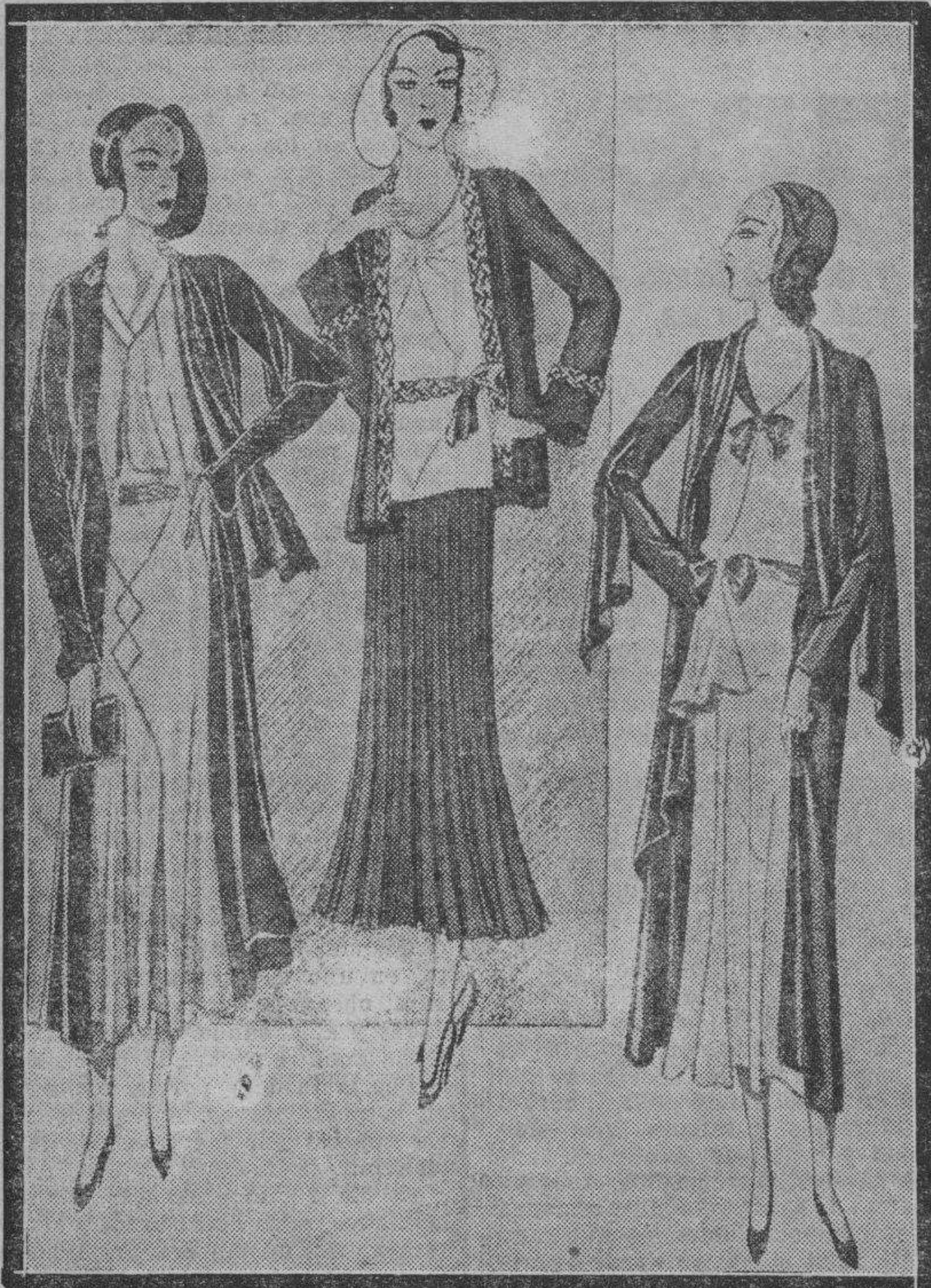
De izquierda a derecha. — Conjunto de tarde: abrigo de crepón de China negro, forro amarillo, vestido de crepón amarillo, hebilla amarilla y negra. Pequeño vestido sastre, para por la tarde, de crepón de China marino, blusa-túnica de raso blanco, Falda plisada. Conjunto de tarde en "Marocain" rojo en el abrigo, y "beige" rosado en el vestido: cuello y cinturón forrado en negro.

La Naturaleza mueve, los árboles florecen, un ambiente más templado incita a preocuparse de los nuevos vestidos y la señora se encuentra perpleja, desorientada, de lo que debe elegir. Procuraremos guiarla con nuestra experiencia, comenzando hoy por los tejidos.