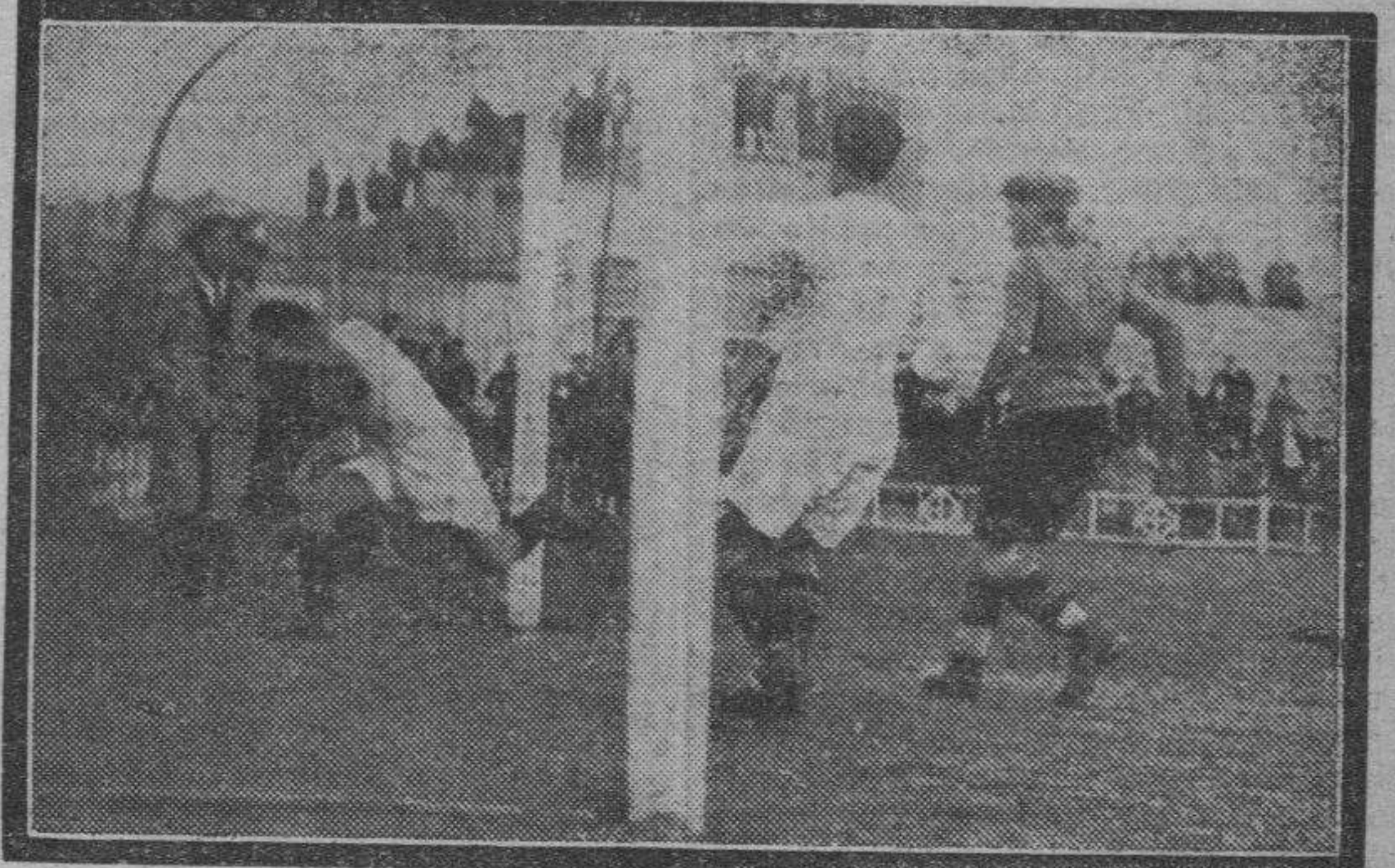
Una jugada en el partido Patria-Sestao.