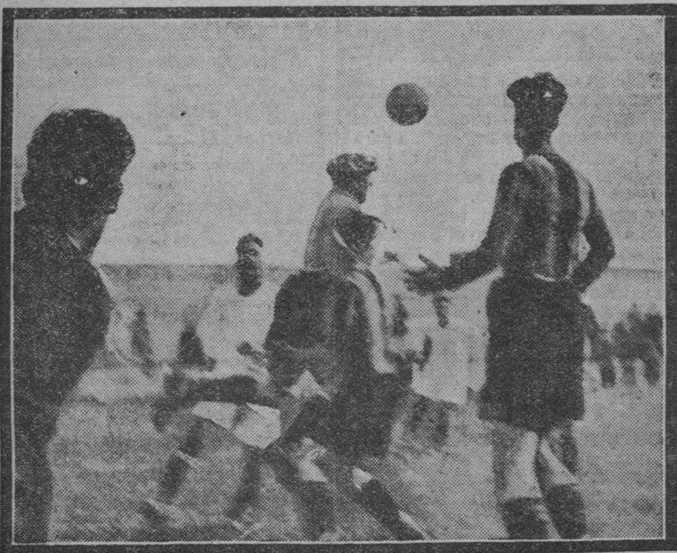
Un despeje del meta forastero.

Sale el Europa, que realiza sendos avances que corta muy bien la defensa españolista. Un chut de Bestit lo detiene muy bien Mañe. Después del primer cuarto de hora de dominio europeo se impone el Español, que hace un juego magnífico. Trabajando mucho y bien, Florenza realiza al-