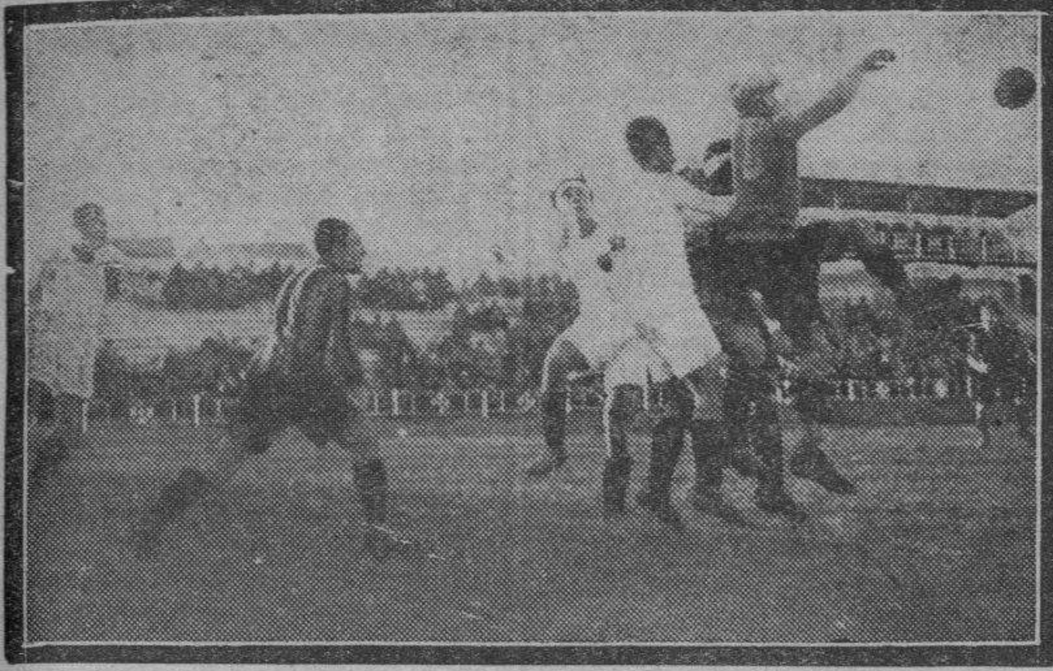
Uno de los goals marcados por el Iberia.