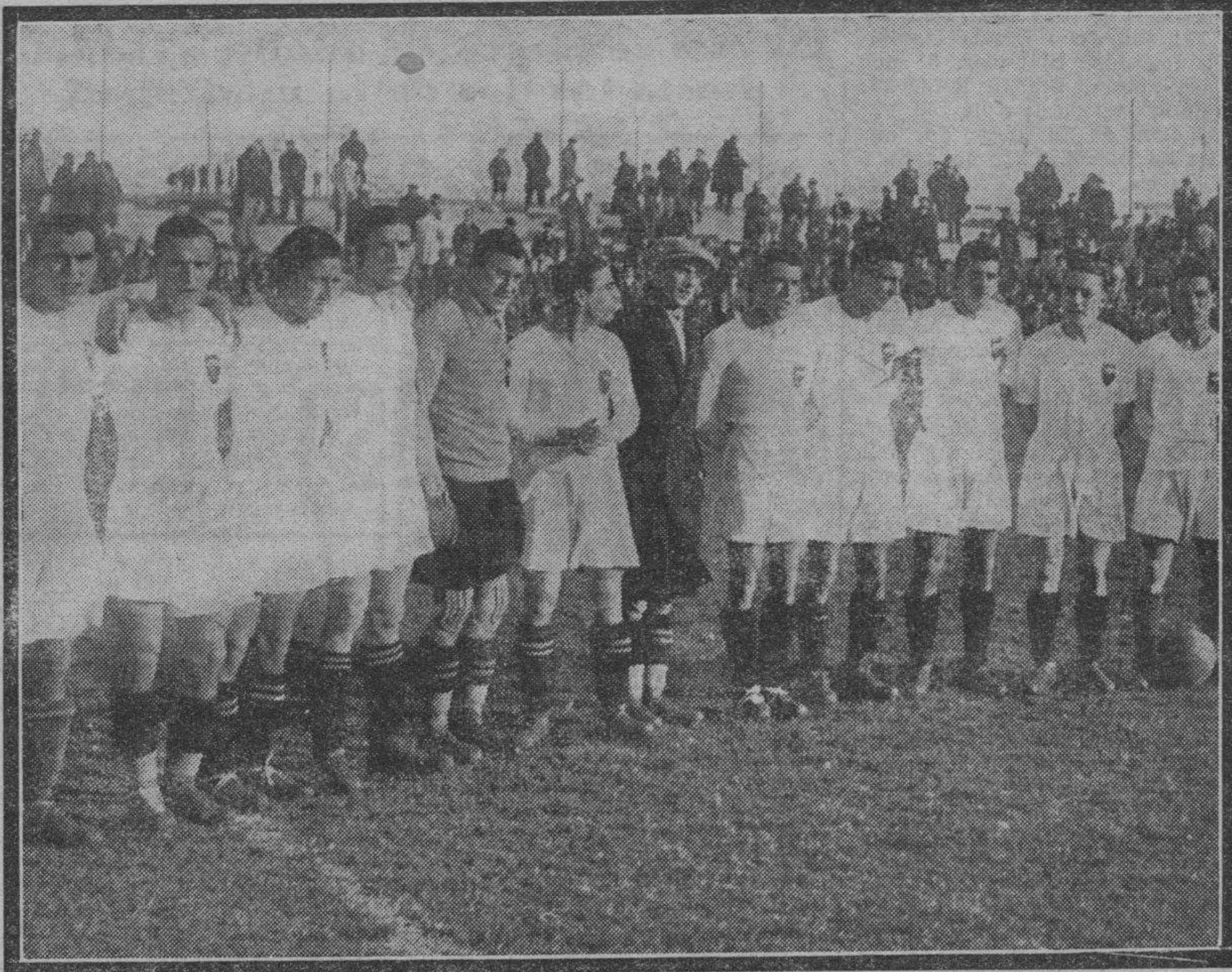
Los muchachos del Valencia

La presión rojiblanca durante estos veinte minutos a que estamos haciendo referencia es inenarrable, y por ello no nos detenemos a reseñar los tiros y jugadas peligrosas, porque nunca terminaríamos. Nos limitamos a los goals y ellos dan sensación de lo ocurrido en el campo de Chamartín.