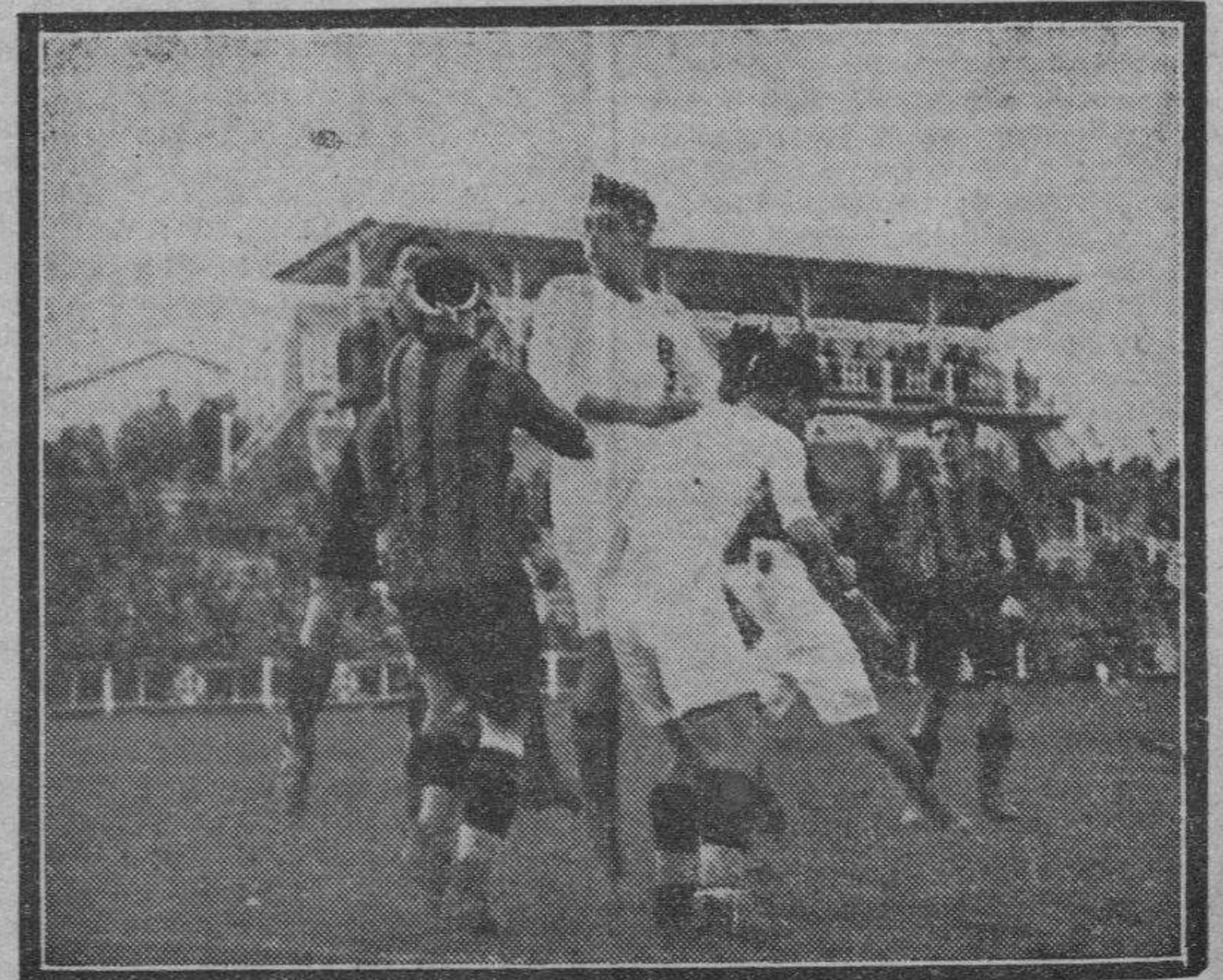
Navarro rematando con la testa un saque de esquina.