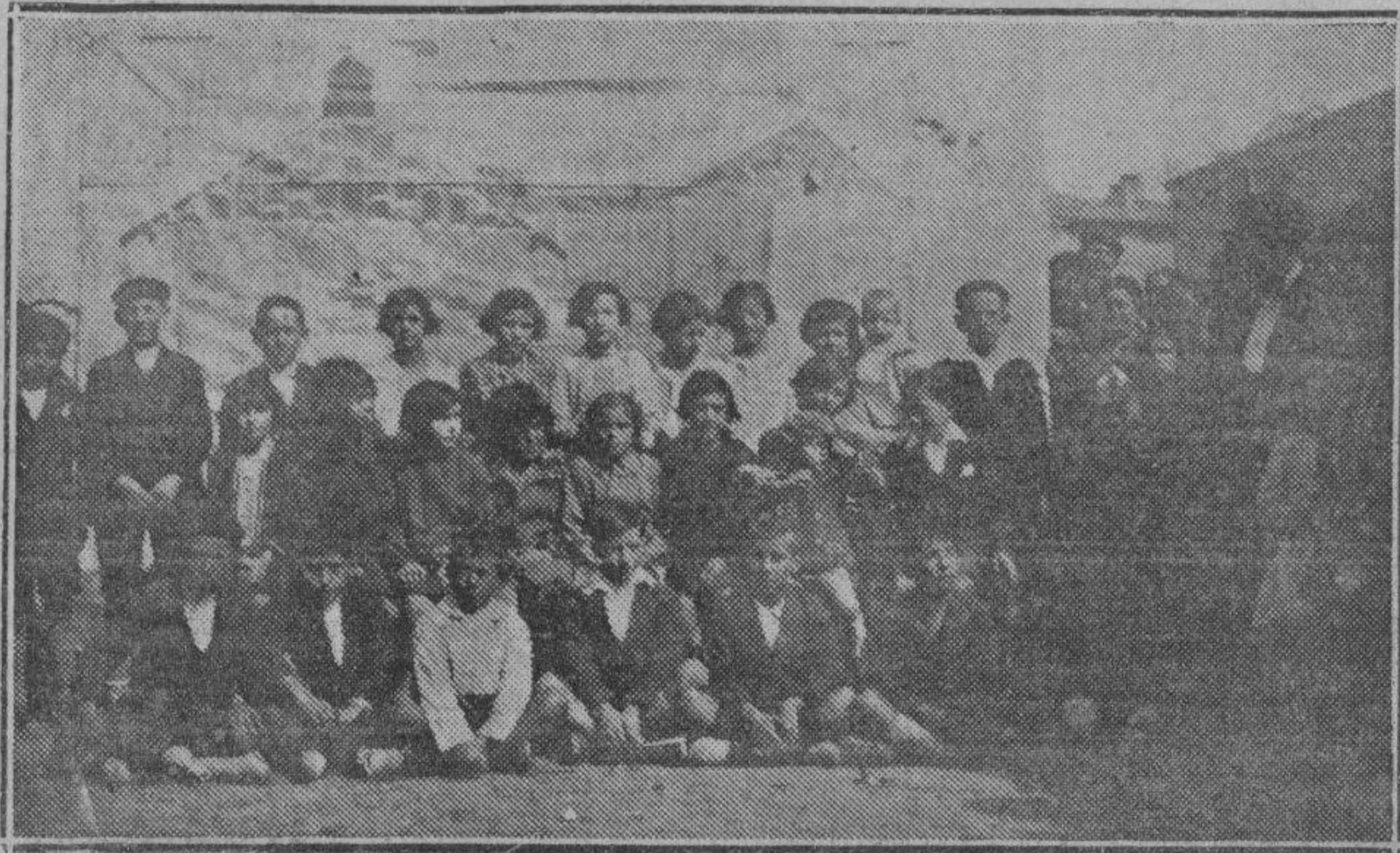
PRADILLA DE EBRO.—Durante la fiesta celebrada con motivo del homenaje a la vejez, se impresionaron diversas placas.—Una de ellas es esta que publicamos