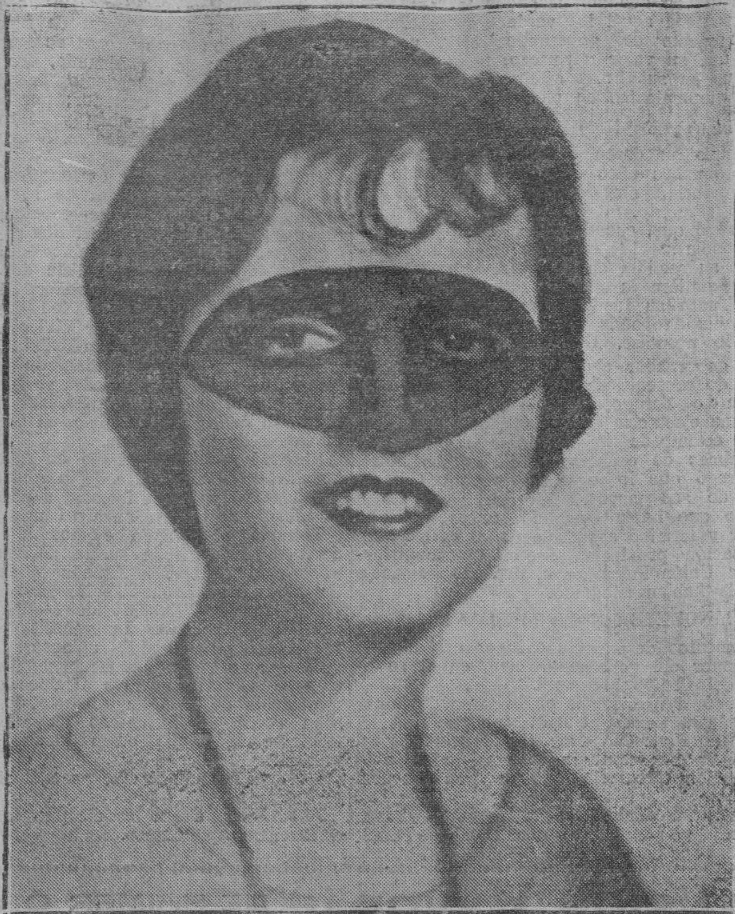
¿Qué artista de la pantalla se oculta tras este antifaz?

gracia consabida, interpretan Loreto Prado, Enrique Chicote, Castrito y demás elementos de esta Compañía, quienes desde su «debut» están consiguiendo reunir diariamente en Parisiana a lo más selecto de nuestro público.