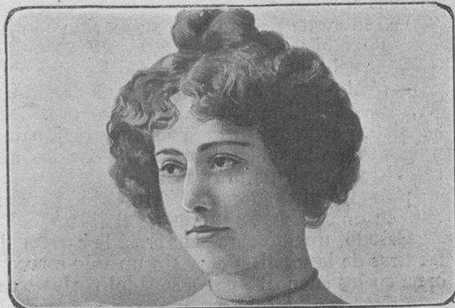
Pero esa rubia, pero esa rubia, pero esa rubia me gusta más.

Ocho días más tarde verificóse el sorteo, y ¡cuál no sería la sorpresa del alemán al examinar la lista que un aficionado llevó á la cervecería y ver que el 12.345 había salido premiado con el gordo, 500.000 marcos en buena moneda. ¡Qué barbari-