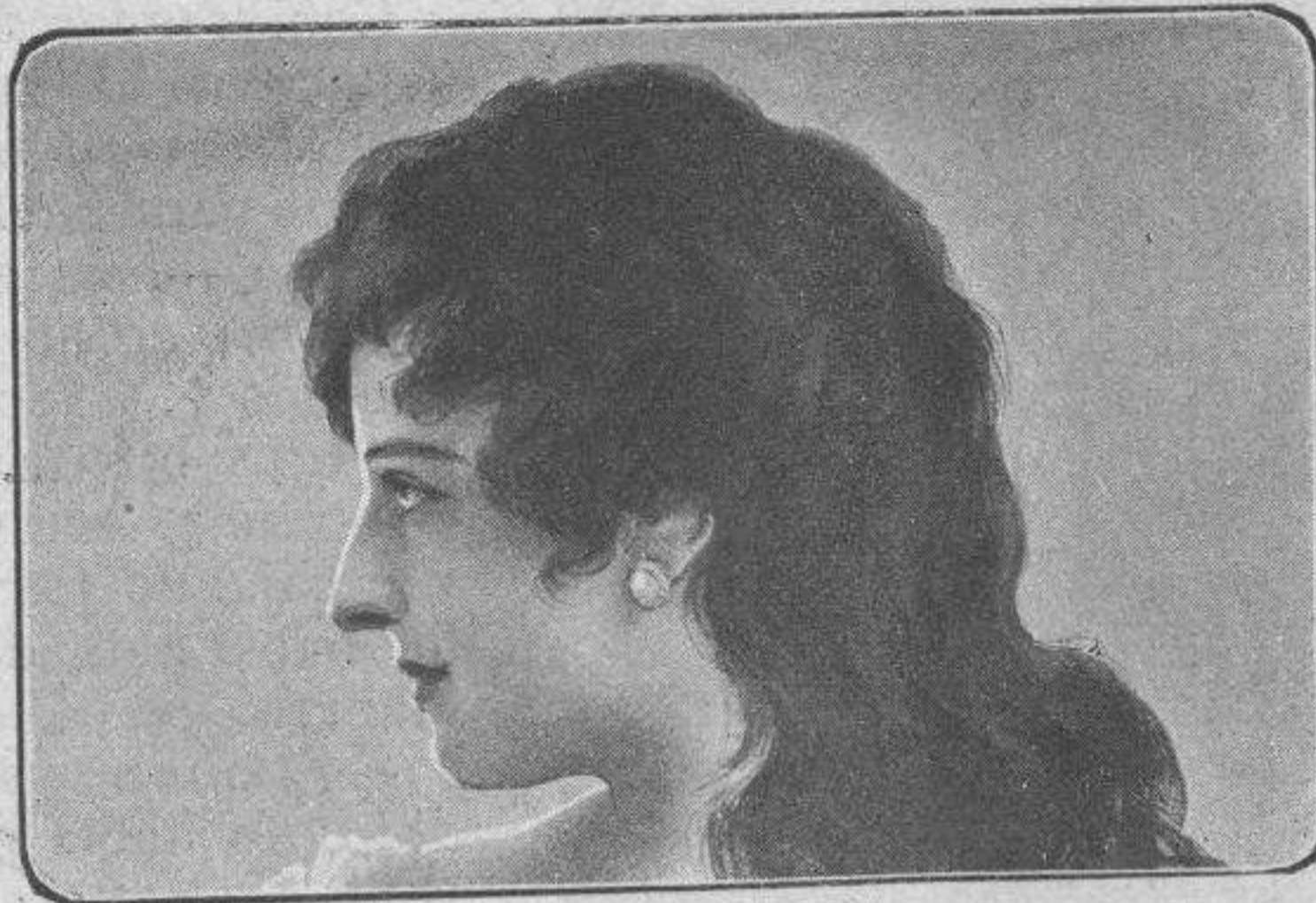
Me gustan todas...

El solterón, avaro y receloso, frunció horriblemente el ceño y retrocedió un paso,