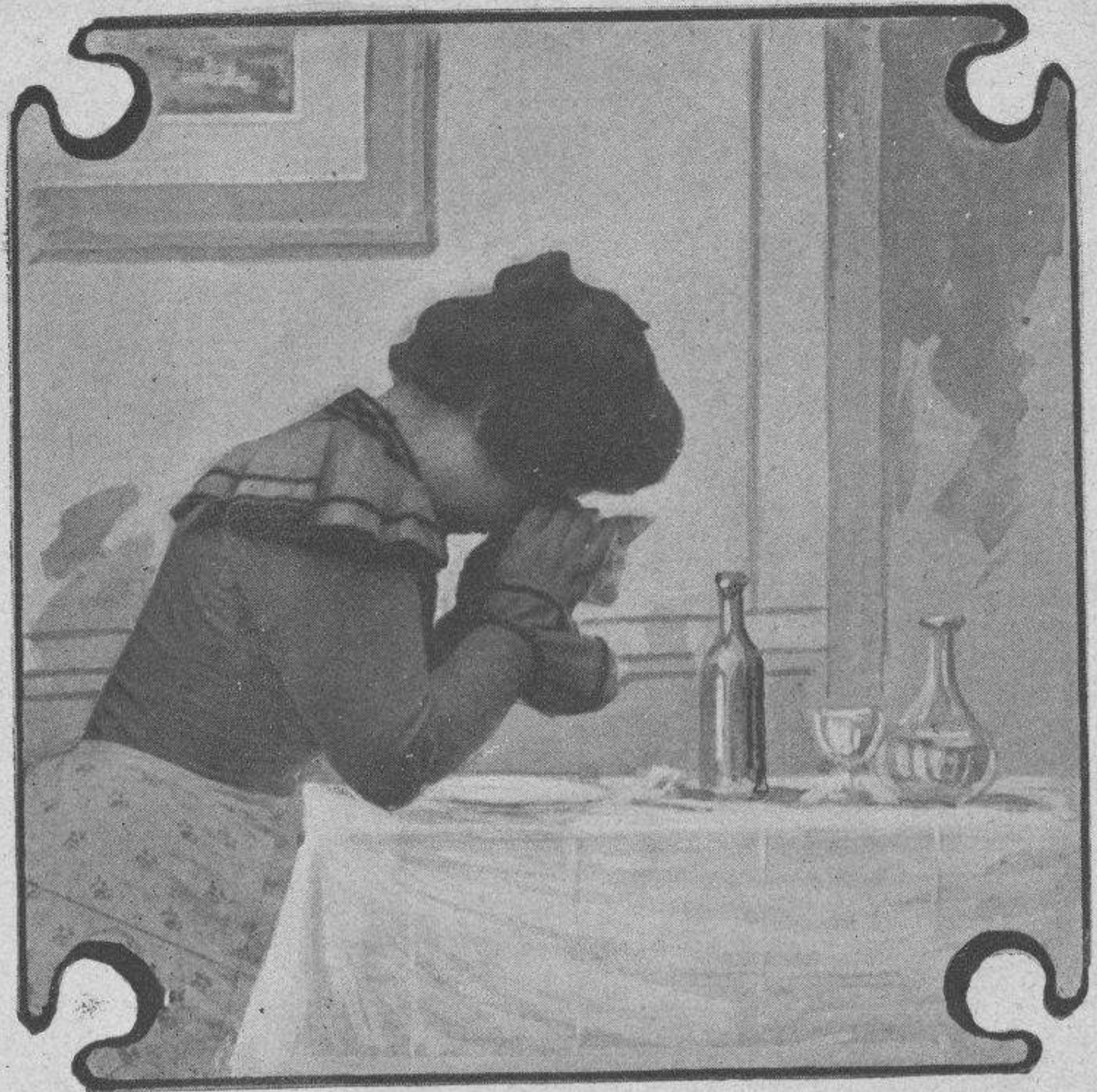
—¡Infame! ¡Traidor!... En una sola semana, ¡estar ocho ó nueve días sin venir á comer!

Y yo digo ahora: ¿un perro vale más que un hombre? Peor que eso: ¿puede un hombre compararse á un perro?