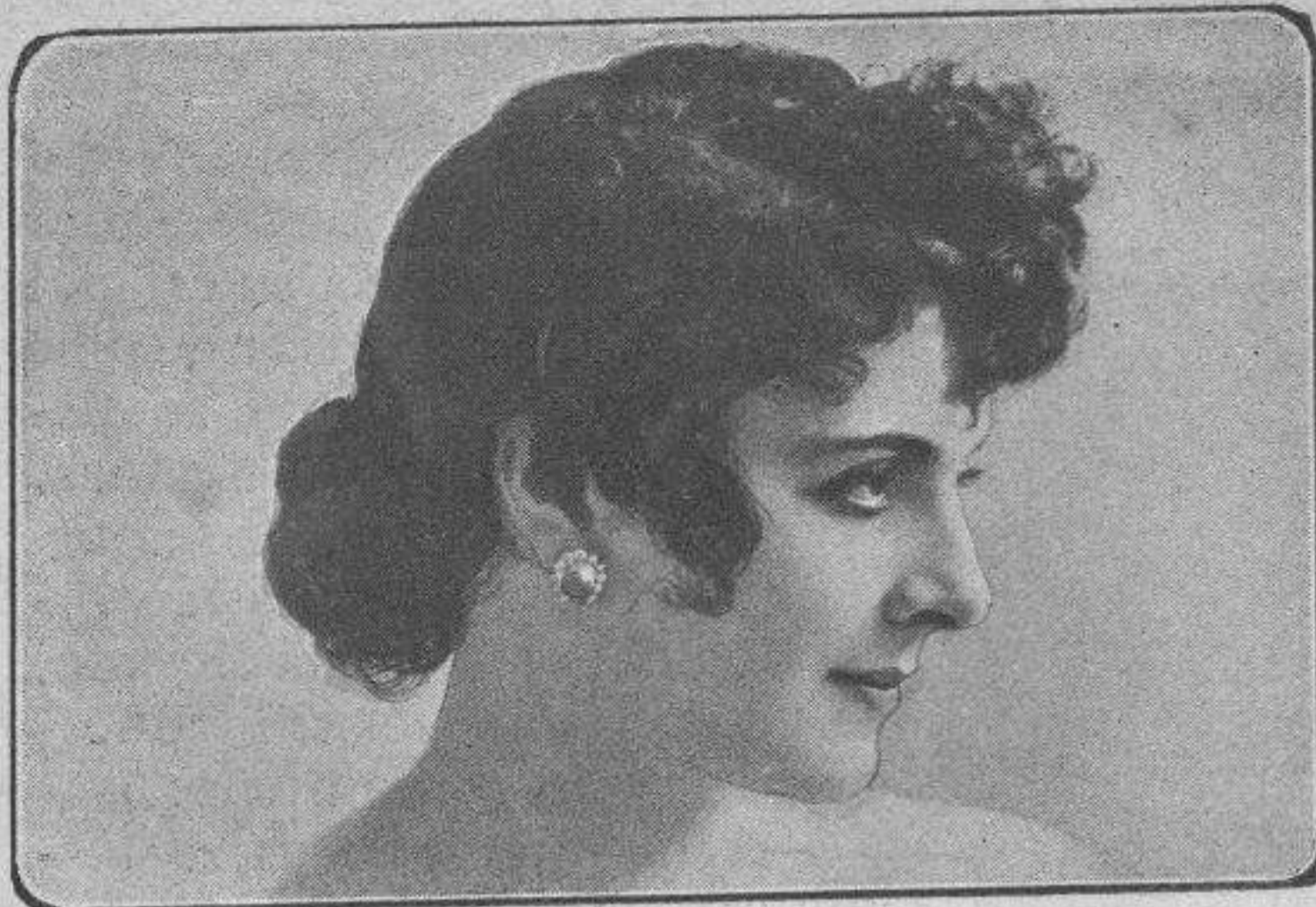
Me gustan todas..