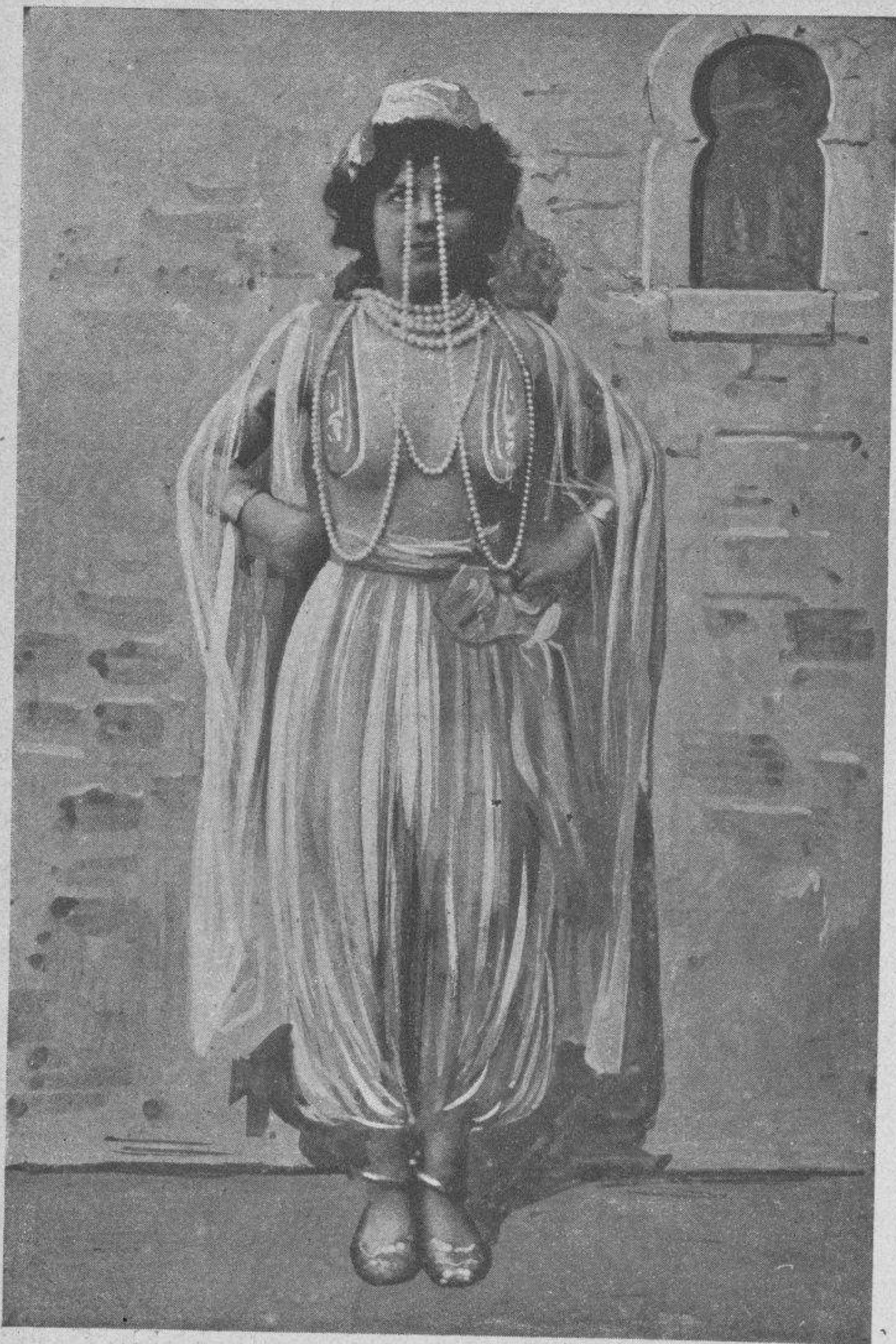
Esperando la señal para comenzar la danza...

Cautamente como buen alemán, el señor Fritz dejó pasar algunas horas sin abordar el asunto; pero al levantarse, al día siguiente de la boda, el enamorado esposo cogió por la cintura a su ex criada y le dijo amorosamente: