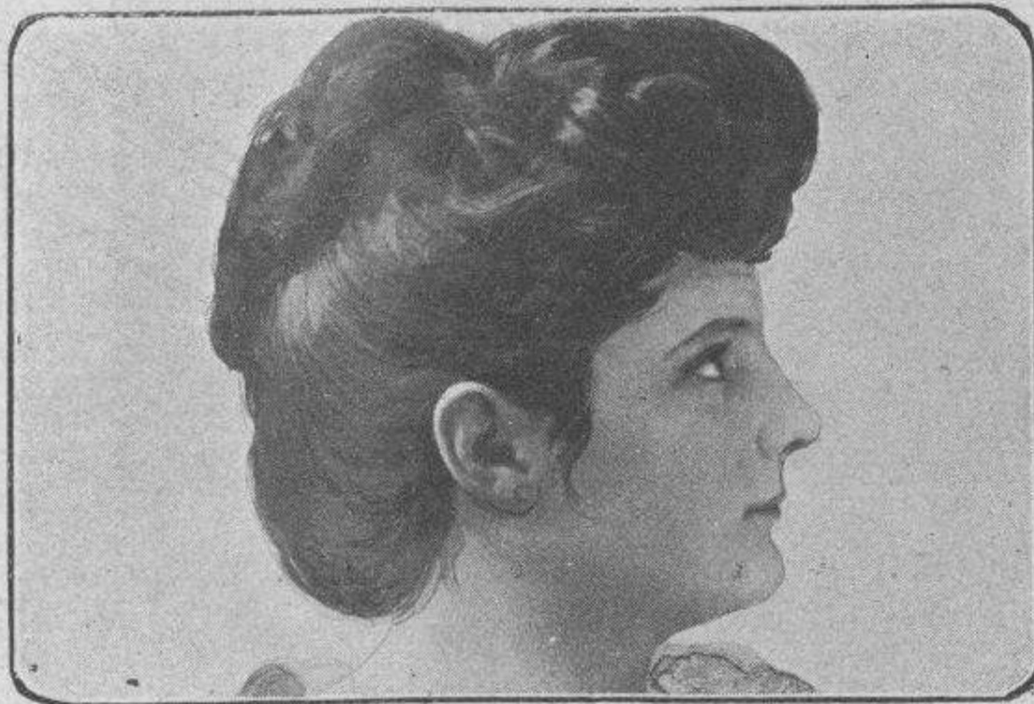
Me gustan todas, en general...

como si le hubiesen pinchado en lo más hondo del organismo.