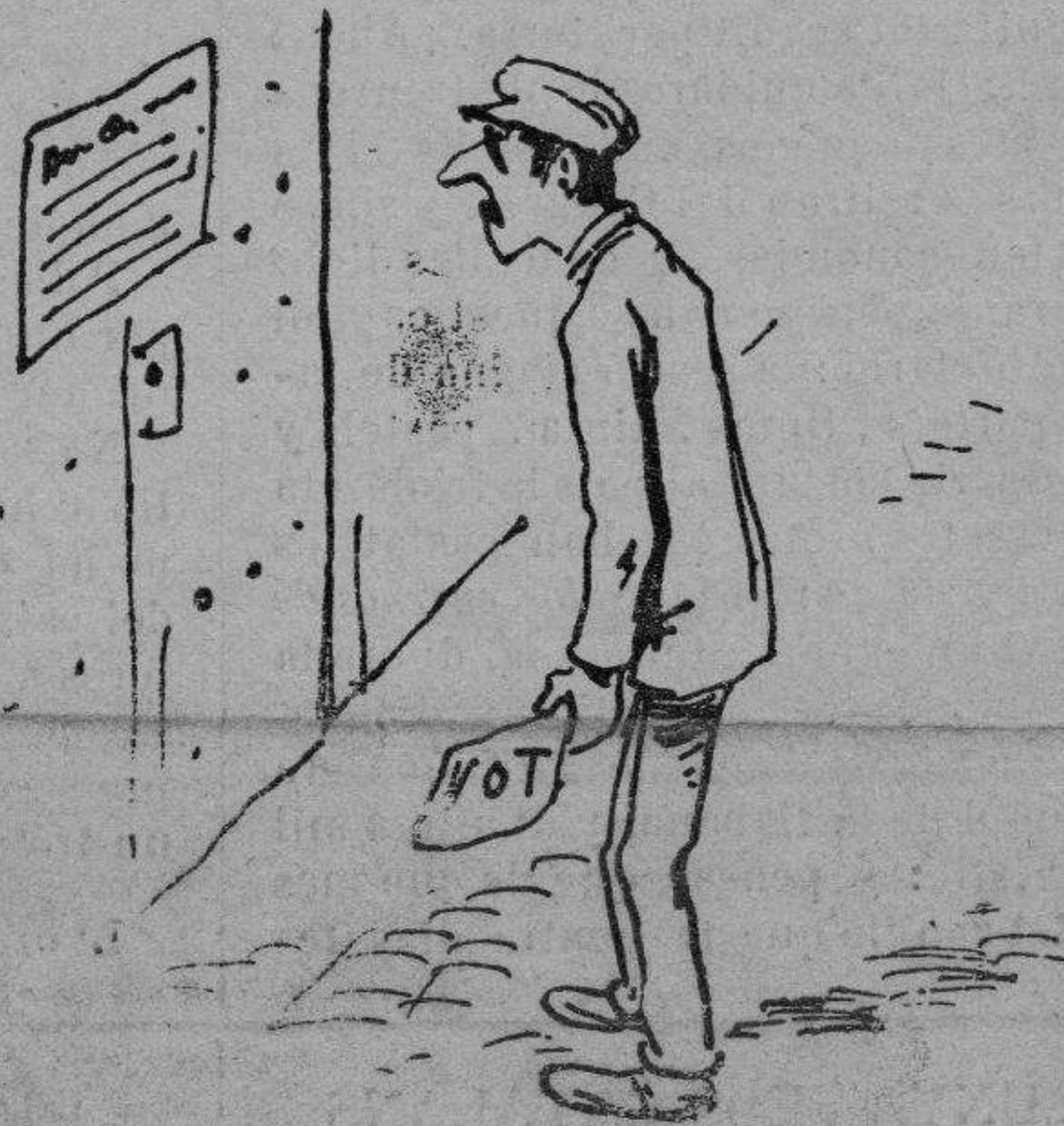
¡Jo que m' haguera guanyat uns quants duros!