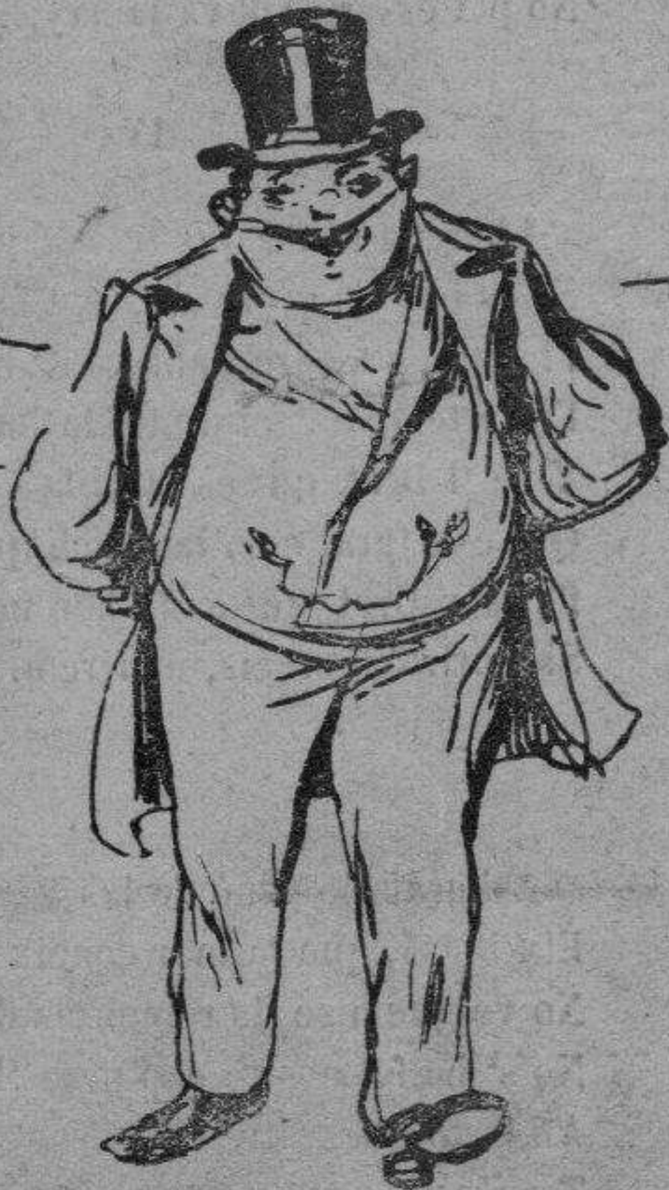
¡Jo que haguera sortit derrotat!