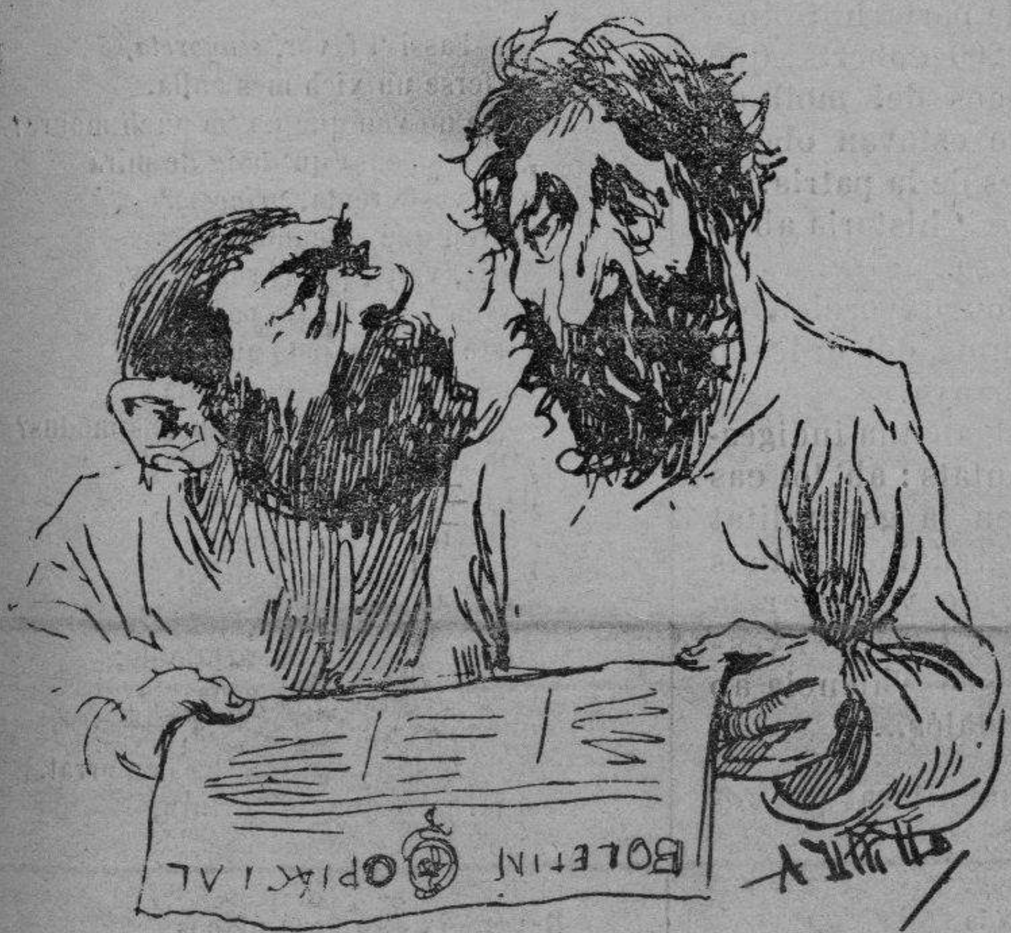
¡Jo que havia de sortir regidor!