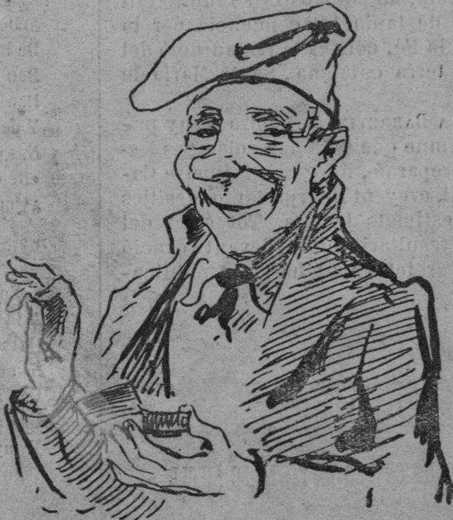
Tonto es el que si enfada ab aquestas cosas...