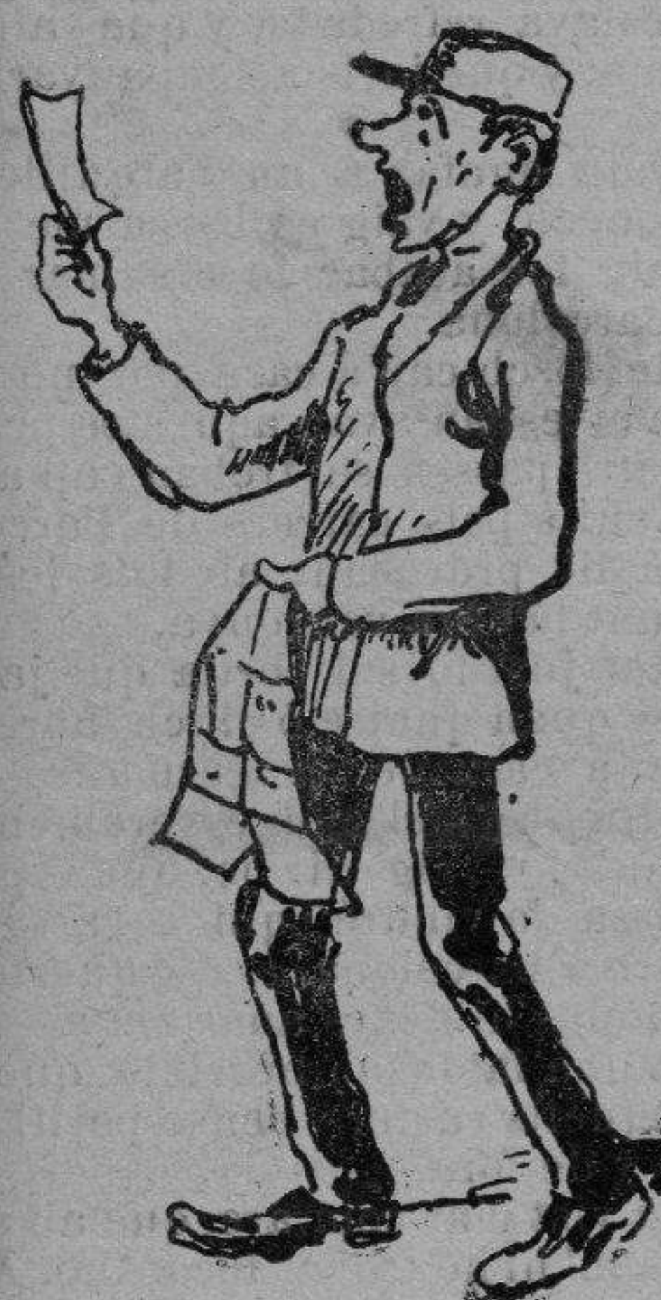
Lo 9,999 que 's treu demá.