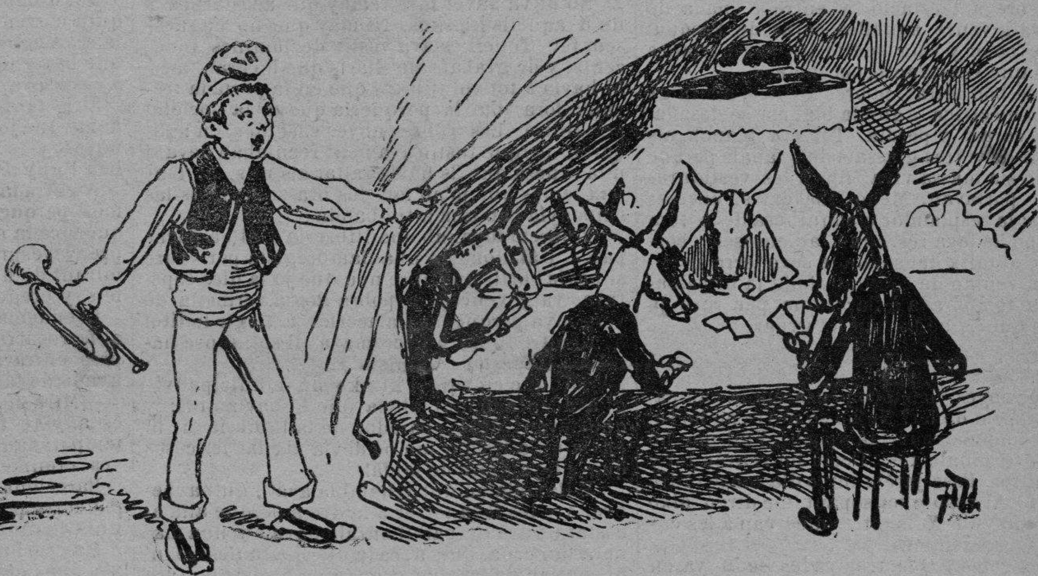
Lo que fan molts.