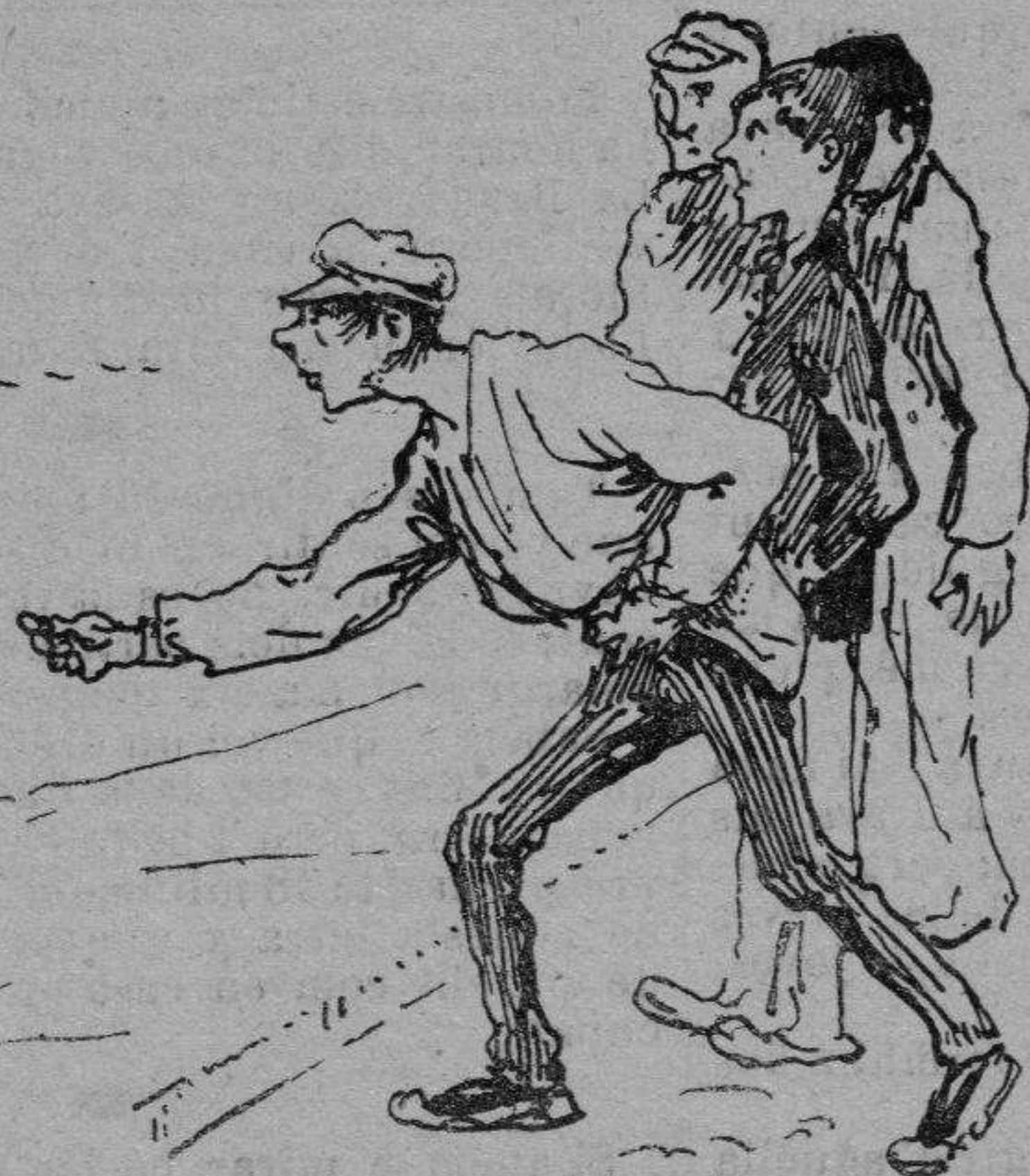
Noys del porvenir.