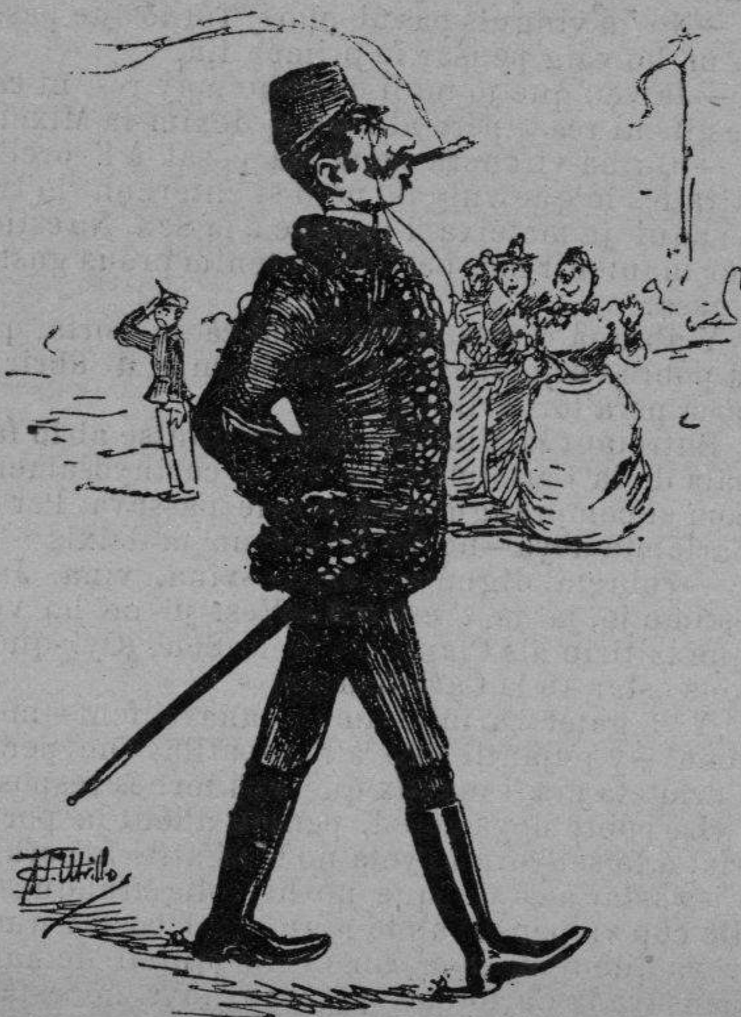
Una guerrera que no fa guerrero.