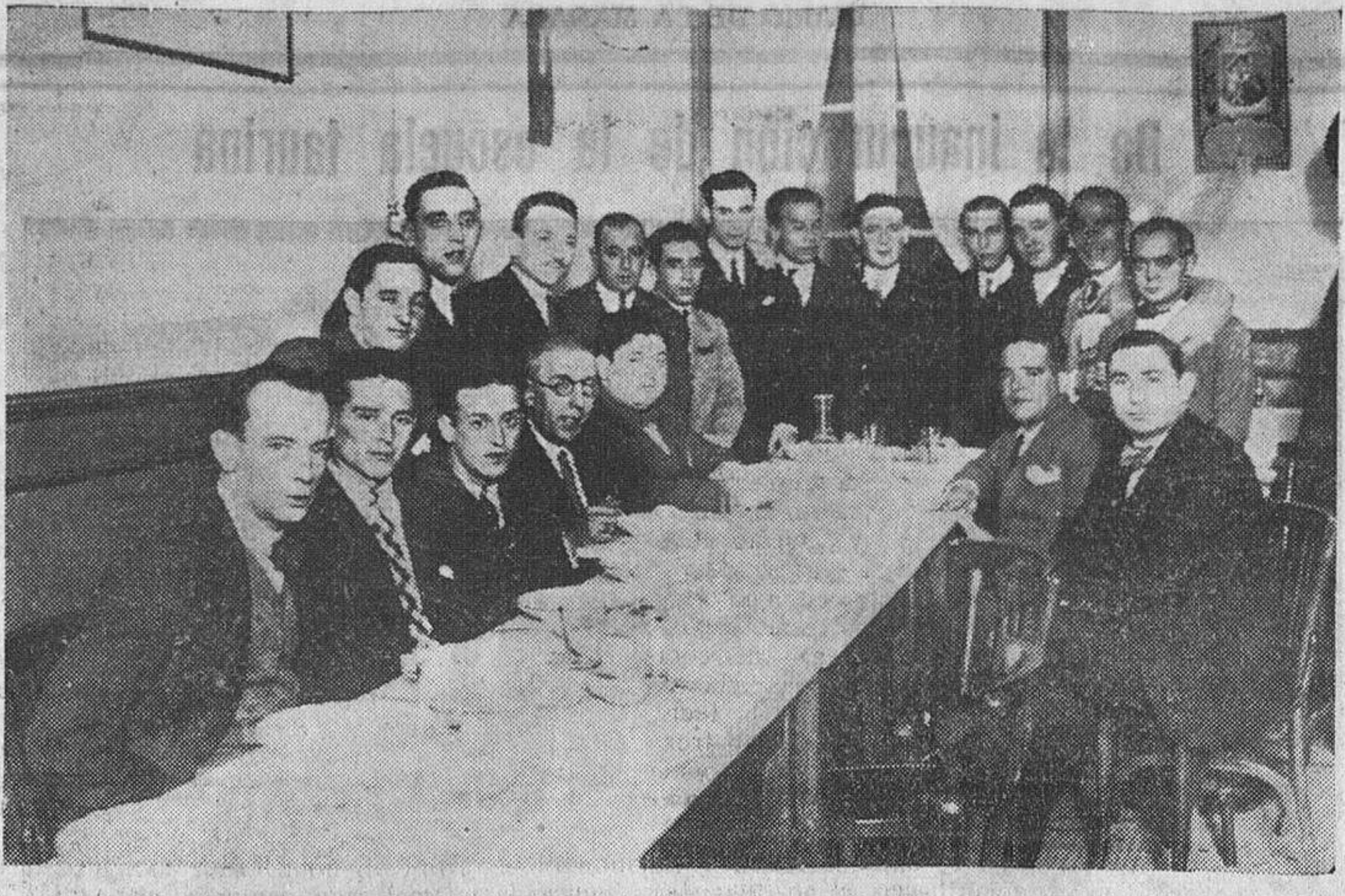
Los afiliados a la Unión de Patronos Peluqueros y Barberos, que se reunieron en banquete, la noche del lunes, para festejar el primer aniversario de la constitución de la Sociedad.

ERUPTIONES DE LOS NIÑOS. Se curan con rapidez con DEPURATIVO INFANTIL Y PASTA POROSA CABALLERO. Da venta en droguerías y farmacias.