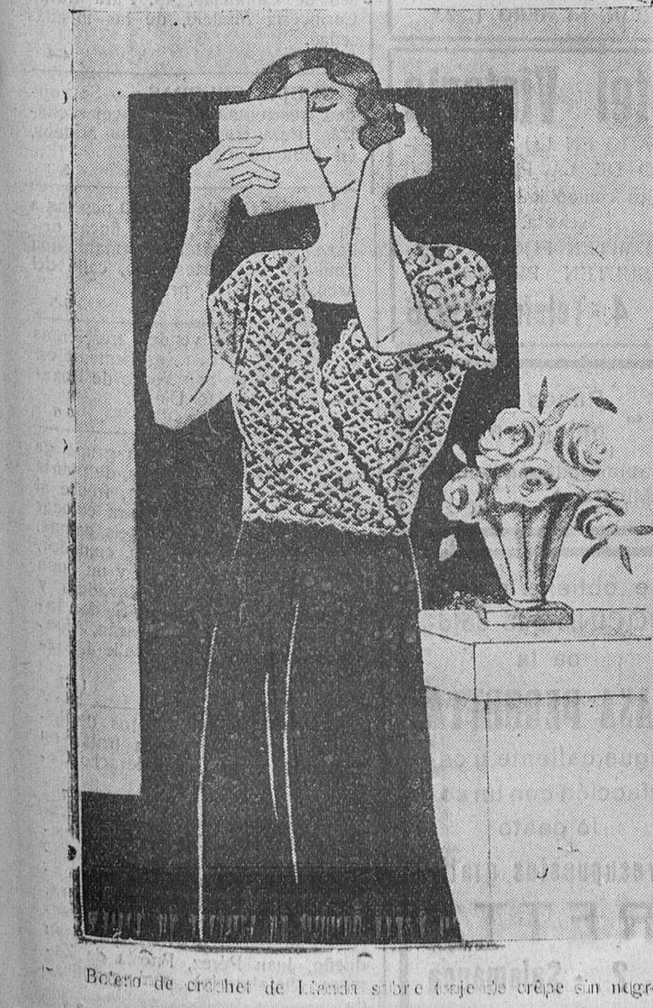
Batería de cachet de Landa sobre traje de crúpe sin negro