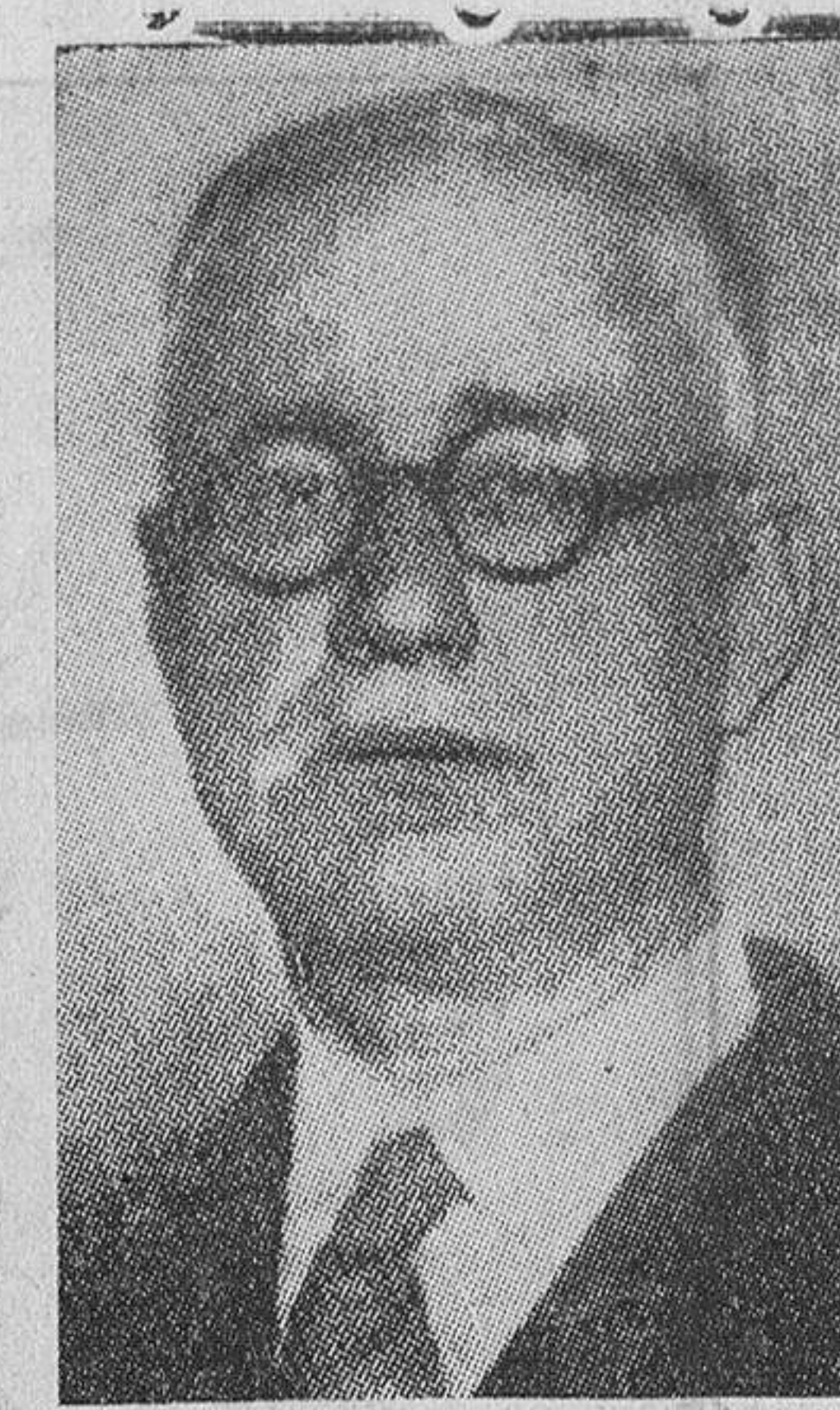
El ilustre escritor señor Diez-Candeo, candidato a la Academia Española.