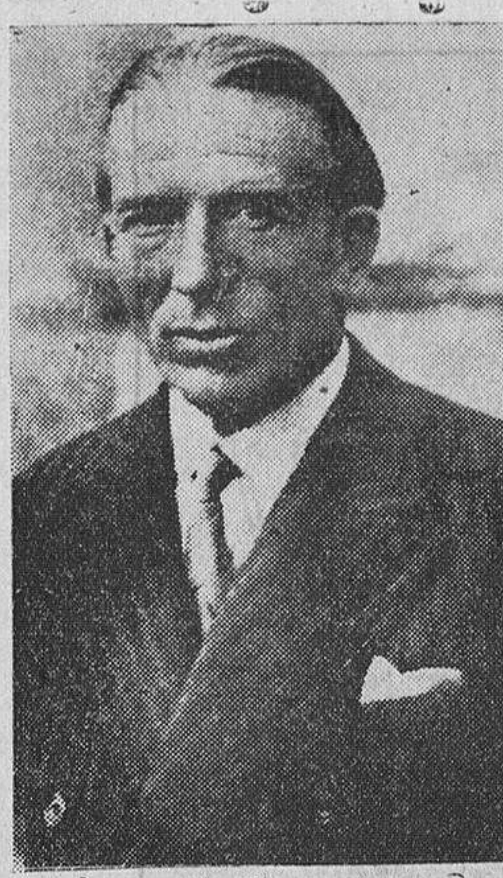
El eminente cirujano español, doctor don José Goyanes, que ha marchado a América del Norte, como invitado de honor del Congreso de Cirujía que se celebrará en breve en aquel país.