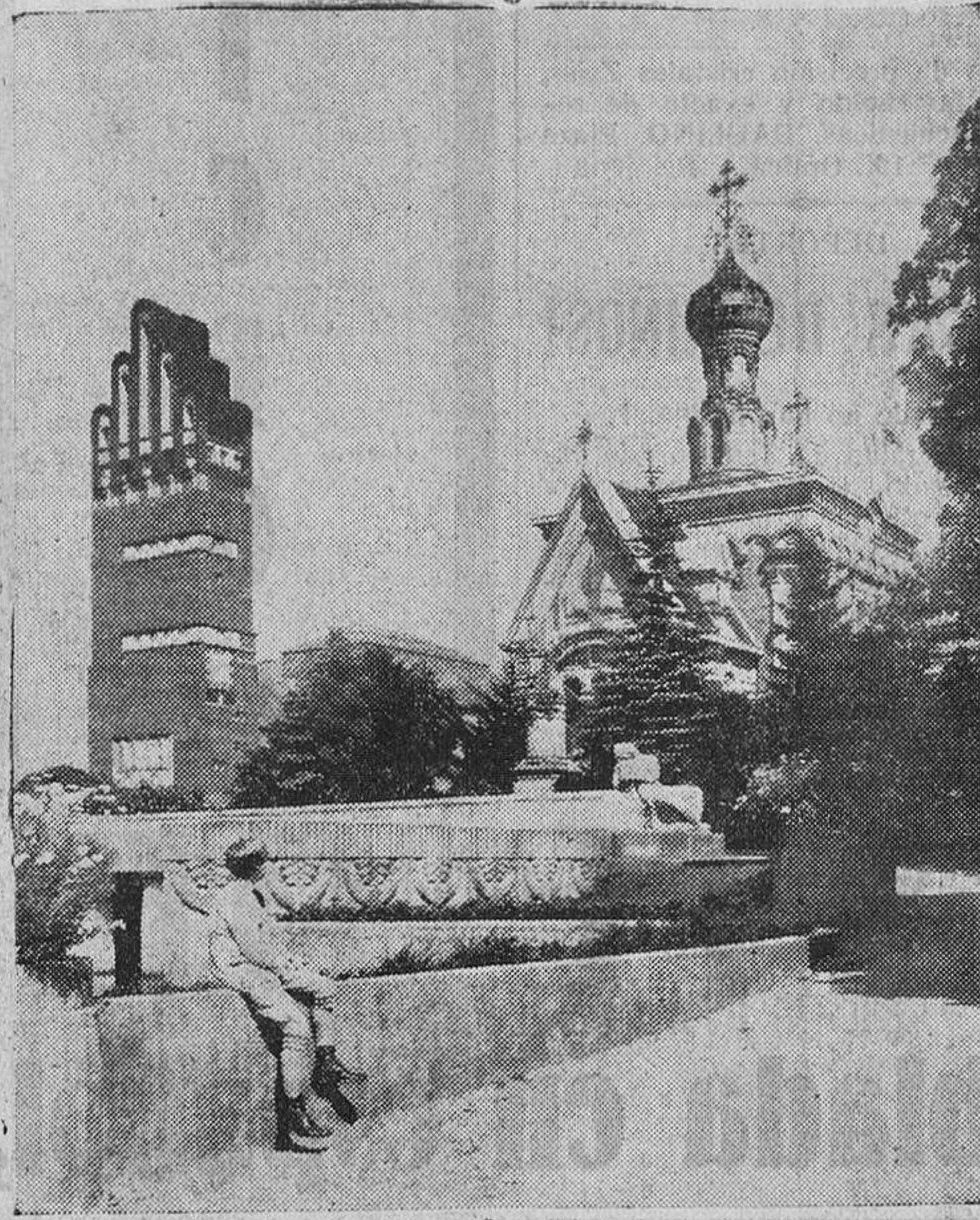
Darmstadt (Alemania).—La Torre de los Despoorities y la iglesia rusa forman un curioso contraste arquitectónico

de Rembrandt, de esa "Diana Cazadora" de Rubens, de esa "Madrugada del Burgomaestre Meier" de Holbein. Magníficas colecciones de objetos artísticos de carácter y origen regional, gran número de li-