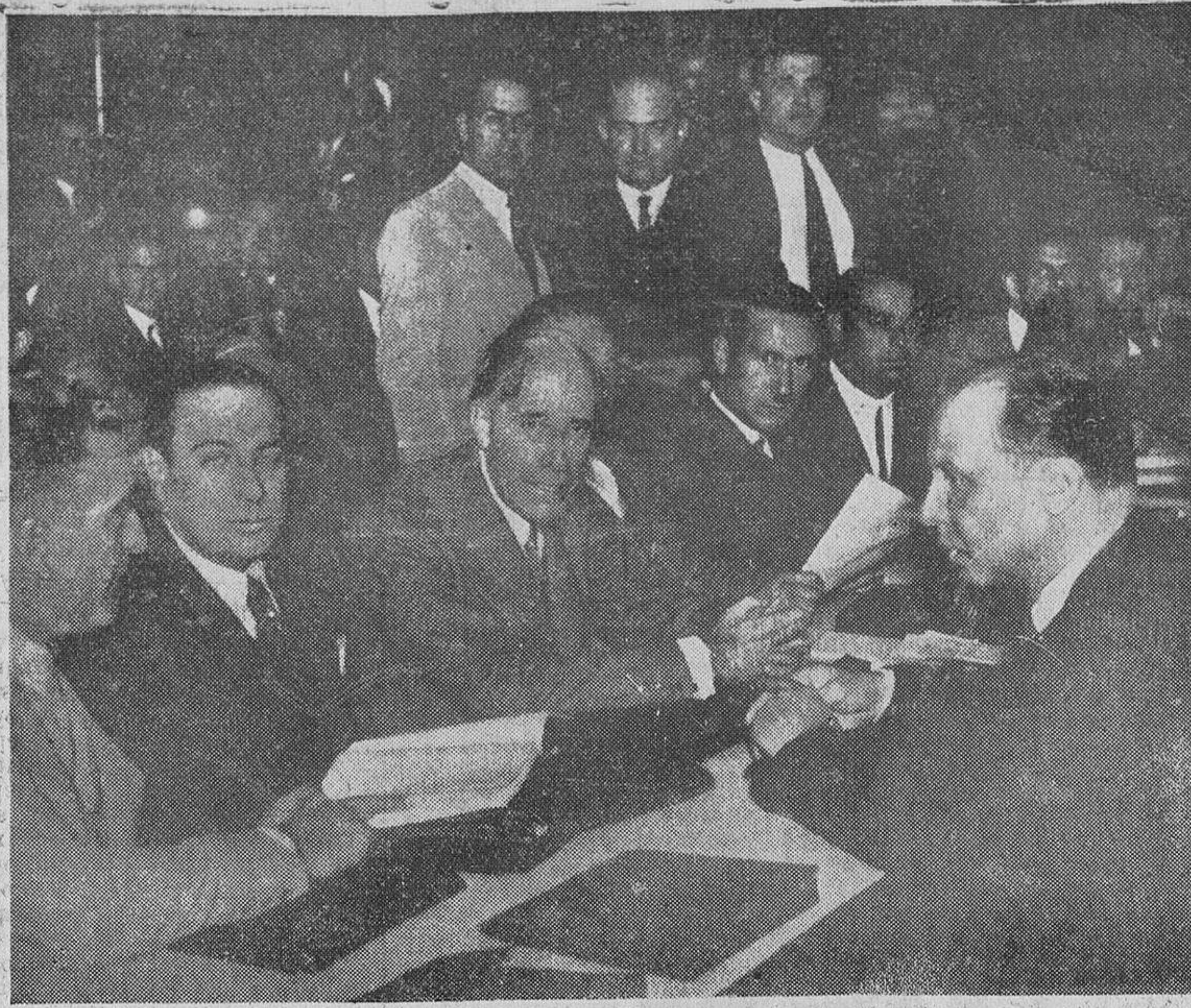
Los señores Besteiro y Jiménez Asúa, en una de las sesiones del Congreso Socialista que acaba de clausurarse