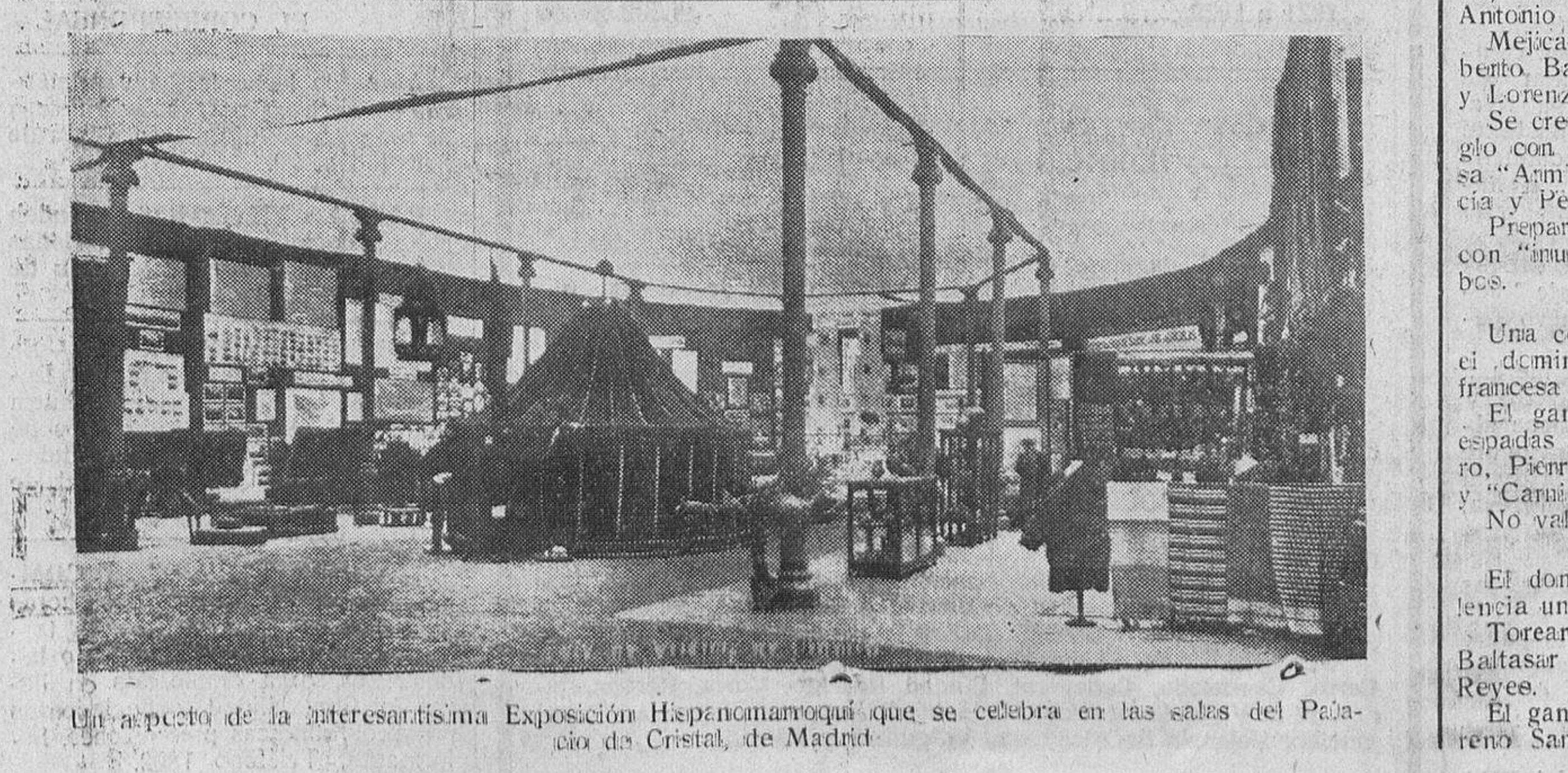
Un aspecto de la interesantísima Exposición Hispanoamericana que se celebra en las salas del Palacio de Cristal, de Madrid.