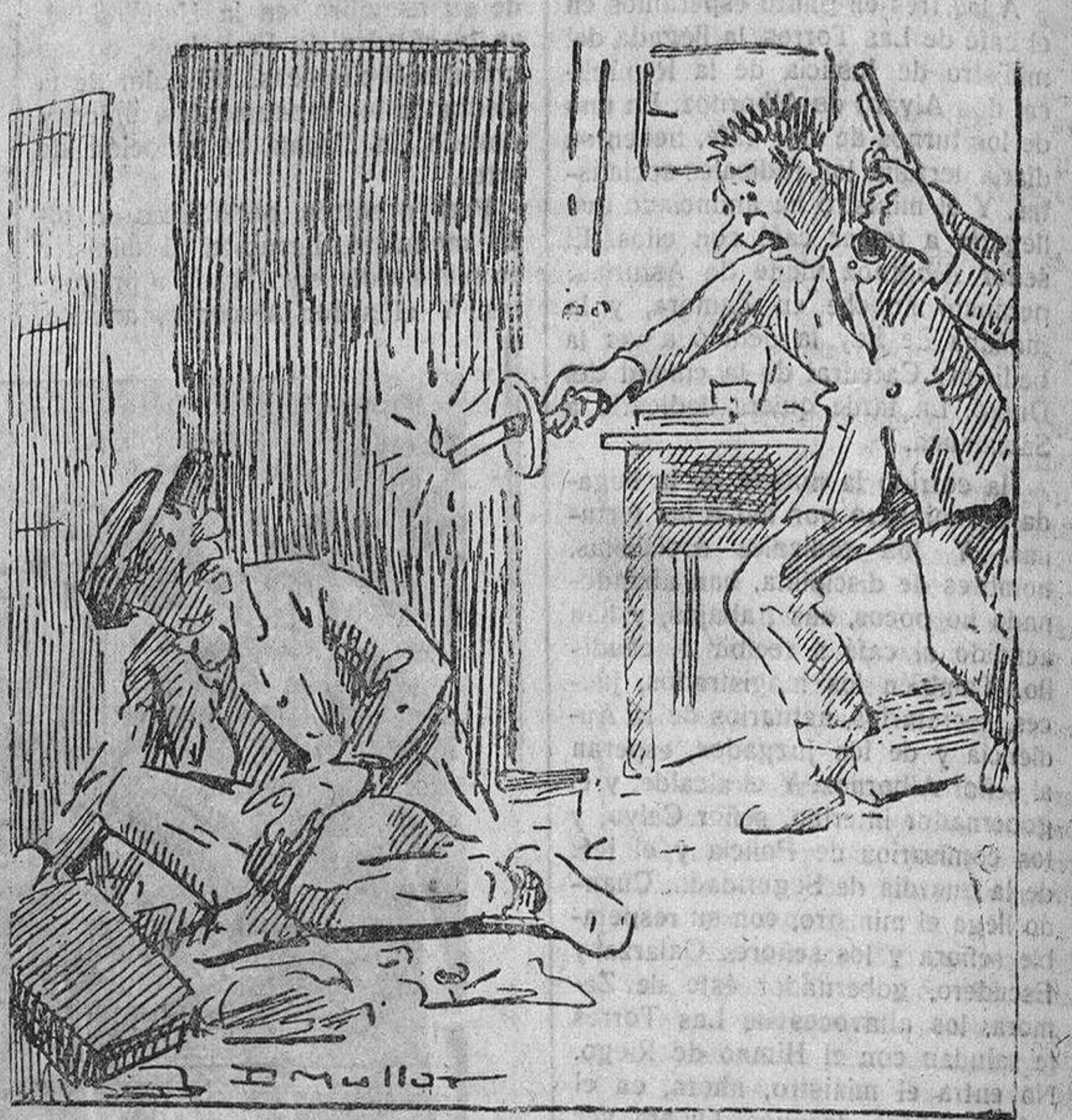
Manos arriba, o hago fuego!