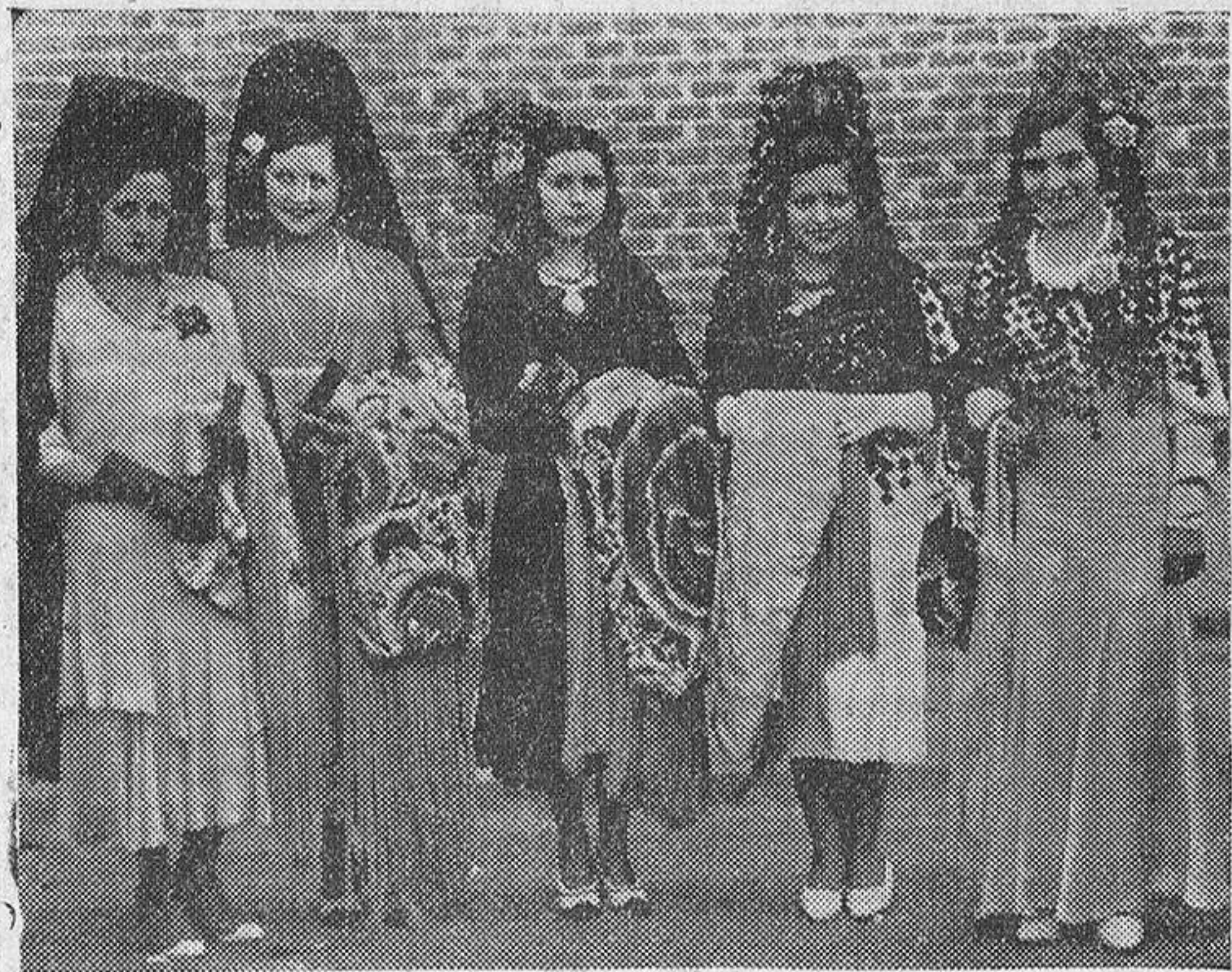
Las bellas presidentas del festival.