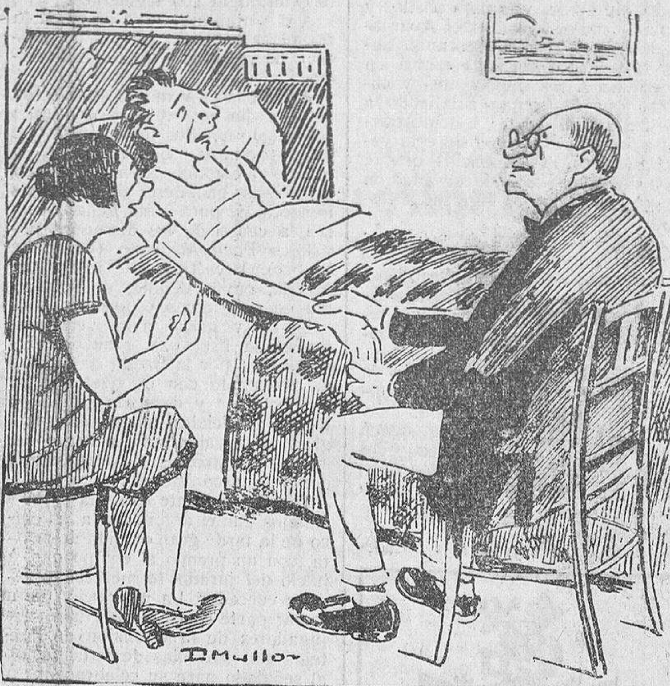
—Doctor: lo que le sienta como un tiro es el tabaco. —Va dije que no fumara más que un cigarro en cada comida. —Sí, pero como él no ha fumado nunca...