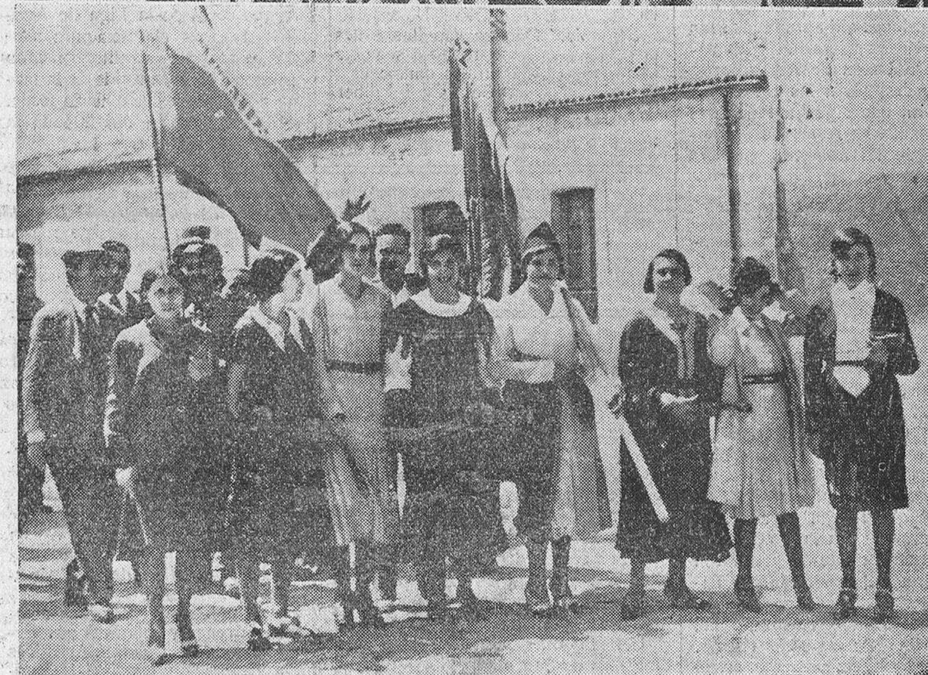
En primer término.—Un aspecto del andén de la estación a la llegada de los trenes que conducían representaciones con sus banderas, de pueblos de la provincia.—Segundo, La cabeza de la manifestación a su paso por la Avenida de Mirat.—Tercero.— Grupo de obreras modistas con su bandera.