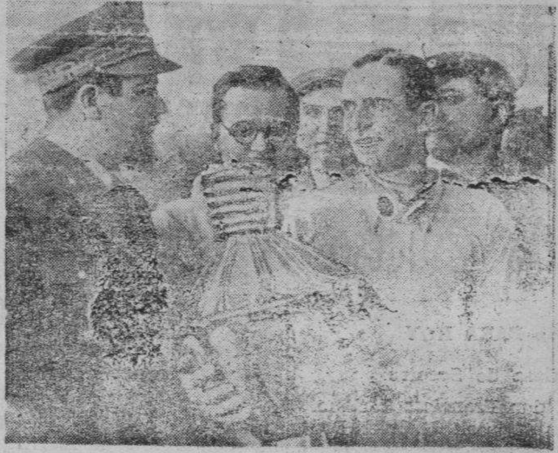
LA ENTREGA DEL PREMIO AL VENCEDOR DE TRIPOLIS.

Pues bien, dado ese modo de ver, dada esa serie de prejuicios que por desgracia todavía se mantienen, no es extraño que esta