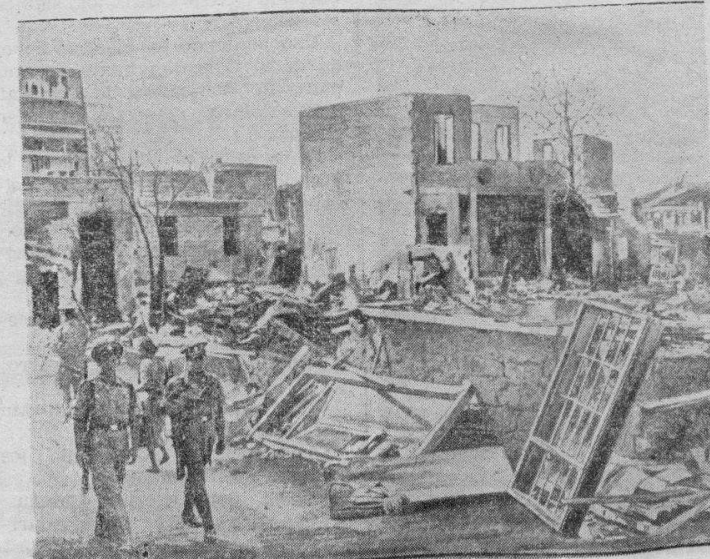
LOS GRAVES SUCESOS Y SITUACION DE PALESTINA En la ciudad judía aneja a Tel-Aviv, los árabes han asaltado y destruido muchos edificios. En la barrida que muestra la foto, llegaron hasta la completa destrucción de numerosas edificaciones.