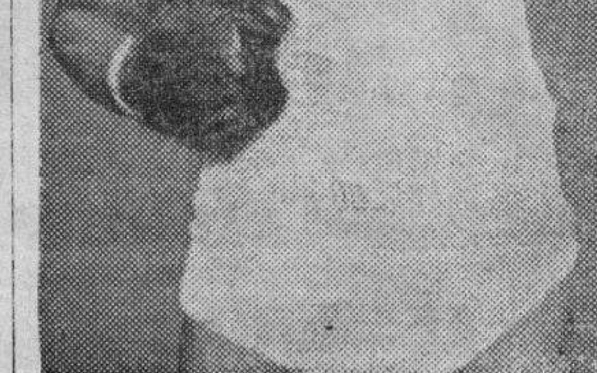
EL NEGRO JOE LUIS

Dentro de poco se enfrentarán Max Schemehling y Joe Luis, cuyo "match" calificará para el Campeonato mundial del peso pesado.