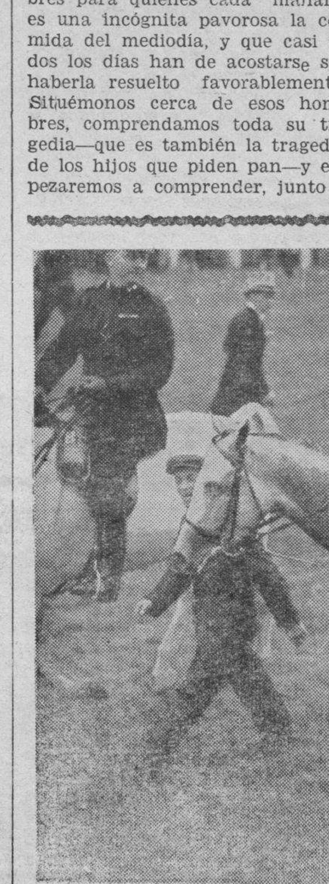
AGA KHAN GANA POR TERCERA VEZ EL "DERBY" DE EPSOM

el maharajá Aga Khan ha ganado por tercera vez la importante carrera de caballos que es el "Derby" de Epsom. Héro aquí retratado con el caballo de pura sangre "Mahmoud" al llevarlo después de la carrera al peso.