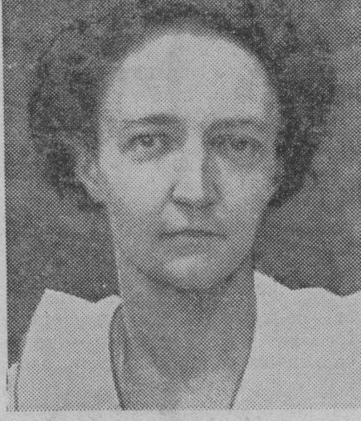
MME. JOLIOT-CURIE hija de la famosa Madame Curie, ganadora del Premio Nobel, a quien ha sido ofrecido el ministerio de Sanidad por el Sr. Leon Blum.