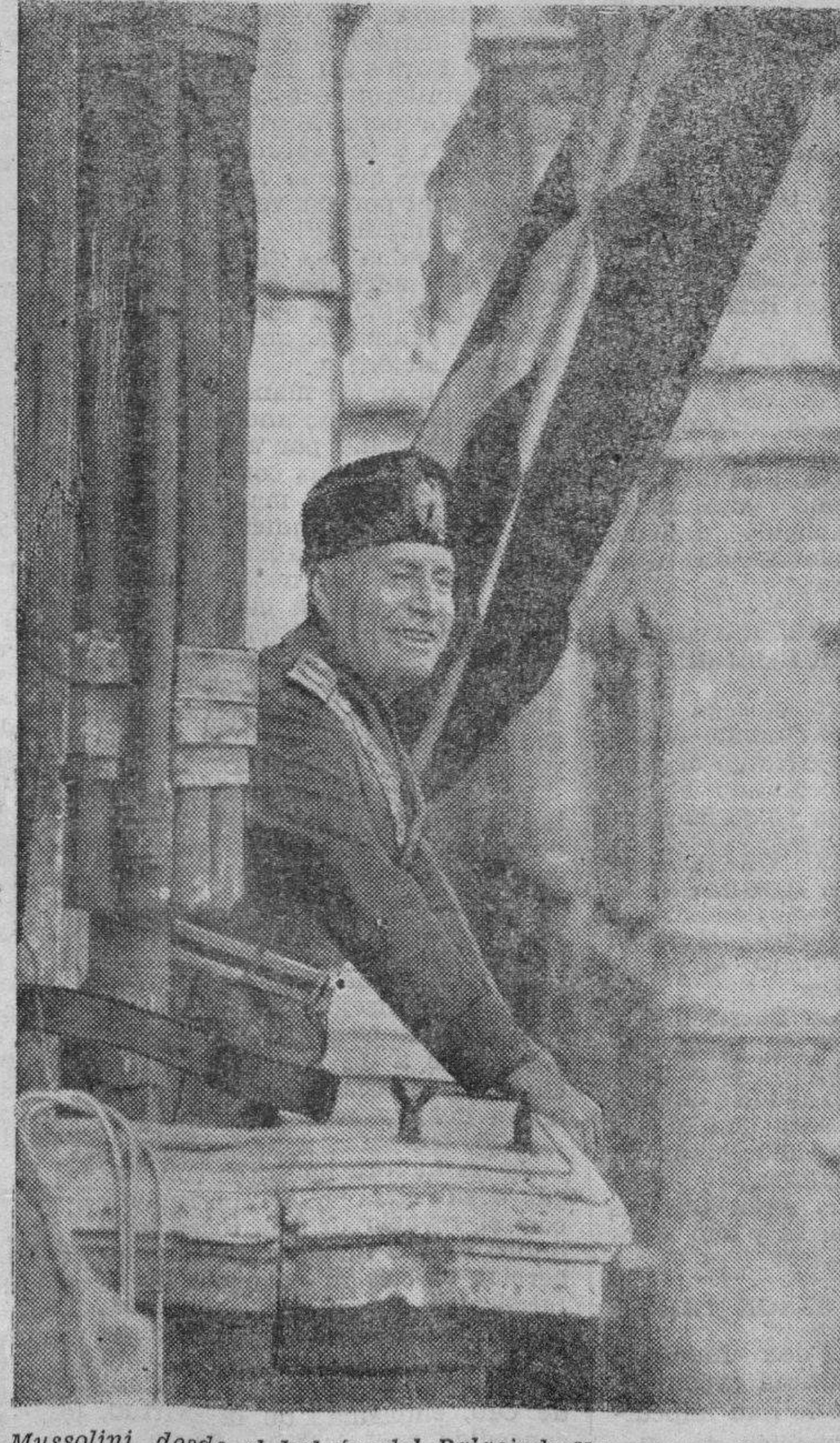
Mussolini, desde el balcón del Palacio de Venecia, en Roma, da cuenta al pueblo de la fundación del nuevo imperio romano.

VISITA A LOS COMEDORES DE ASISTENCIA SOCIAL