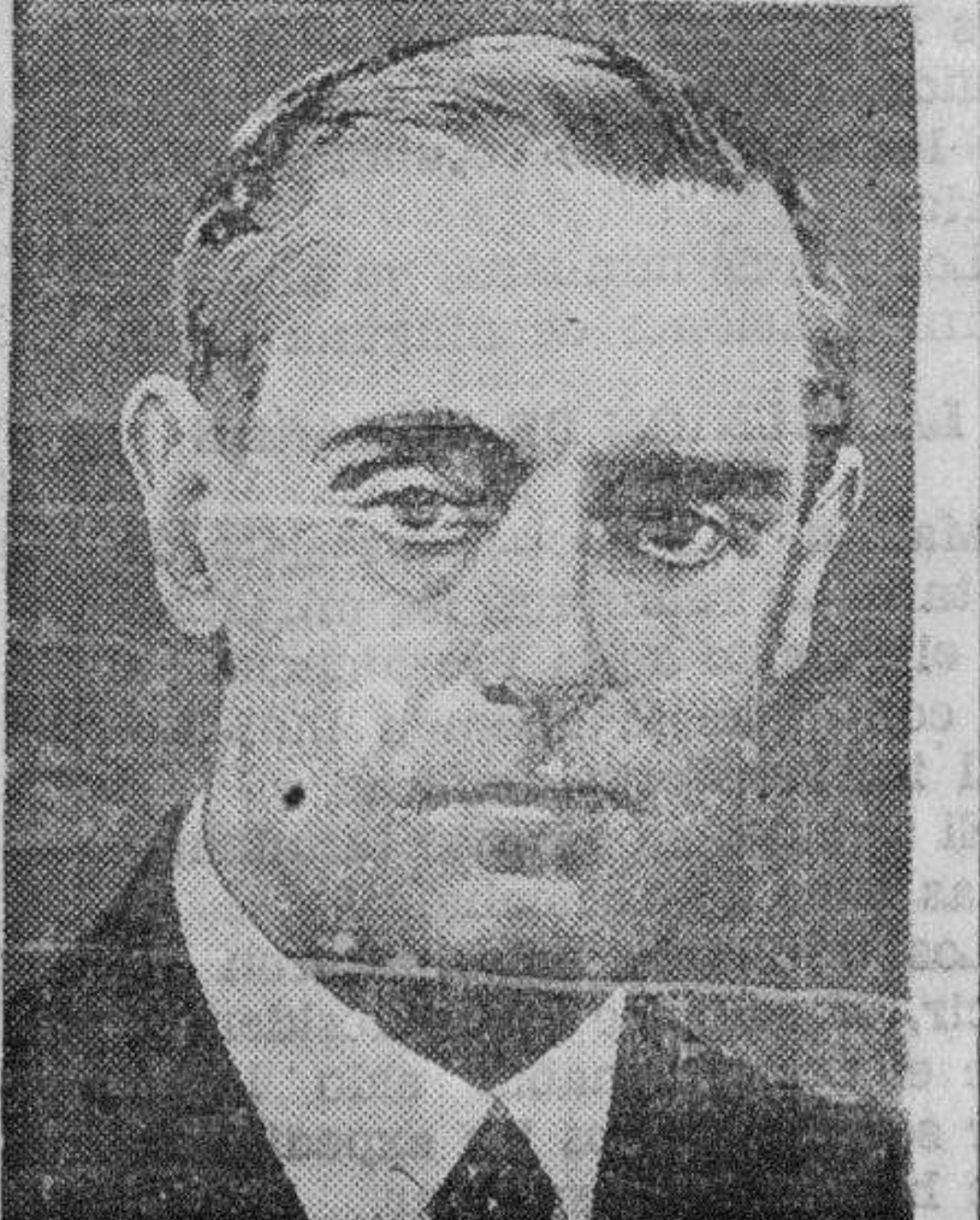
Lord Lintighjow, sucesor del virrey de la India inglesa

En la mañana de hoy celebrará sesión ordinaria la Comisión gestora provincial, para despachar los diversos asuntos que figuran en el orden del día siguiente: Documentos referentes a ingresos de enfermos en el Manicomio.