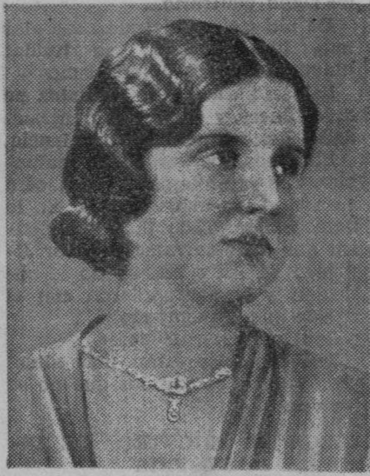
Princesa Juliana, heretiera del trono de Holanda. Si estuviera tantas veces casada como los periodistas anunciarían su próximo enlace matrimonial con algún príncipe extranjero, hubiera que acusarla de bigamia

Personas de absoluta solvencia y que están dispuestas a obedecer al primer requerimiento de la primera autoridad civil de la provincia, nos denuncia el hecho siguiente: En el día de ayer y durante tres horas, desde las ocho de la mañana a las once, el sargento del puesto de la Guardia civil de Pechina permaneció en el Sindicato Agrícola reunido con los más caracterizados elementos derechistas del pueblo. Ese centro es el lugar de reunión de los fascistas del pueblo; en él tramaron los sucesos del domingo de Carnaval y a ese lugar de tan marcado sabor político, concurre la autoridad del sargento jefe del Puesto de la Benemerita, después de lo ocurrido. Al salir de dicha reunión tuvo lugar un pintoresco incidente que nos transcriben en la forma siguiente: «Se encontró con una hija de Faraón que al verle no le dió los buenos días y la llamó autoritariamente y una vez en su presencia y en voz alta para que lo escucharan algunas personas, le dijo que tenía la obligación de saludarle pues él no pensaba marcharse del pueblo.» Ante esta actitud provocativa tan recientes unos hechos dolorosos, creemos que en evitación de que vuelvan a repetirse, se gestione el traslado de quien tan ligeramente procede. Por el prestigio de un Cuerpo respetable y que debe ser respetado esperamos del señor Peinado Vallejo adopte las medidas que su discreción le dicte.