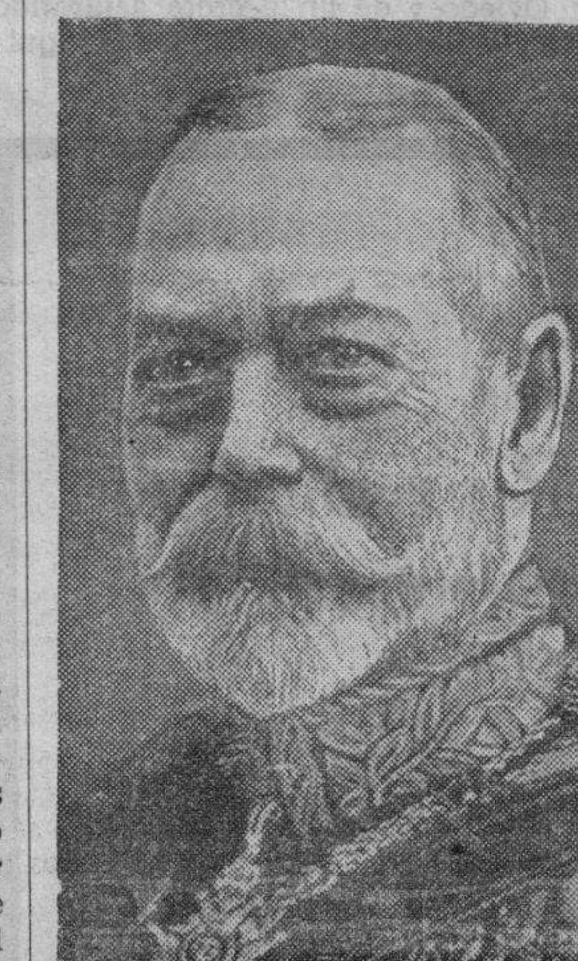
El rey Jorge V, de Inglaterra, que ha fallecido a los setenta años de edad.

Oviedo, León, Gijón, Burgos y Madrid, que en todo momento ha intervenido cerca de las autoridades correspondientes y Poderes Públicos en pro del mejoramiento del régimen de prisiones, que presta su más decidida colaboración a la campaña de Amnistía que desde ha tiempo viene realizando el Comité Nacional Pro-Amnistía; que con la colaboración de diversos partidos, organizaciones y personalidades y bajo la Presidencia de Honor del ilustre y glorioso escritor, D. Ramón del Valle Inclán, cuya pérdida es tan sentida por todos, desarrolla con un éxito grandioso la campaña pro-abolición de la pena de muerte en España, iniciada con el formidable mitin del 15 del pasado Septiembre en el Cine Europa, acto al que concurren más de cinco mil antifascistas, campaña cuya recogida de firmas emprendida ha conseguido centenares de millares de ellas en todo el país; que trabaja activamente contra la aplicación arbitraria de la Ley de Vagos y Maleantes, divulgando lo injusto de su aplicación en una serie de Conferencias la primera de las cuales se celebró el 16 de Enero en La Única, con una cariñosa acogida de la opinión, se dirige a todas las personas amantes de la Justicia, a todos los Partidos Republicanos de izquierda, a todos los partidos y organizaciones obreras solicitando su apoyo económico a la justa y humana labor que la A. S. O. realiza y se propone llevar a cabo en beneficio de las víctimas de la represión y en pro de los principios de Justicia y de Humanidad.