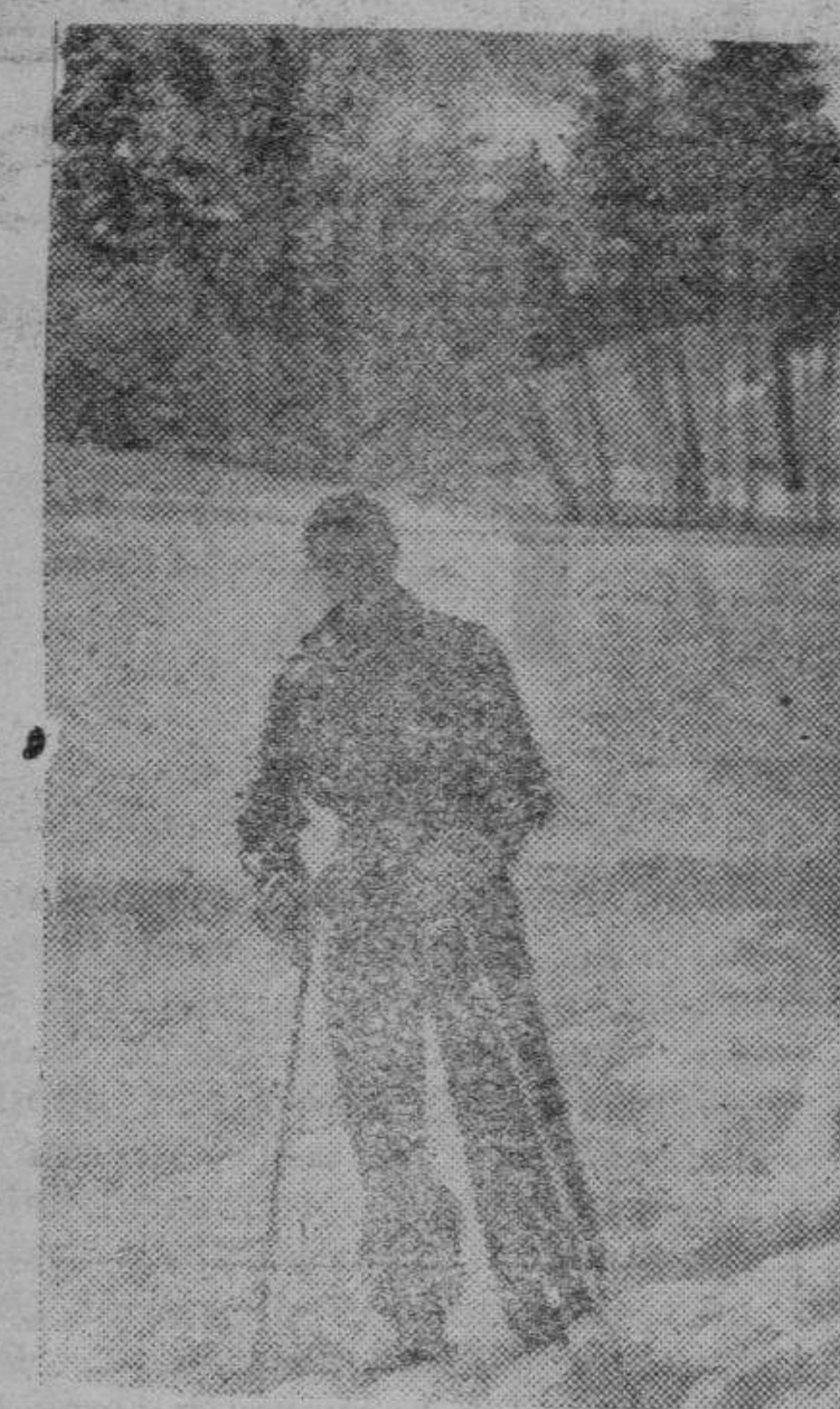
EDUARDO VIII DE INGLATERRA