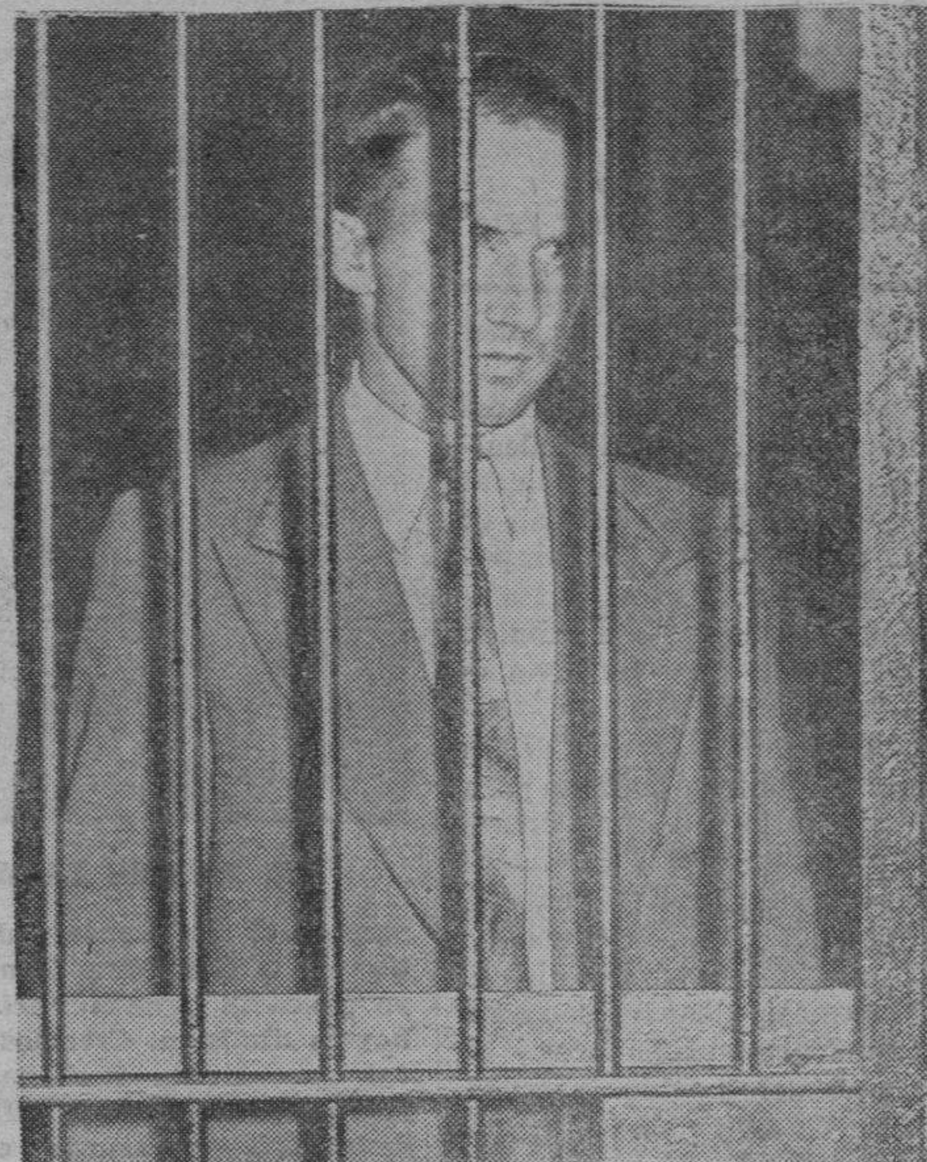
BRUNO RICHARD HAUPTMANN