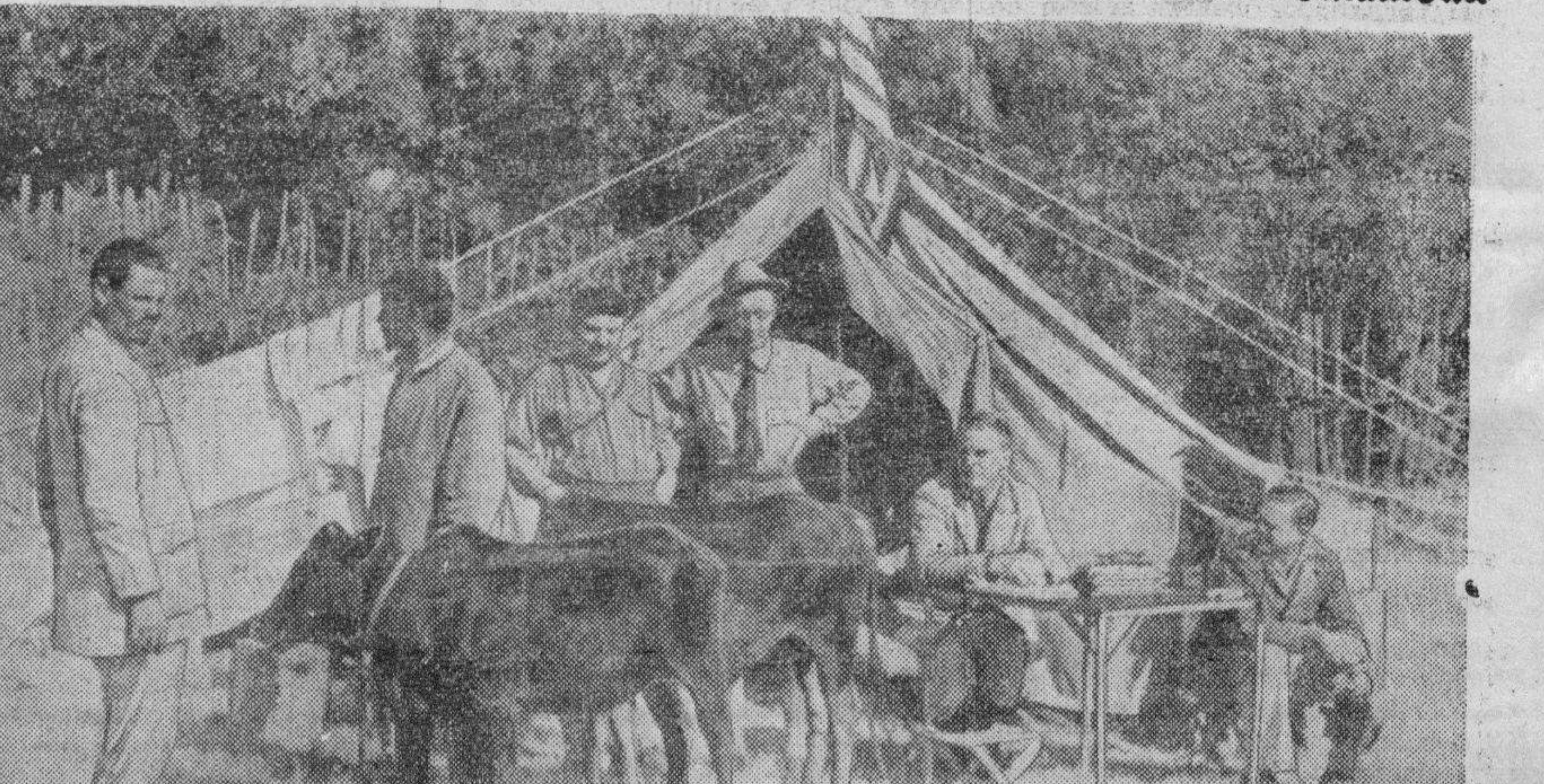
Campamento de correspondientes de guerra en la retaguardia del frente abisinio nel Norte, donde redactan los enviados especiales los telegramas y crónicas de la guerra.