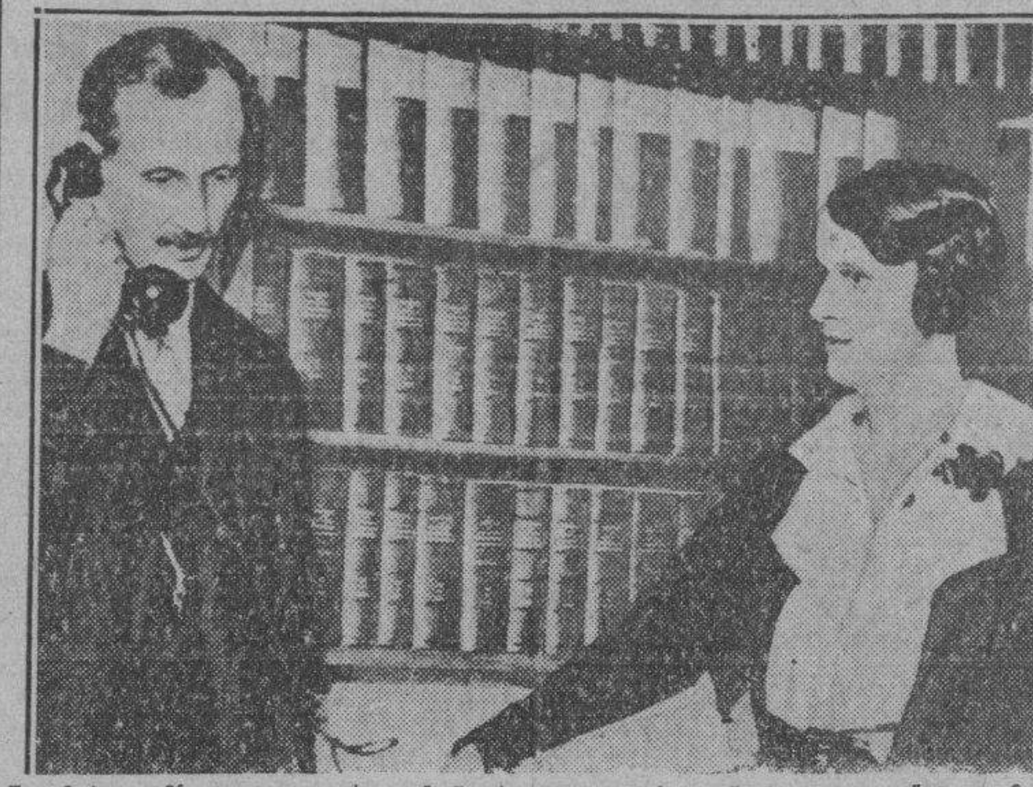
La fotografía nos muestra al doctor Jean Piccard, hermano del profesor Augusto Piccard, y a su esposa, que acaban de realizar un feliz viaje a la estratosfera, emulando la hazaña de éste

Estuvieron diez millas distantes de la superficie de la tierra, con resultado satisfactorio en su investigación. La barquilla no sufrió daños en el singular aterrizaje