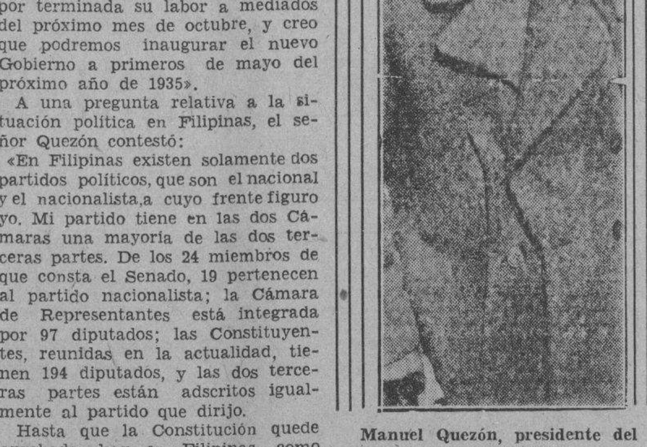
Manuel Quezón, presidente del senado filipino