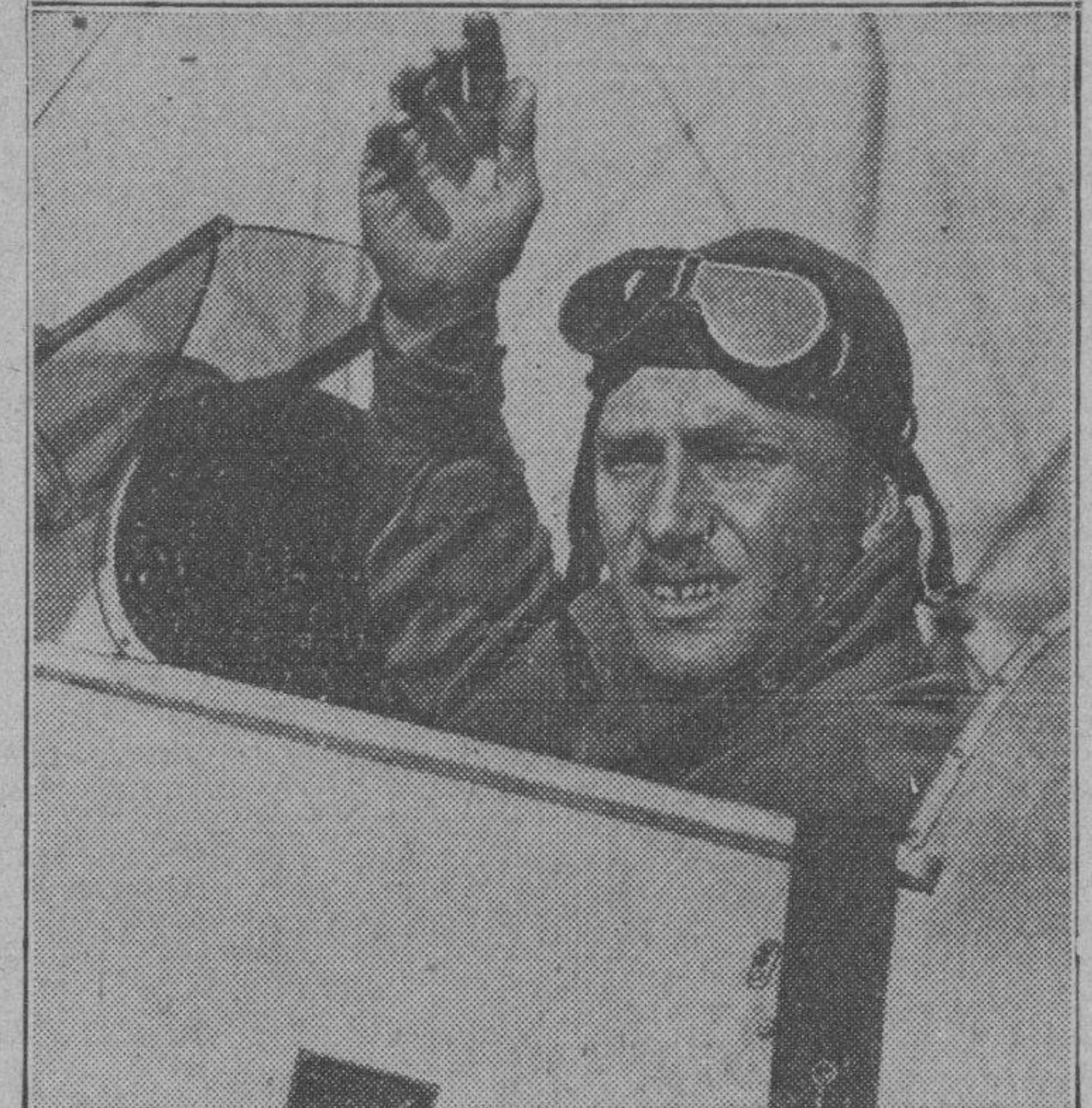
Saludando al pueblo londinense que lo aclama calurosamente, aparece el aviador inglés C. W. A. Scott, a bordo de su nave, y quien, con su copiloto Campbell Black conquistó la palma de la victoria en el portentoso vuelo por sobre tres continentes de Londres a Melbourne...