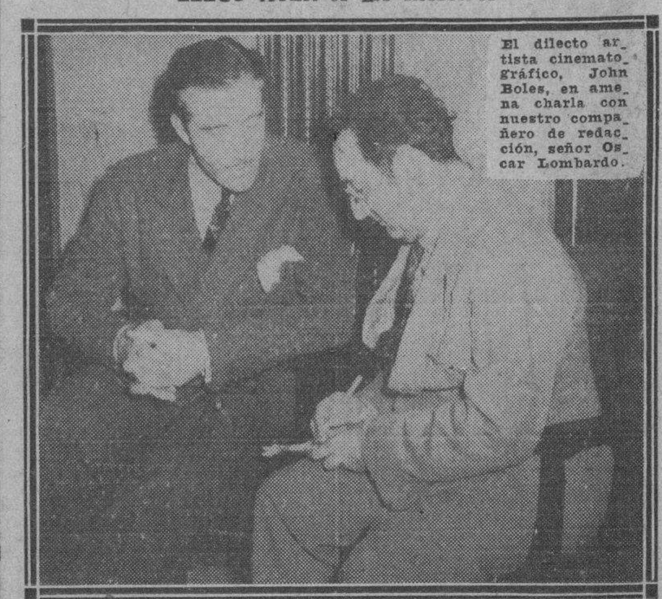
(VEA LA ENTREVISTA CON JOHN BOLES EN LA PAGINA TERCERA)

EL GRAN ACTOR DE LA PANTALLA, JOHN BOLES, LLEGO AYER A LA HABANA