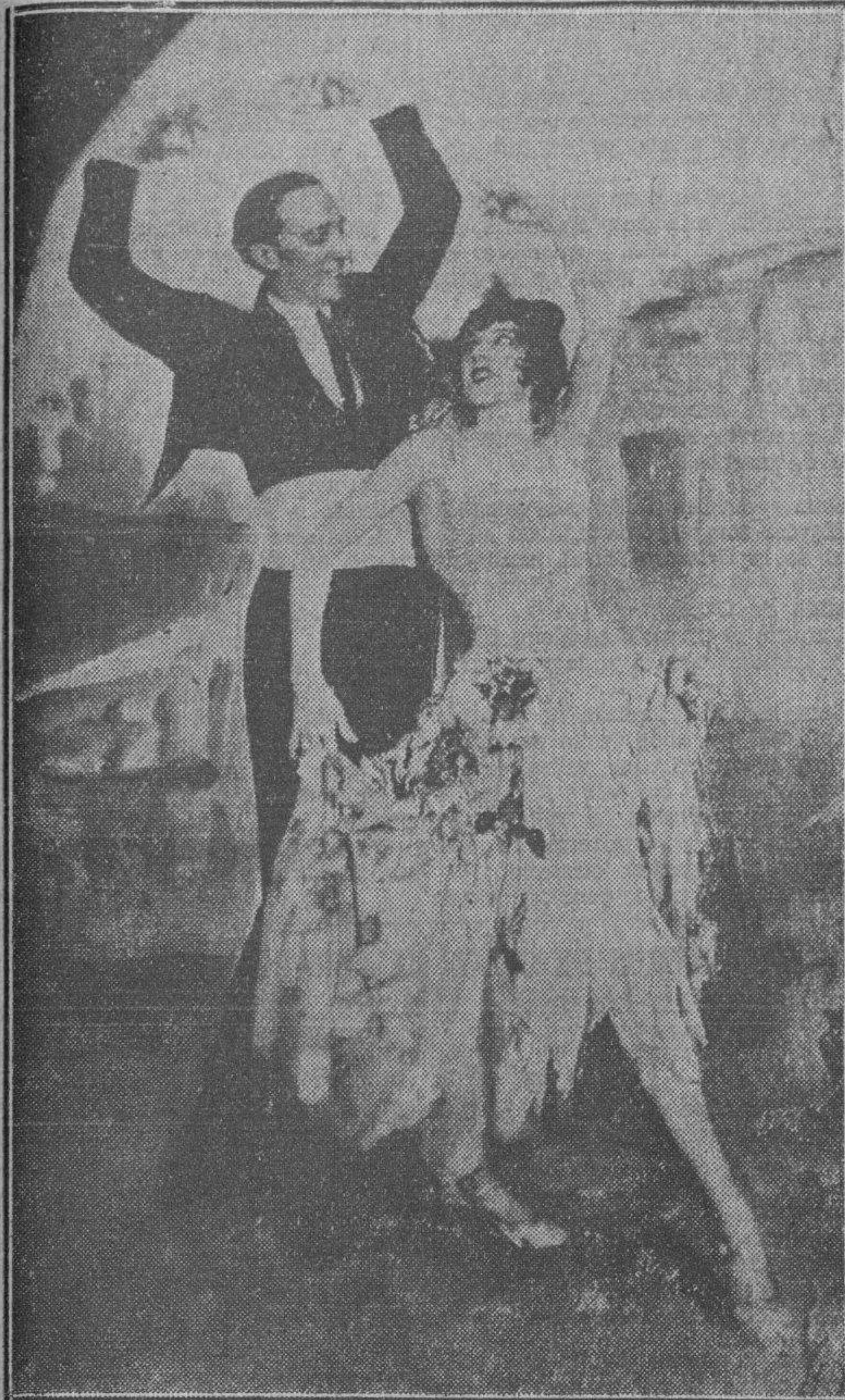
FOWLER AND TAMARA

En Campoamor. Los famosos artistas. En las tandas elegantes de las 5 y media y 9 y media, reaparecerá esta famosa pareja de bailes internacionales que ha actuado en el Gran Casino Nacional por espacio de tres meses. Gustan mucho. Por sus bailes tan elegantes. Han actuado en los principales teatros y Clubs de Europa y de los Estados Unidos e Inglaterra. En París tuvieron un gran éxito en el Folies Bergère, Casino y Montmartre, en Londres actuaron en el