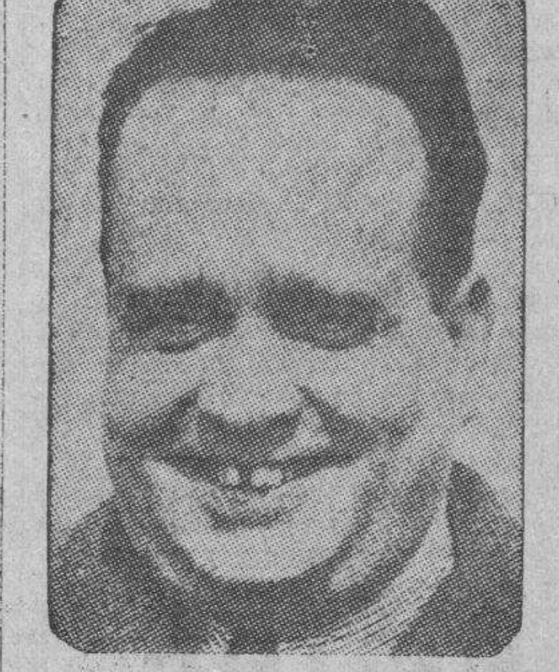
El inventor La Cierva