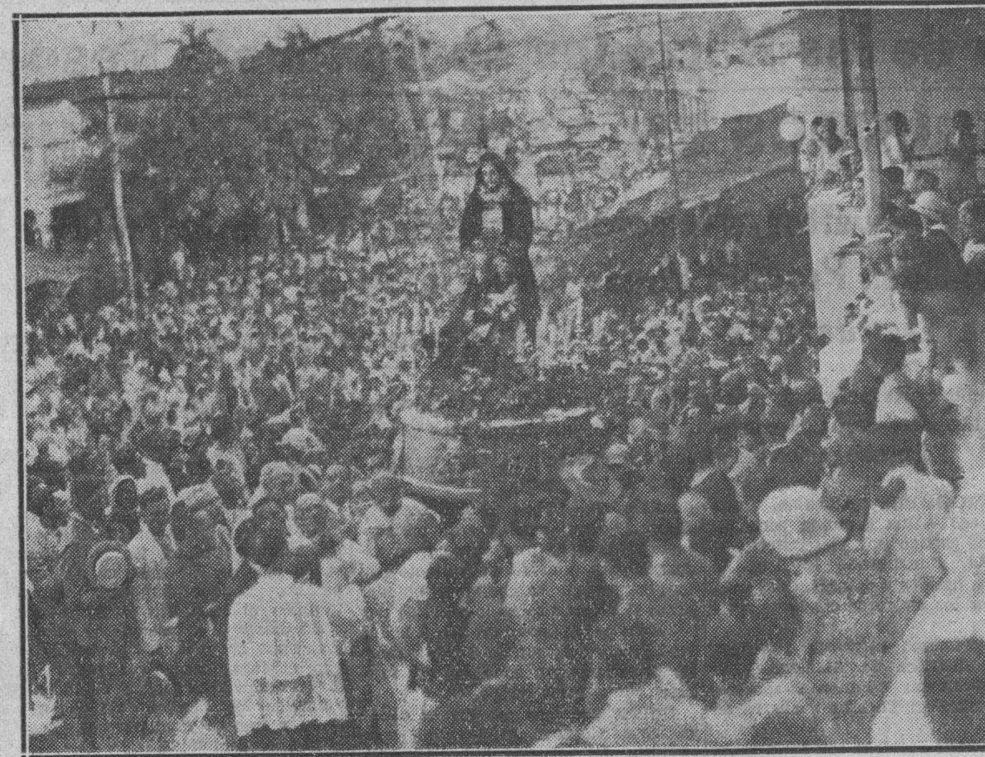
En horas de la tarde de ayer, a las cuatro y media, fiesta religiosa en honor de la venerada imagen de Jesús Nazareno. He aquí los momentos en que ésta era trasladada de la parroquia del Cano a la milles de devotos que, año tras año, en peregrinación reafirman su fe. (Véase ampliamente la página 8).