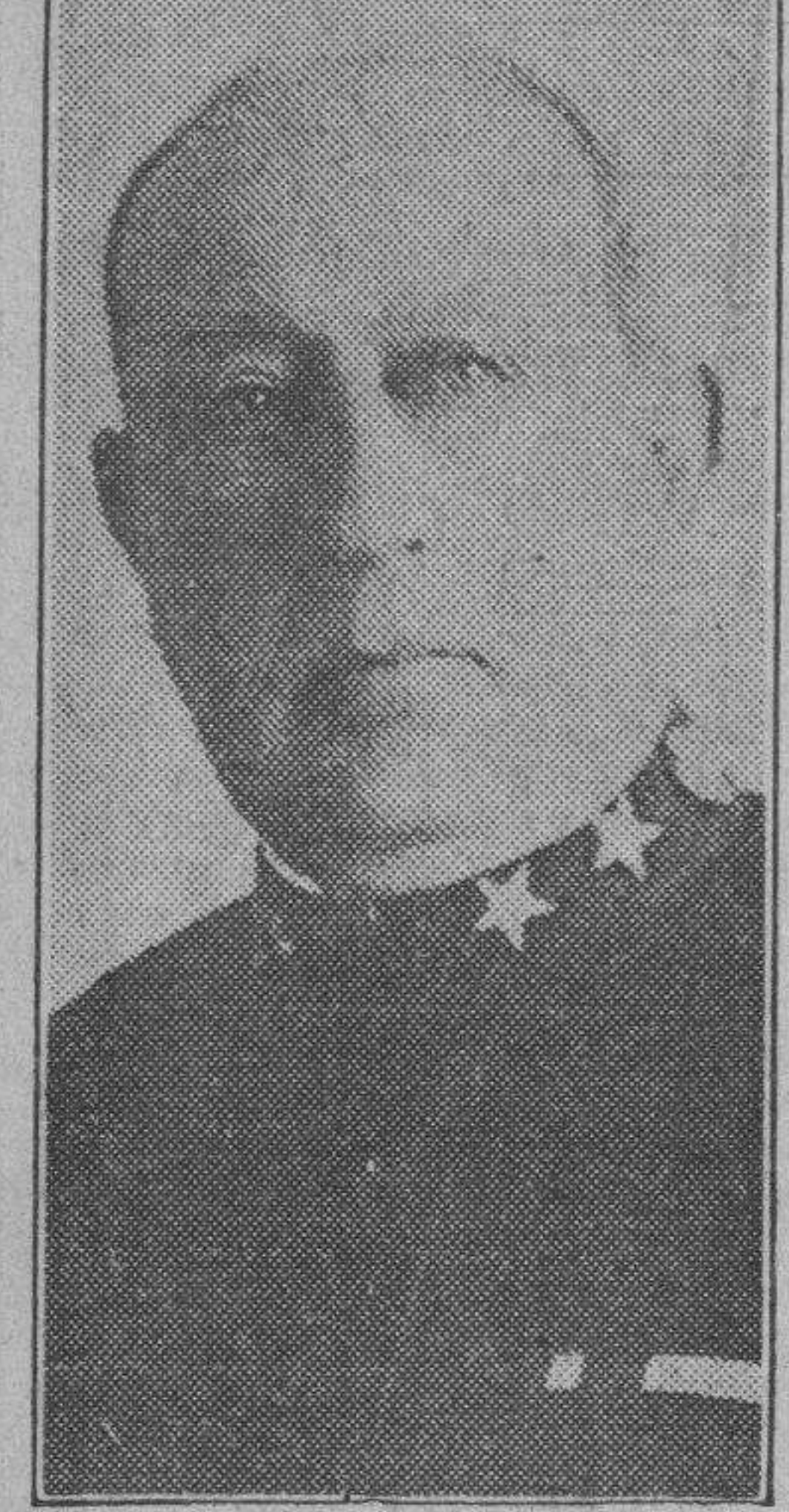
Alm. Hughes Rodman

Así lo asegura el ex Jefe de la Armada de Estados Unidos en la Guerra Mundial, Alm. Rodman