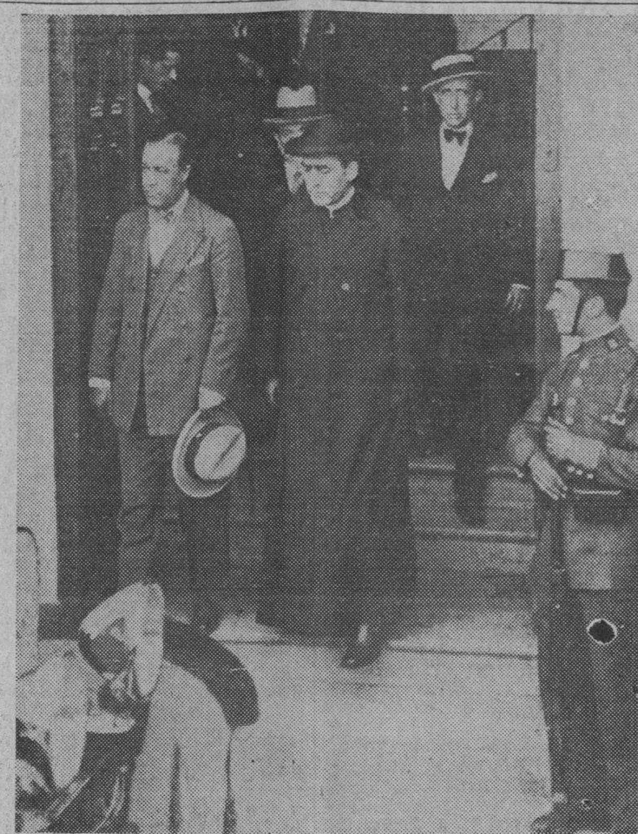
El Cardenal Segura, Primado de España, al salir del convento de los Paules, en Guadalajara, para ser conducido por la policía de seguridad hasta la frontera de Francia, cumpliendo las órdenes de deportación decretadas por el Gobierno republicano del Presidente Alcalá Zamora. Cuando se hizo esta foto, el público daba muestras y gritos contra el Cardenal, que éste contestó dando su bendición a lamuchedumbre.

Después habló el Presidente sobre la necesidad de llevar a cabo una intensa propaganda, y que esta debe ser hecha por cuantos tienen en la institución sus intereses, en defensa de los mismos.