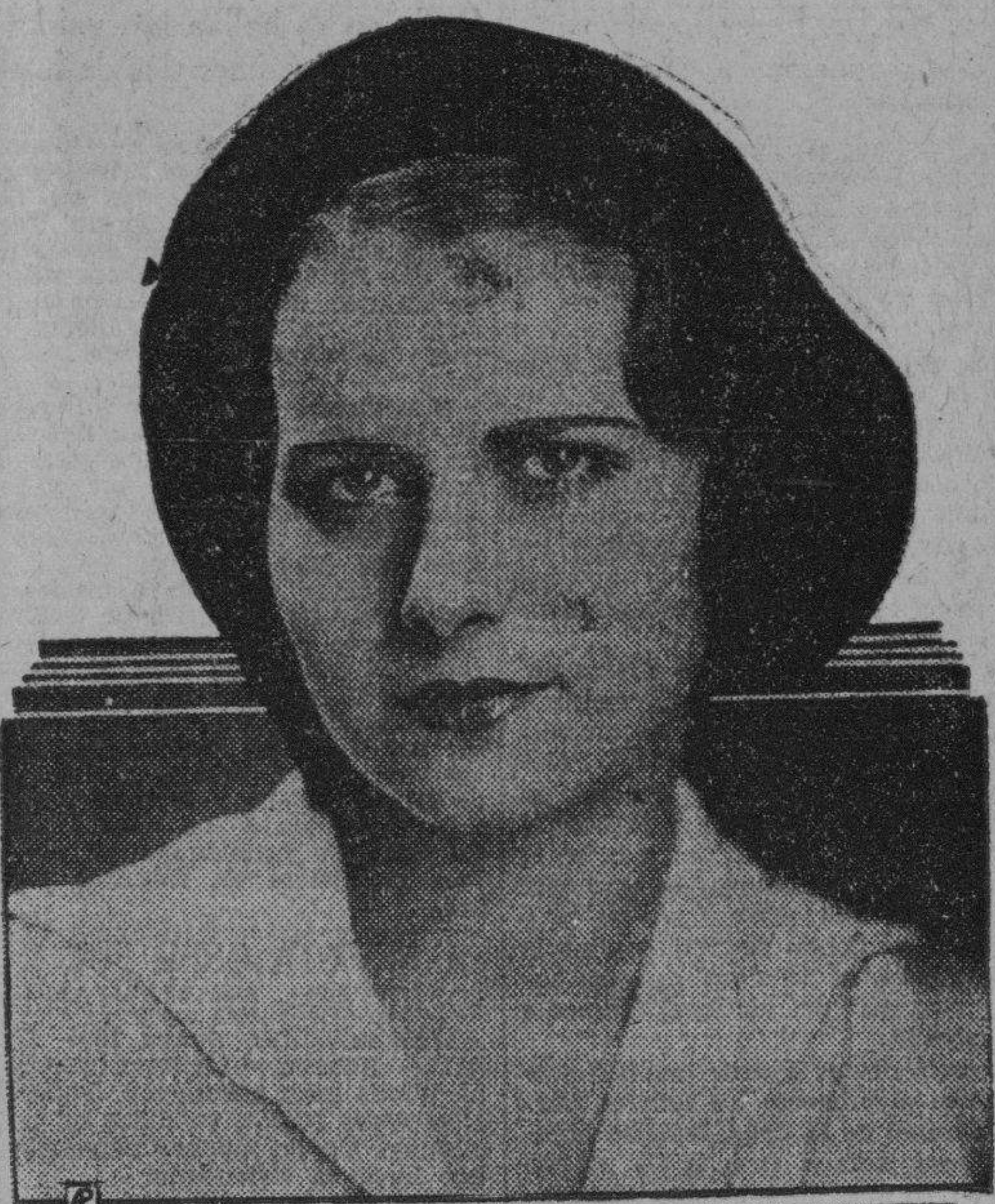
La boina puede llevarse con cualquier traje. Es de terciopelo transparente

Secretos de una Parisiense — Conocéte a ti misma