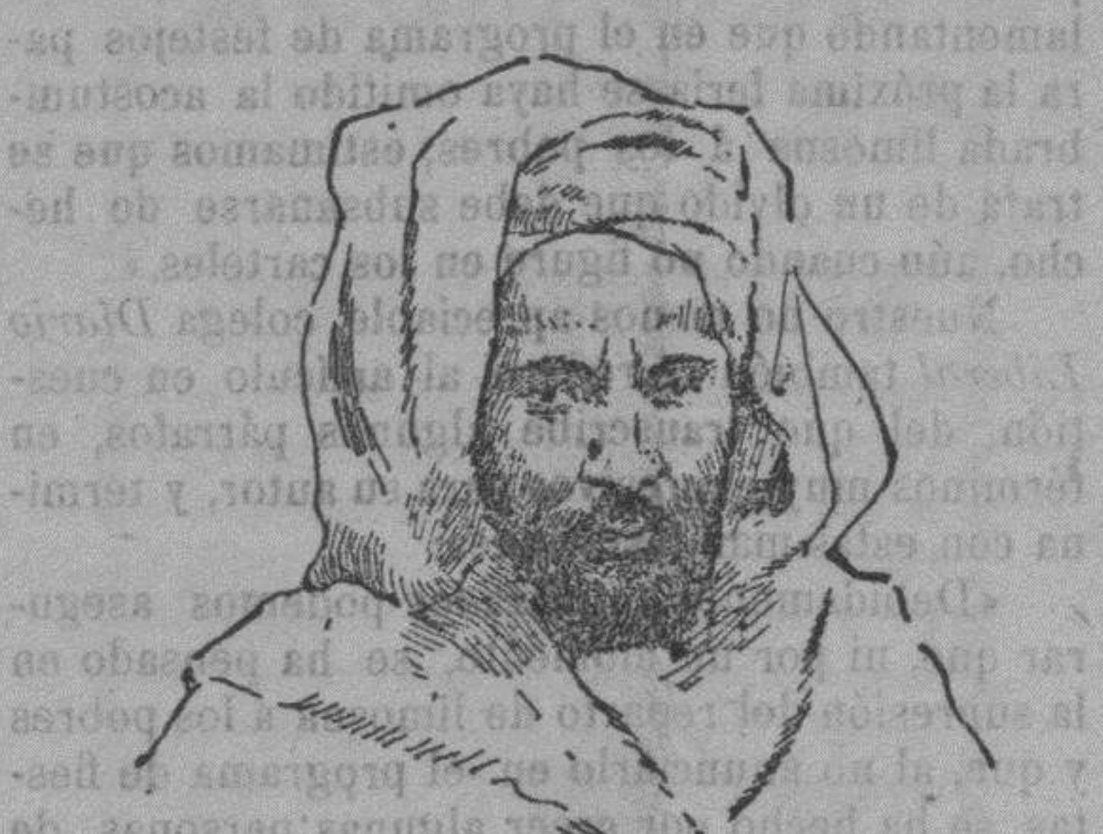
Muley Hafid que, vencido por las fuerzas rebeldes, ha tenido que refugiarse en el Consulado de Francia.