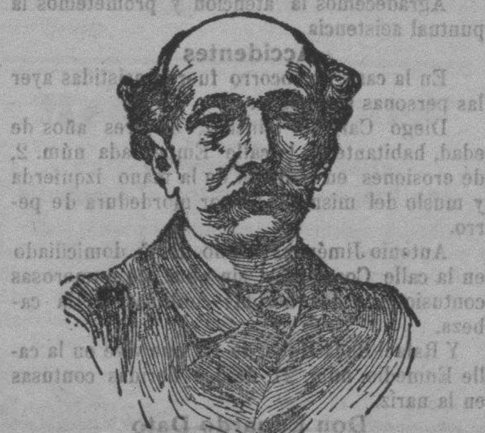
El expresidente del Congreso don Eduardo Dato, que ha visitado nuestra ciudad, de la cual marchó ayer tarde.