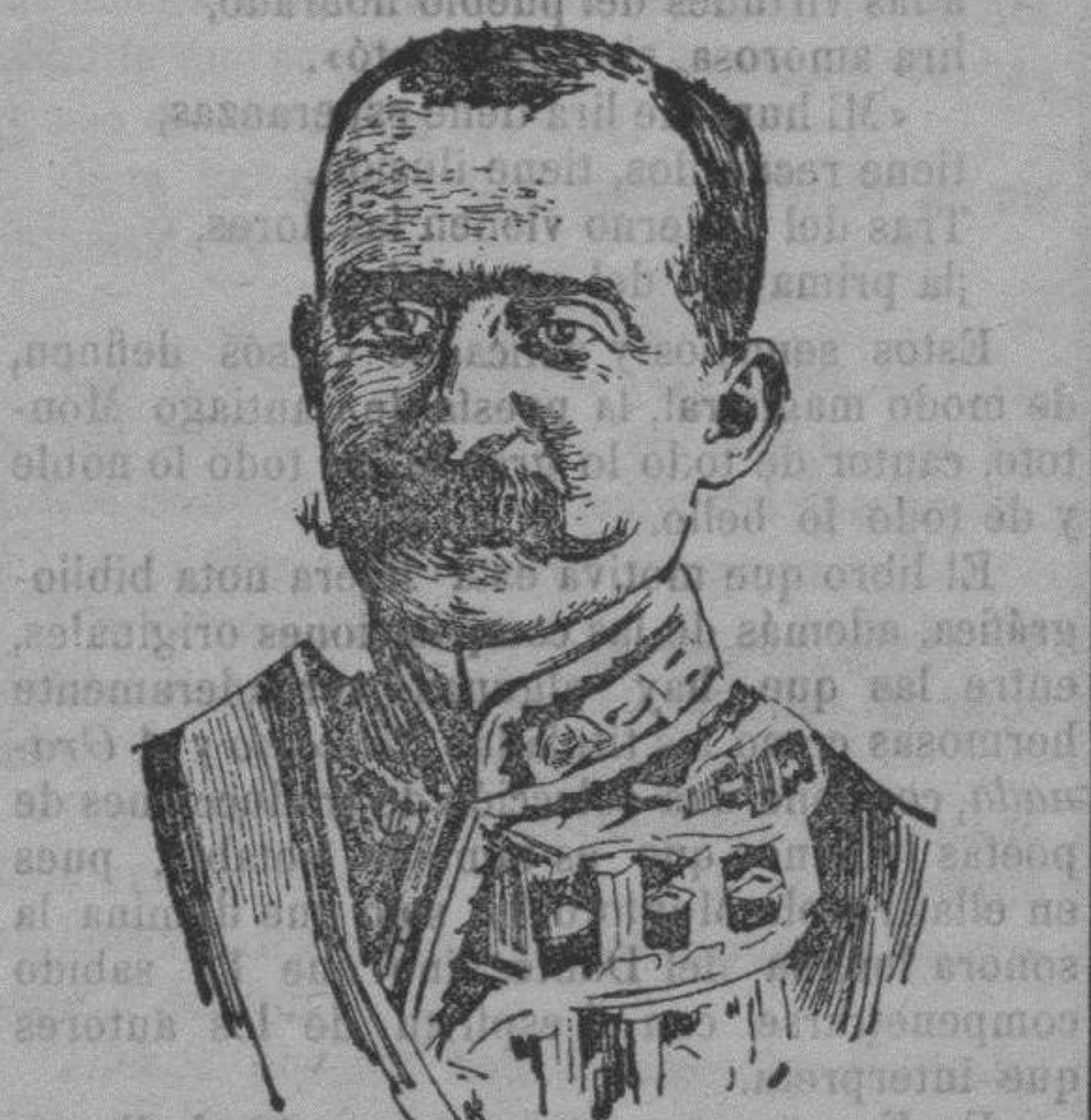
El presidente del Congreso Sr. Conde de Romanos, á quien se espera hoy en Córdoba.

Y, por último, lamentar el que los acogidos en la Casa Socorro-Hospicio no hayan podido asistir á la ceremonia religiosa del Santo Entierro á causa del estado precario de la Caja provincial y no haber podido el Presidente Ordenador de pagos atender á las peticiones hechas con tal motivo.