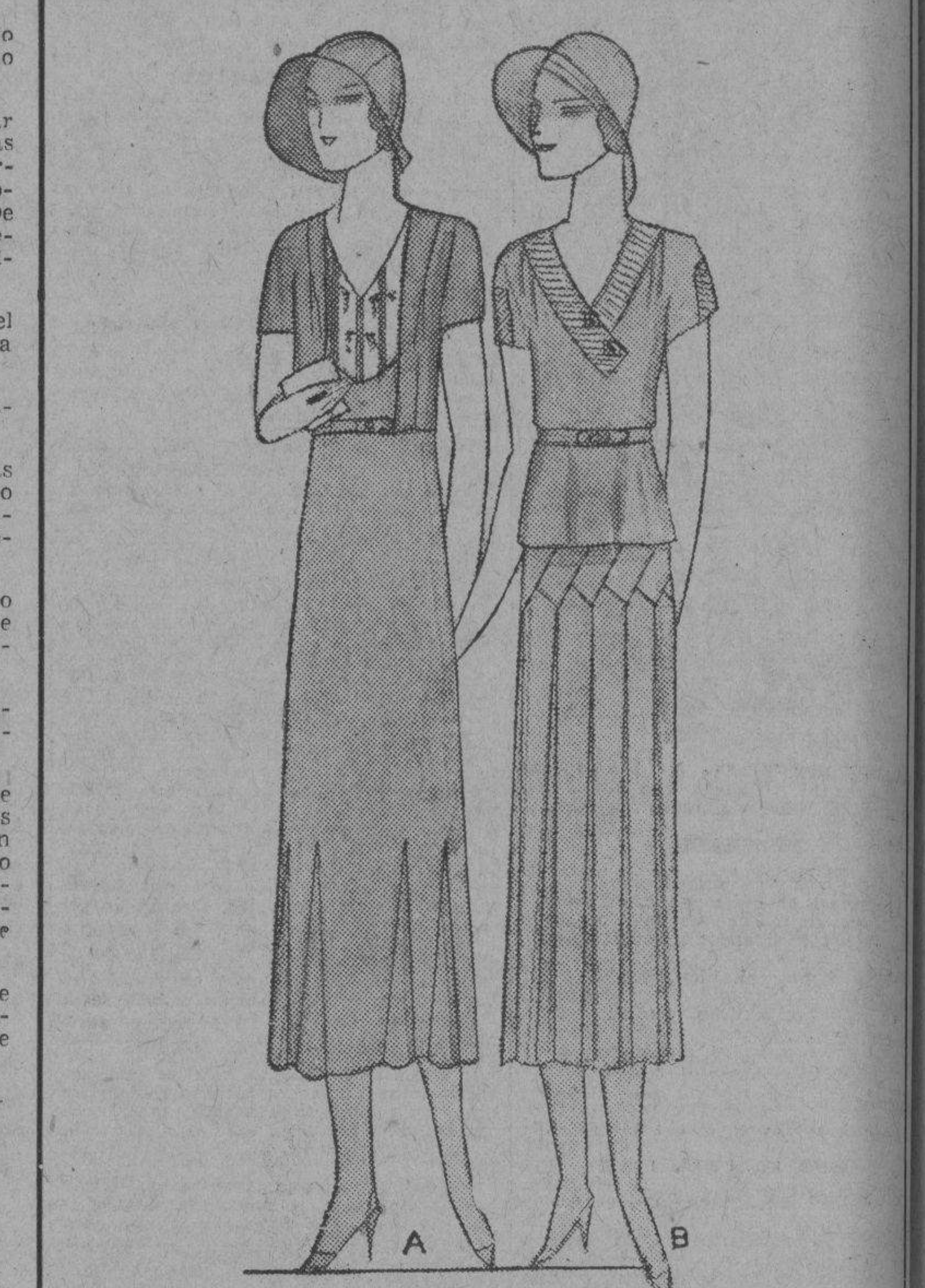
A—Traje de batista de lino... B—Traje de shantung muy fino...

6.00 12.50 Interpretados en batista de fino hilo, shantung, crepé de China color entero o crepé imprimé. Estilos y telas de rigurosa actualidad. Los modelos que ilustramos dan solamente una ligera idea de las ventajas que se obtienen visitando nuestro Departamento de confecciones. Al buen gusto que caracteriza los vestidos de EL ENCANTO, un sello inconfundible de actualidad y elegancia hay que agregar el doble interés de la confección y del precio reducido a que los ofrecemos.