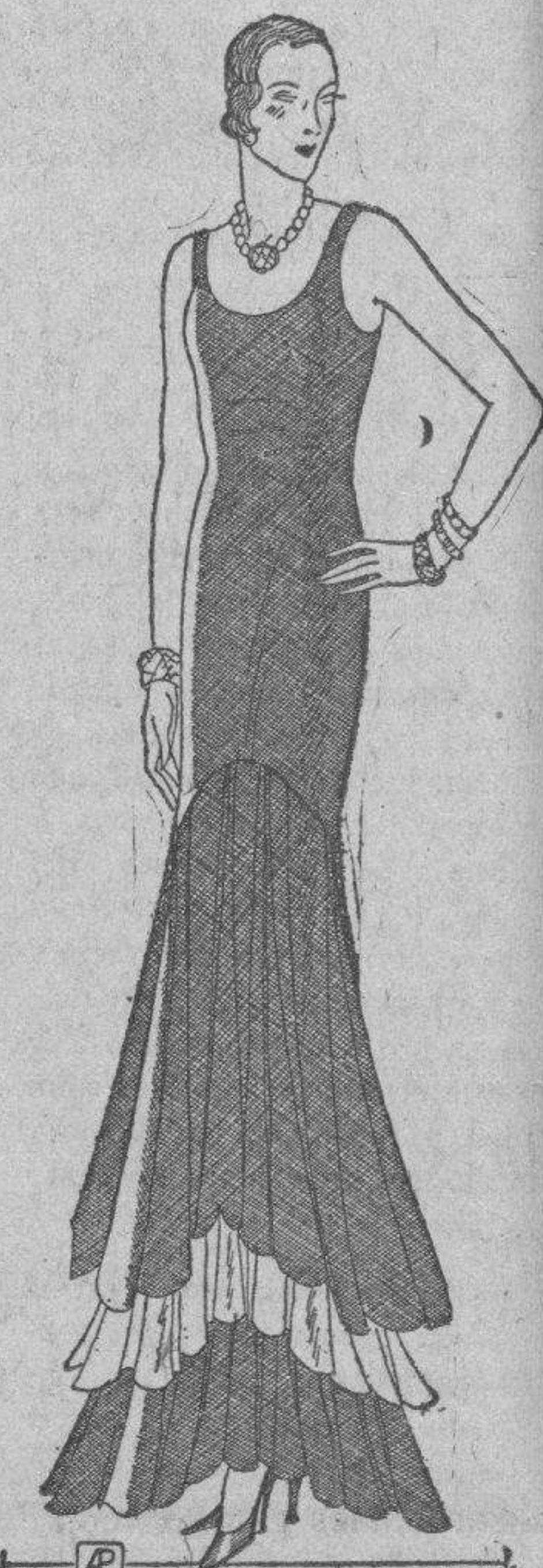
Diseño de Worth. Una super post-dión blanca. Sobre chiffón negro, con corpiño Moya-Ags.

En el Hotel "Alamac" se celebra esta noche una comida para festejar el arribo de los farmacéuticos cubanos, que en la mañana de hoy regresan de Niágara Falls, habiéndose decorado el Blue Room con profusión de palmeras y banderas de Cuba. A esta comida se hallan invitadas significadas personalidades de la colonia cubana en Nueva York, que habrán de dar un mayor realce a la fiesta. Después de la comida se bailará en el Congo Roof del "Alamac" a los sones de una orquesta típica cubana. El sábado próximo saldrán los farmacéuticos de regreso a Cuba, llevándose un recuerdo gratísimo de los días pasados en Nueva York y quedando animados para favorecer la futura organización de estas excursiones que sirven a la vez que de placer, de estímulo y de estudio. Elena de la TORRE.