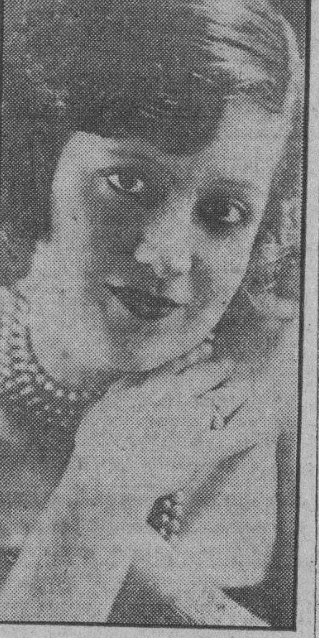
Una comedia deliciosa. Llena de chistes. Es la que con el título de Los Chicos, del vasto repertorio de Muñoz Seca, fué puesta anoche en escena por los artistas del Principal.