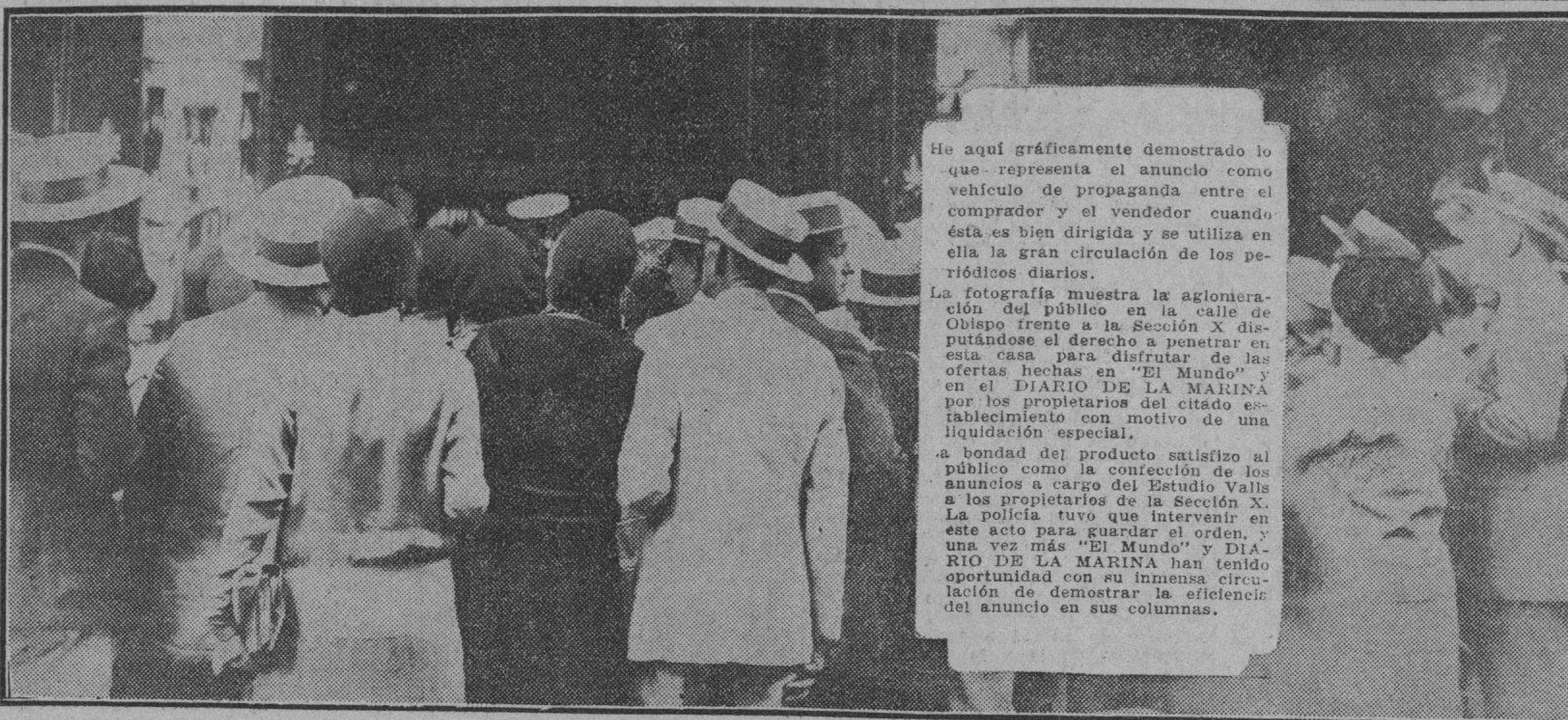
La policía tuvo que regular el tráfico frente a la SECCION X en su venta especial. (Fotografía tomada al abrirse la tienda.)