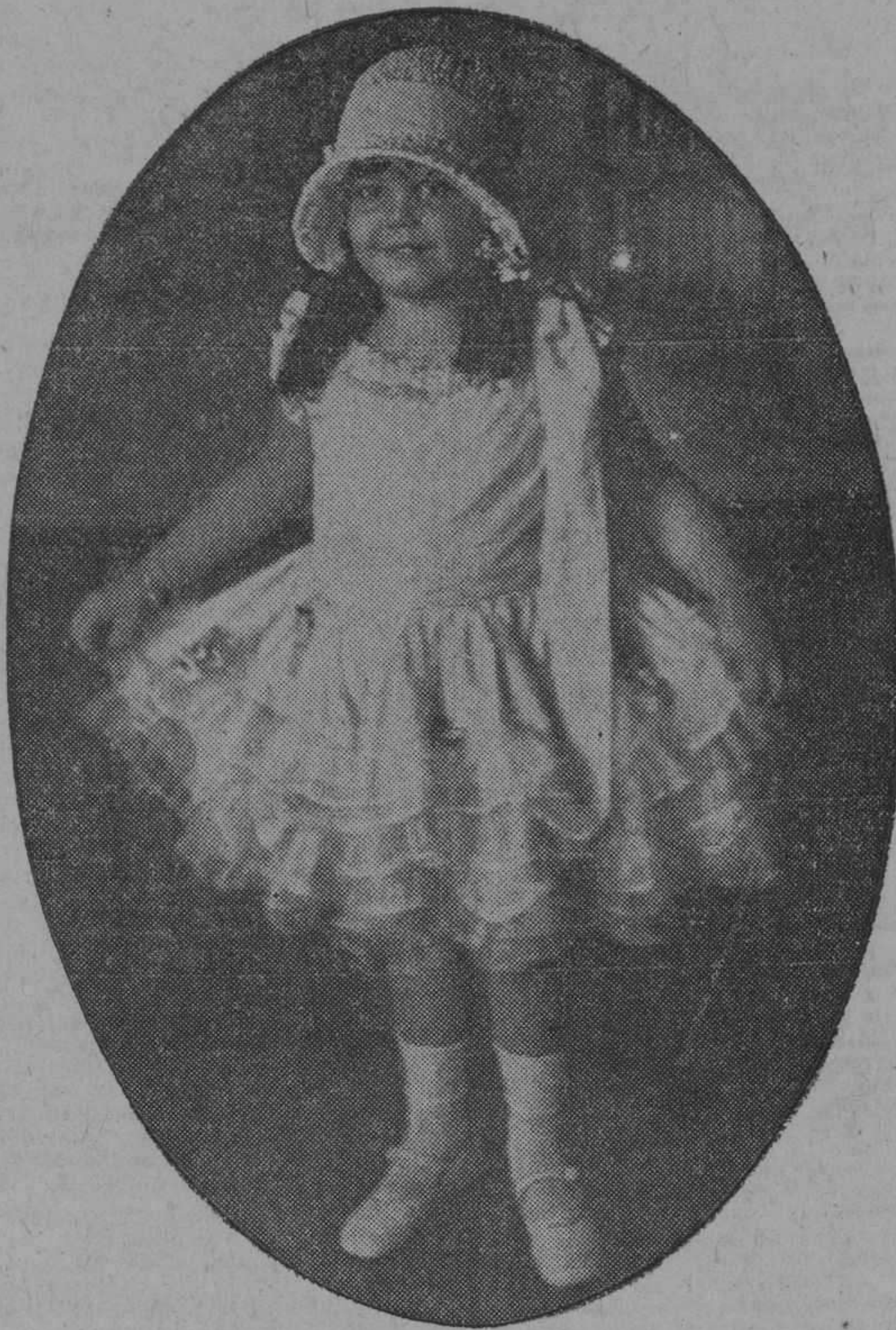
GRAN FIESTA INFANTIL