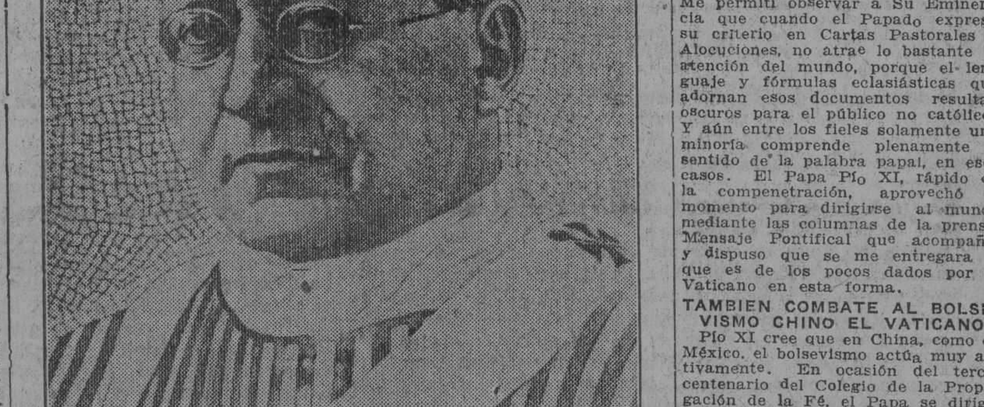
El día de 1922 en que el cardenal Aquiles Ratti fué elegido Papa era uno de los muchos milares de católicos que estaban en la plaza...

Si toda la Prensa de América puede encontrar un remedio oportuno para esta desastrosa catástrofe social, habrá merecido gloria inmarcescible en la historia de la Civilización y de la Religión.