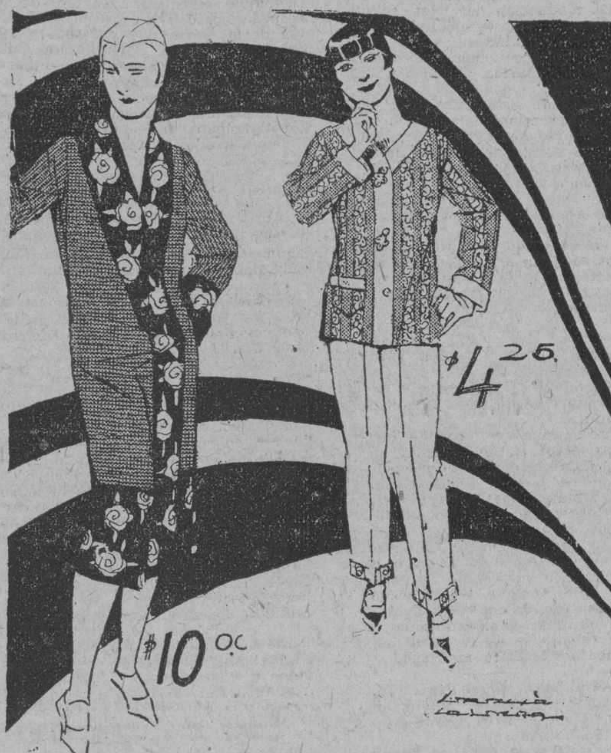
$4.25.—Pijama de franela de lana, con obra matizada en fondo de color. Lleva presillas de seda. $10.00.—Kimono de corduroy y de dos tonos, uno entero y otro floreado. Muy fina combinación.

$2.90.—Pijamas de franela de lana en color entero: casaca y pantalón.