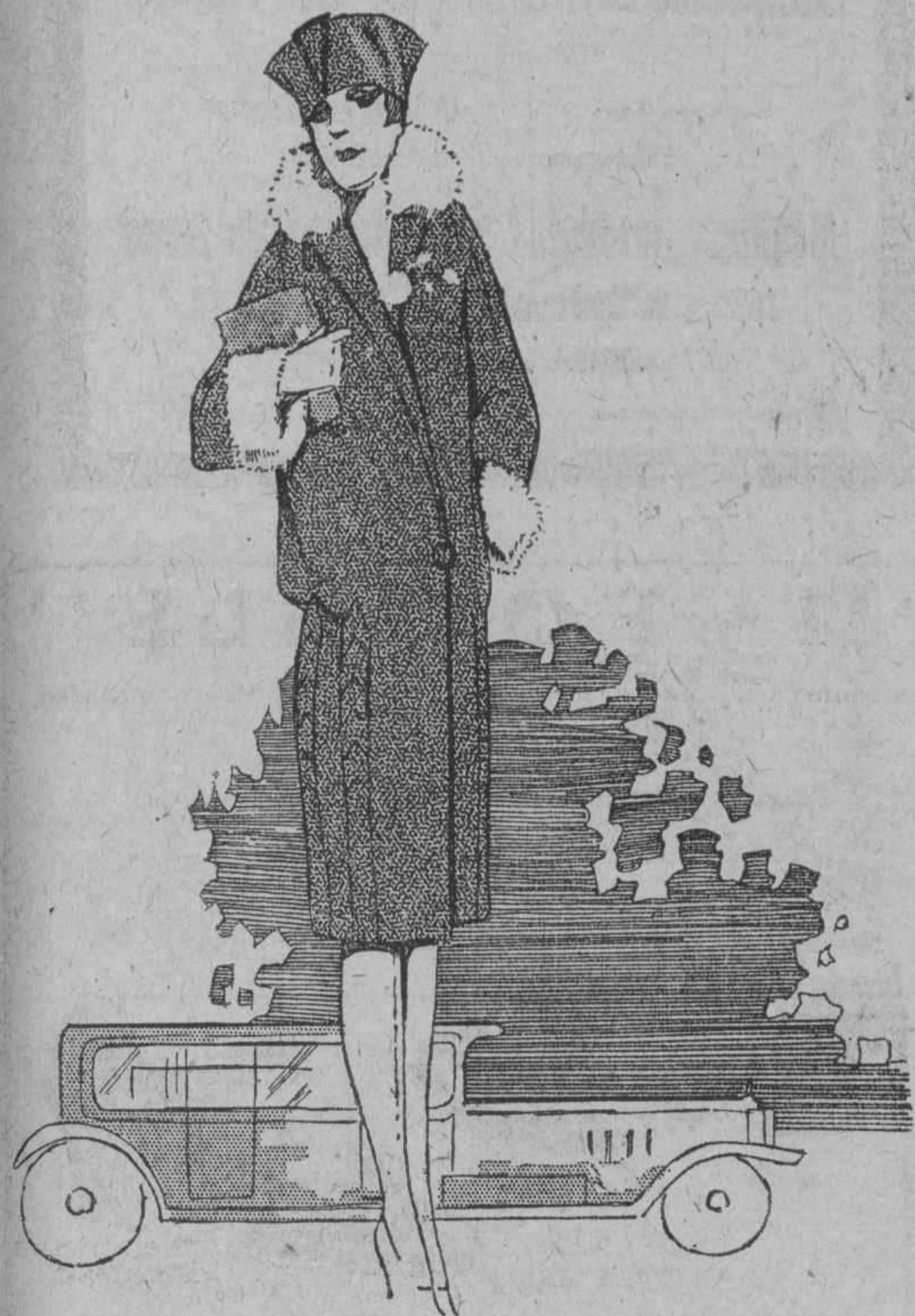
MODELO DE ABRIGO de Seda negra. Fondo mate, combinado con brillo. Forro de seda color "Fuschia". Cuello y puños de piel gris. $42.

Tan atractivos y elegantes como este modelo, tenemos muchísimos.