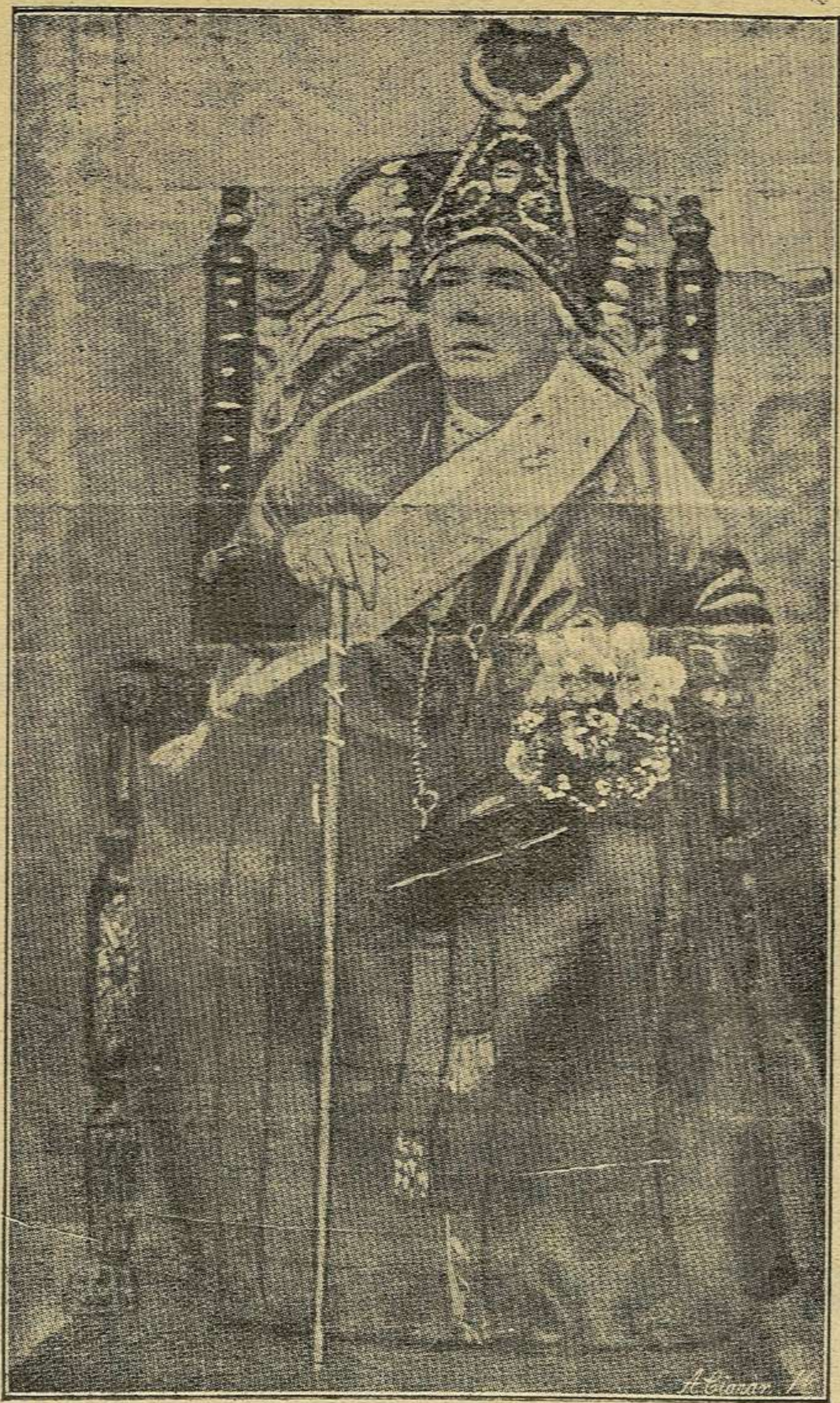
La Infanta doña Isabel de Borbón vistiendo el traje de alcaldesa honoraria de Segovia, madrina del Somaten