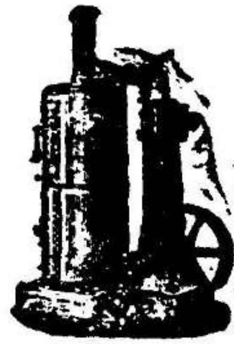
Máquina de vapor vertical.