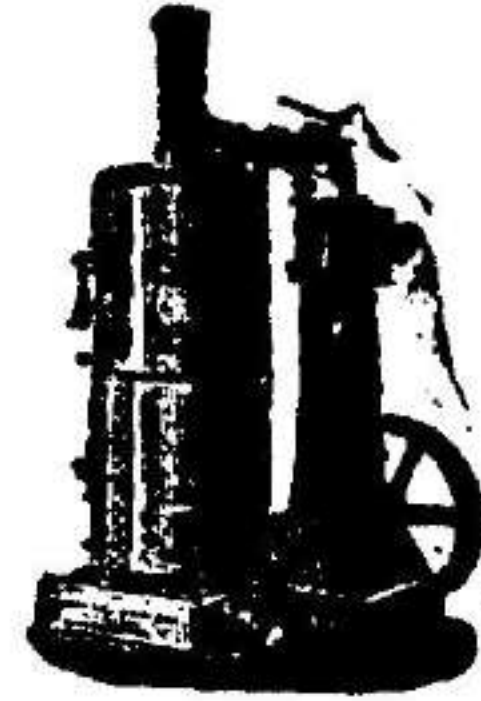
Máquina de vapor vertical.