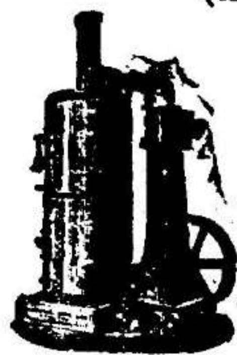
Máquina de vapor vertical.