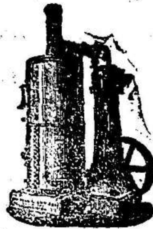
Máquina de vapor vertical.