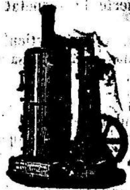
Máquina de vapor vertical.

Máquinas de vapor, Bombas, Prensas, Tubos de todas clases.