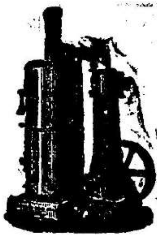
Máquina de vapor vertical.

Esquelas de funeral y tarjetas de visita en el acto PLAZA DE ALFONSO XII, 14.—PLAZA MAYOR, 28