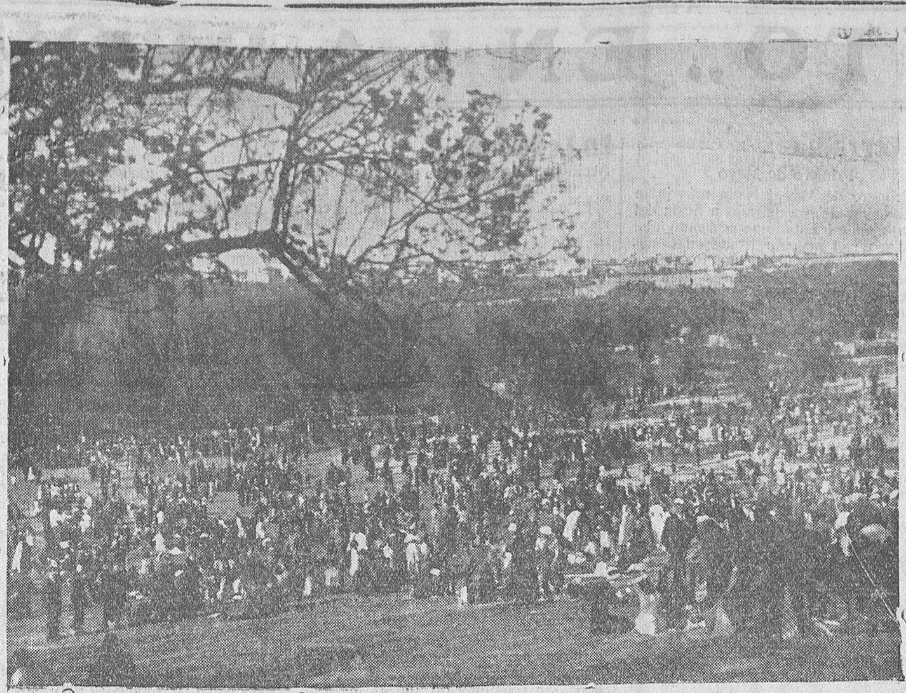
La Casa de Campo, de Madrid, durante la celebración de la Fiesta del Trabajo