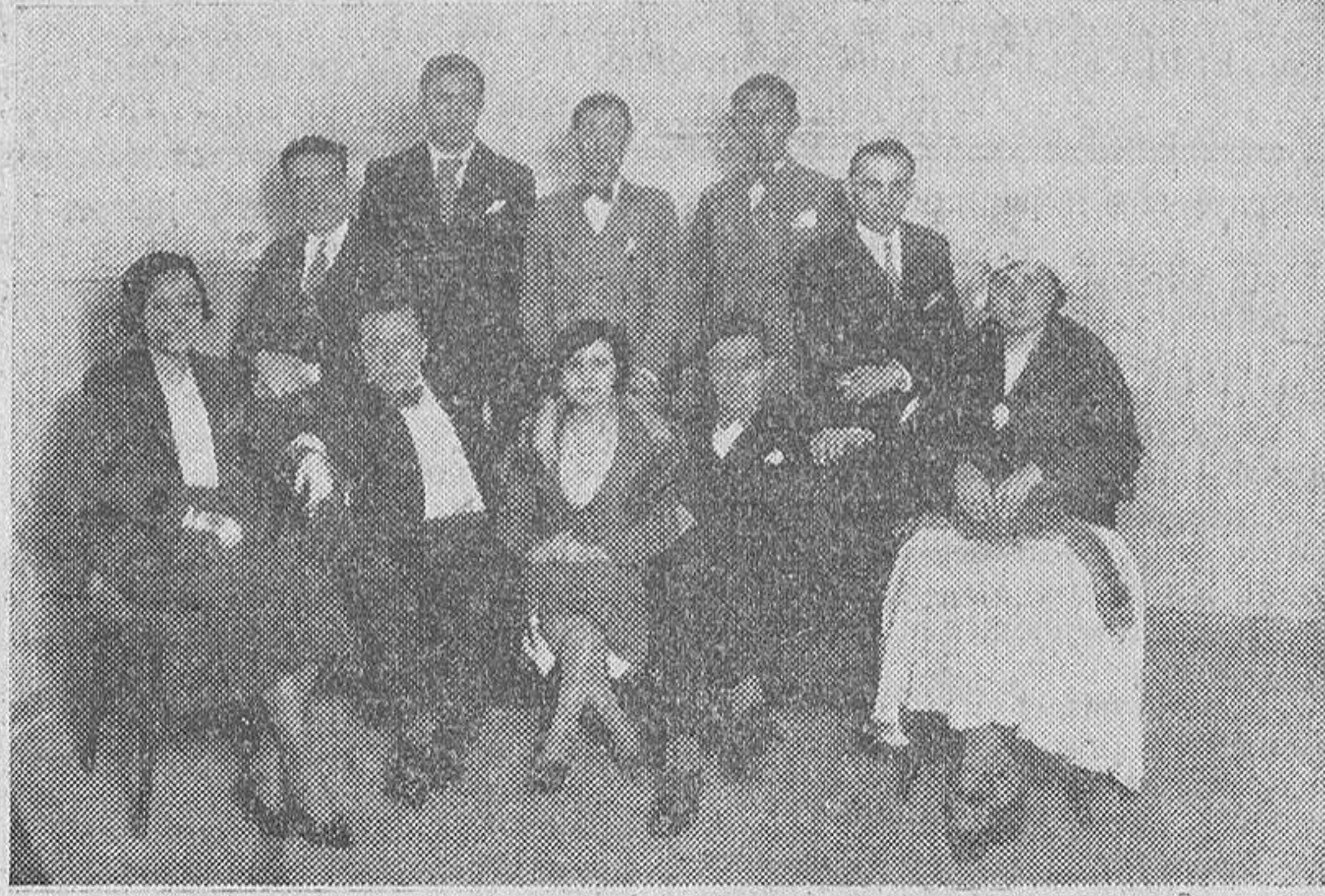
La junta directiva de "Juventud Charra" se agrupa galantemente alrededor de la bellísima "Miss Madrid", que aparece en la foto entre el presidente y el vicepresidente de "Juventud".