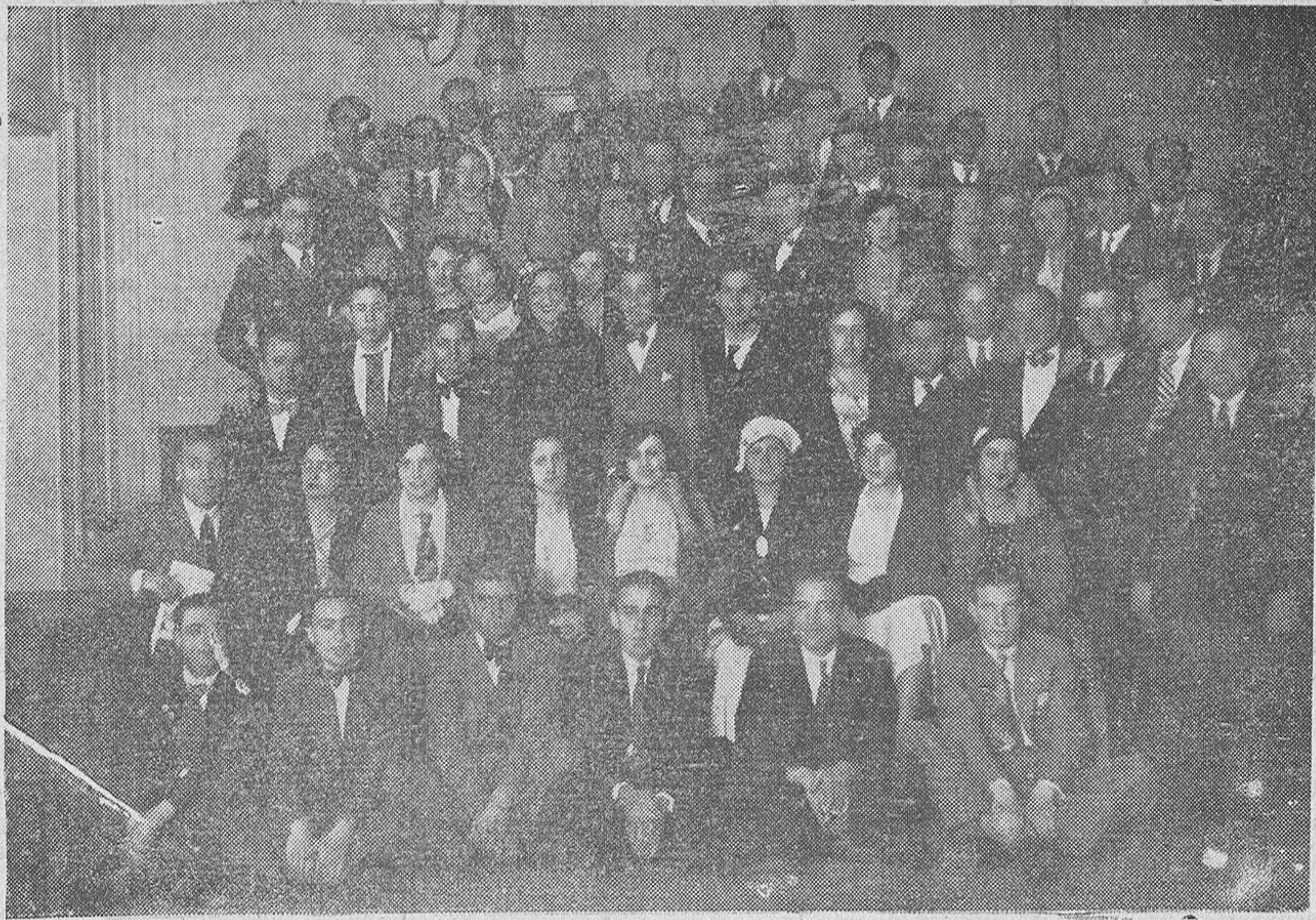
Grupo de concurrentes a la Asamblea de "Juventud Charra", de Madrid