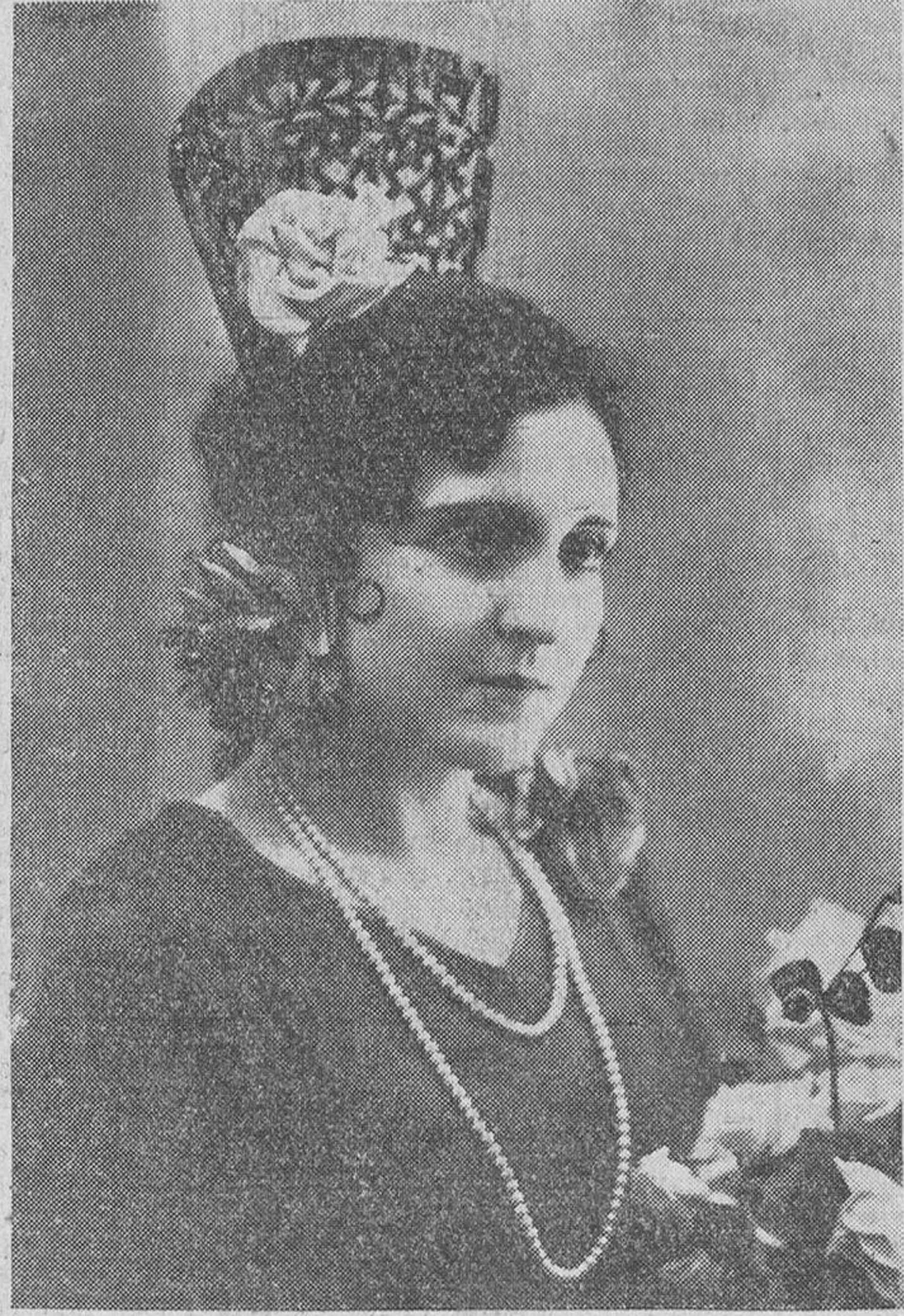
Autógrafo para EL ADELANTO, de "Miss Madrid,"