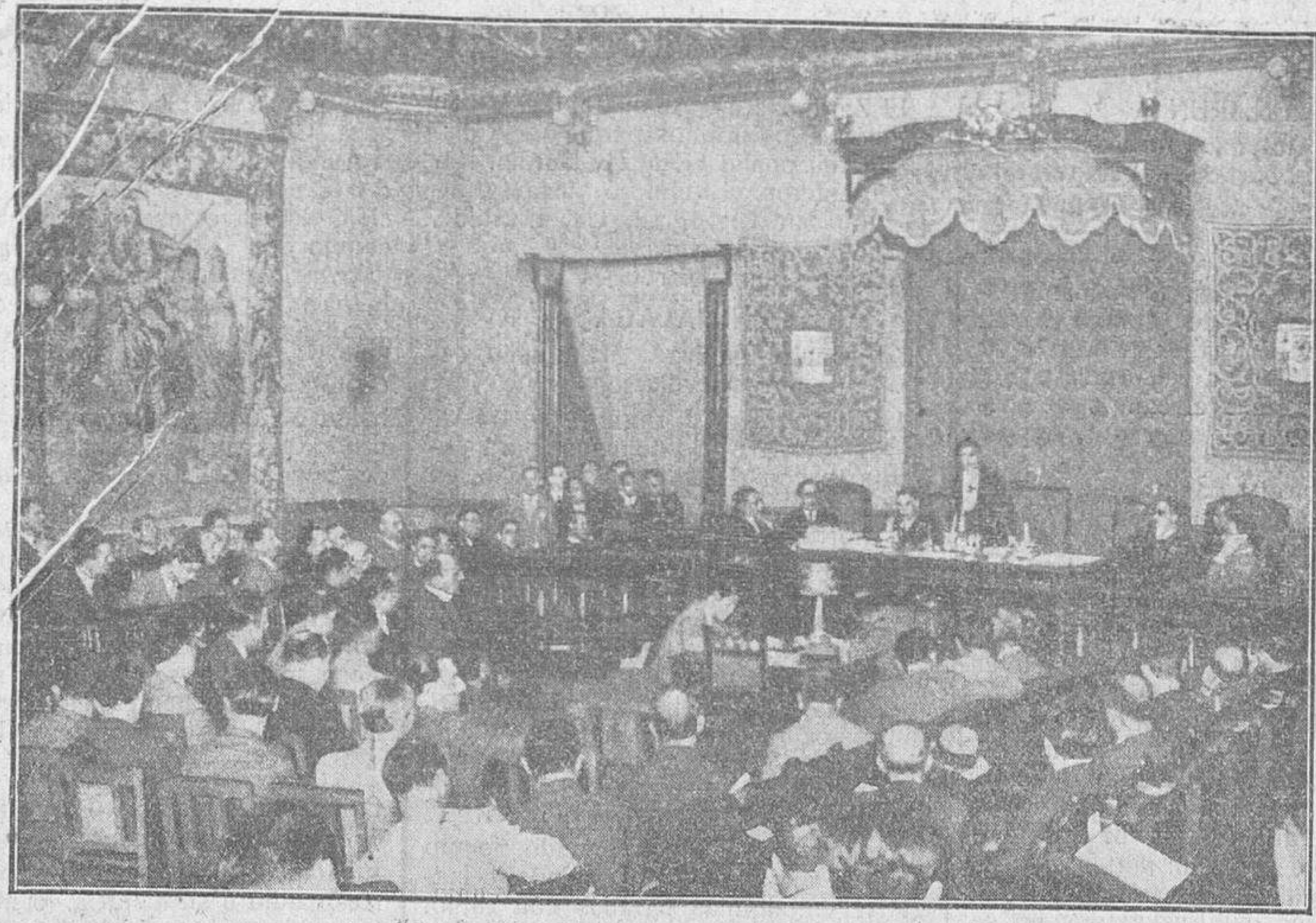
Sesión inaugural del Congreso Penitenciario, celebrado bajo la presidencia de la señorita doña Victoria Kent, directora de Prisiones, en el salón de actos de la Diputación de Madrid