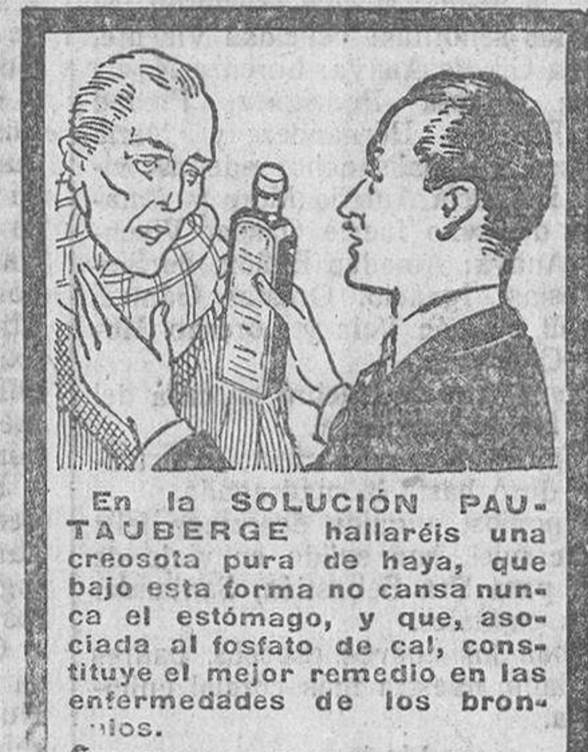
L. Pautauger, París y todas farmacias

Quedan excluidos del régimen legal. Primero. El de los directores, ge-