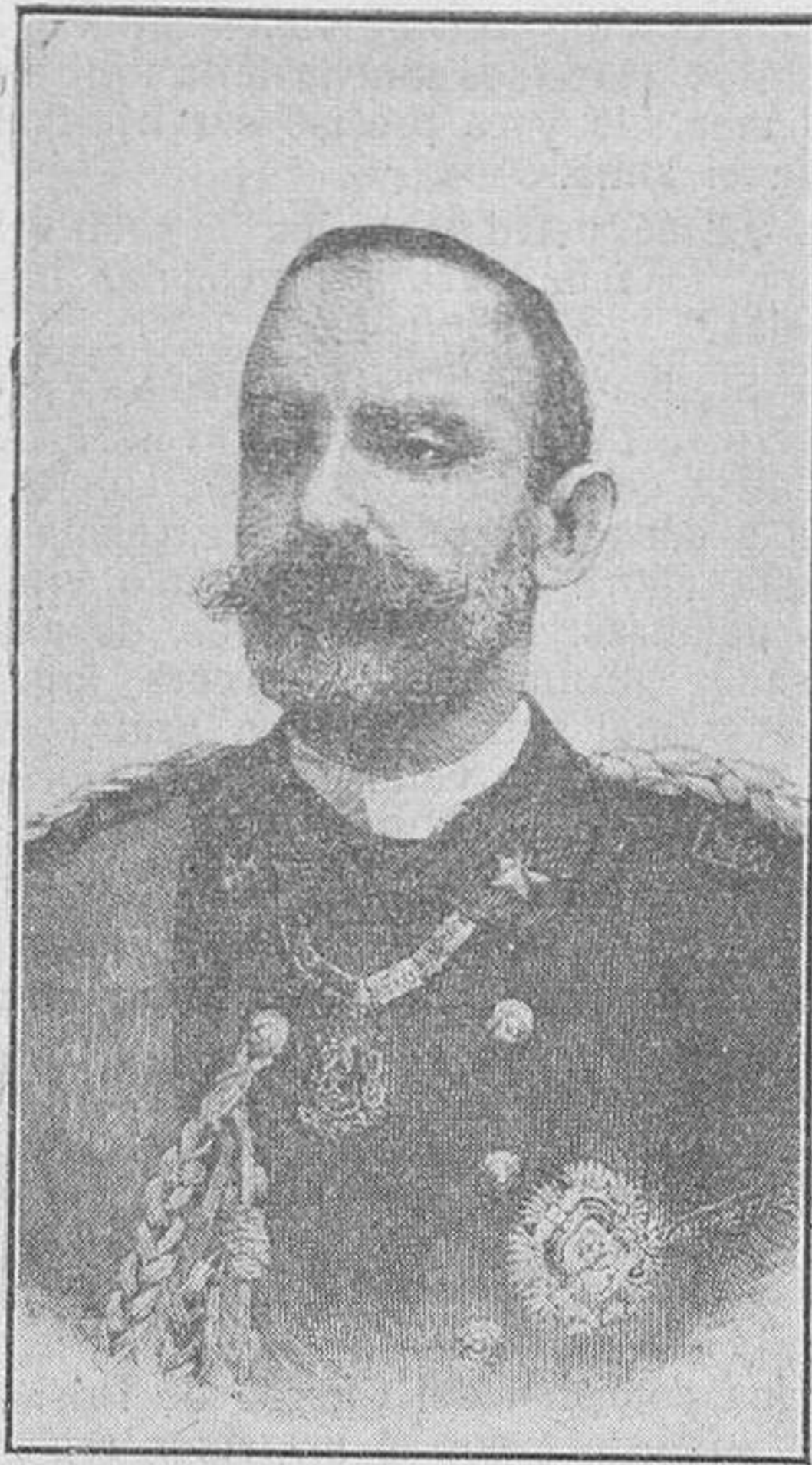
El duque de Génova, almirante italiano, que falleció en Turín, siendo trasladados sus restos a Superga, donde se encuentra el panteón familiar