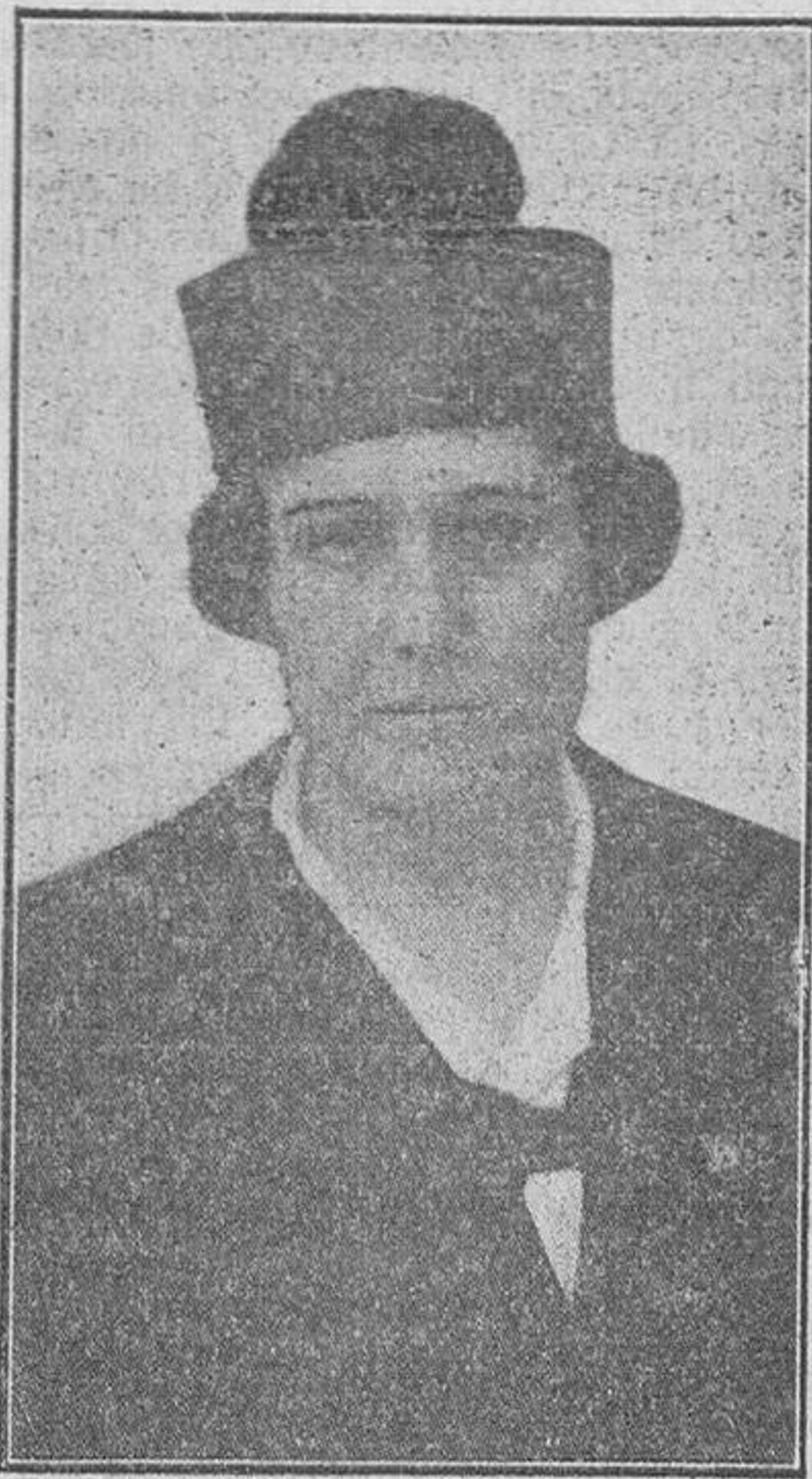
La señorita Victoria Kent, que tomó posesión del cargo de Director general de Prisiones, siendo la primera mujer que en España desempeña un cargo político de tanta importancia

Precios de suscripción en España, SEIS pesetas al trimestre. - Anuncios, esquelas de defunción y reclamos, precios por tarifa. - Comunicados y remitidos, precios convencionales.