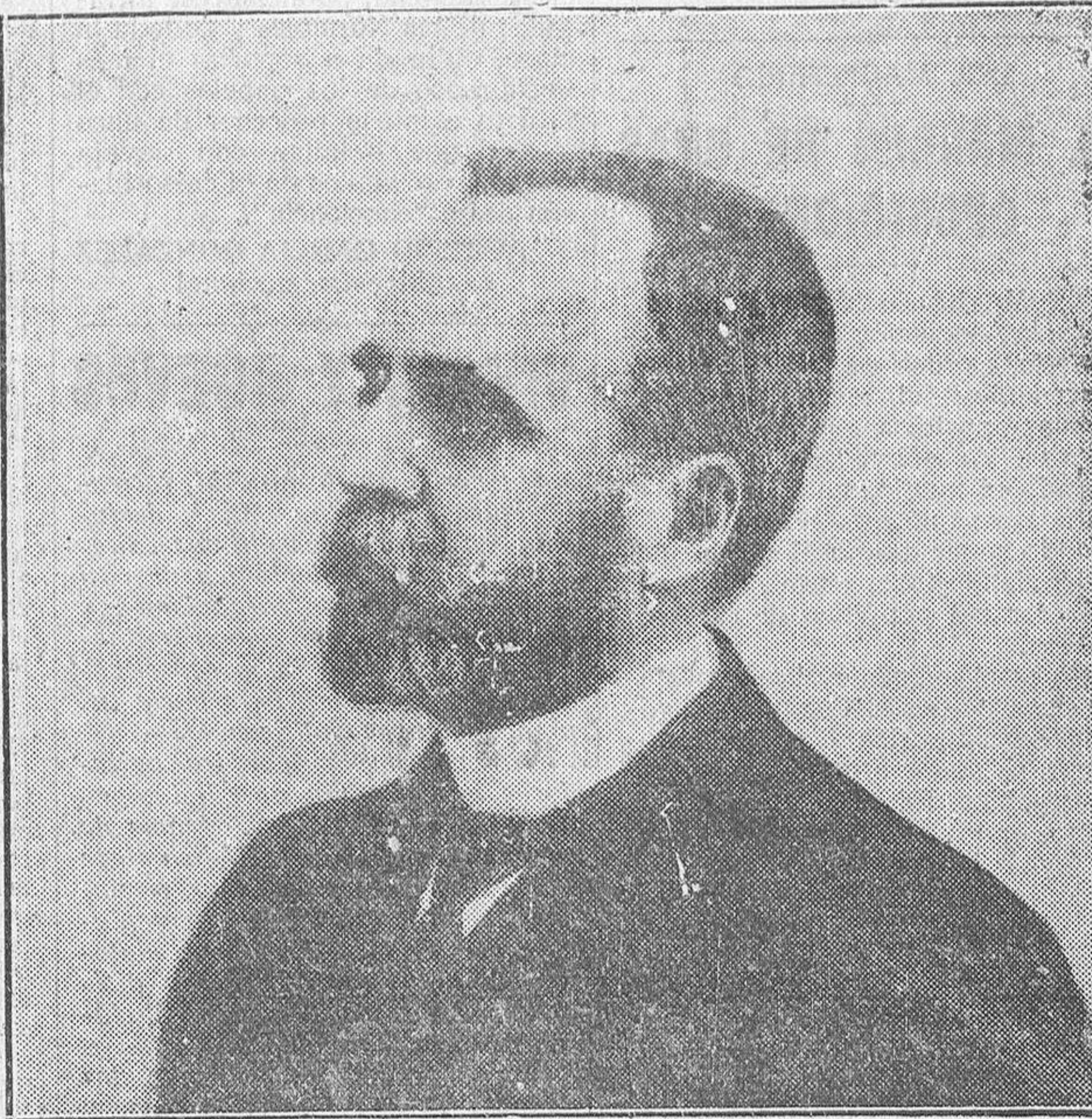
El ex presidente del Consejo de Ministros don José Sánchez Guerra

Una de las obligaciones, más estrechas de un hombre público, que tiene