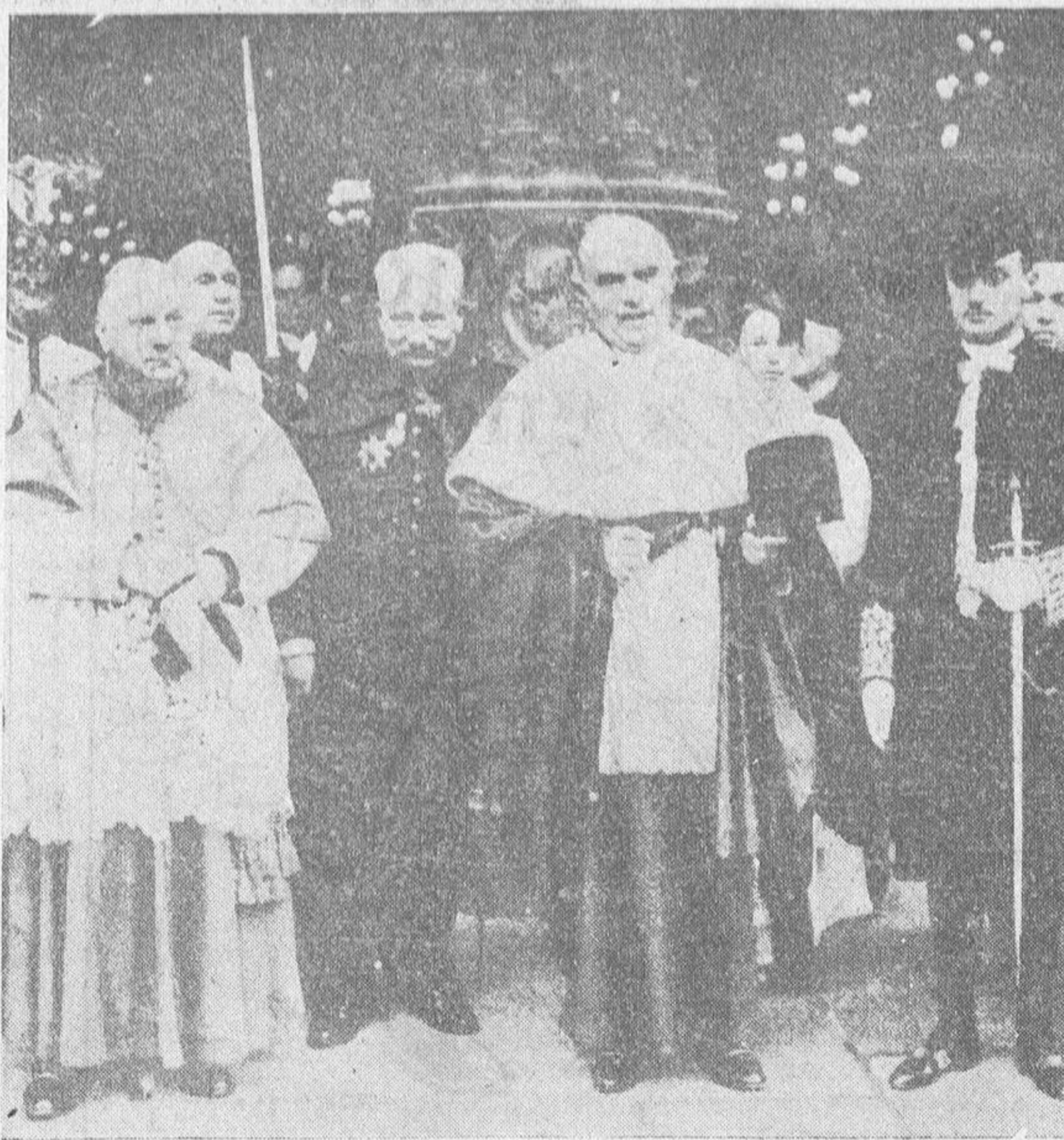
Monseñor Verdier, cardenal arzobispo de París, saliendo de la Basílica de Notre Dame, después de celebrada la ceremonia de su entronización en aquella iglesia metropolitana.