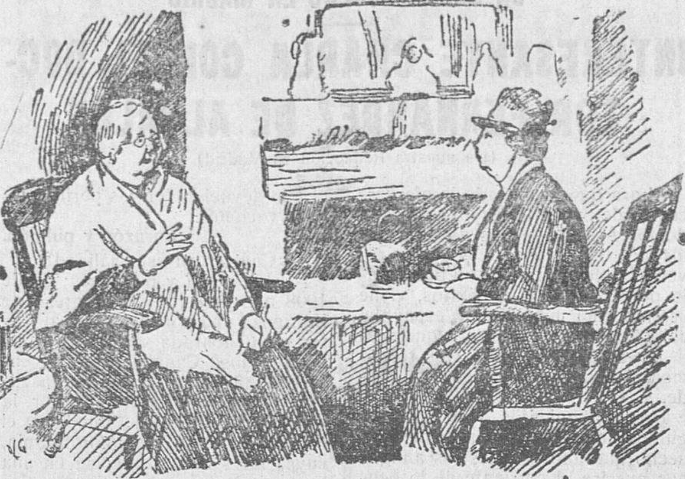
—Voy a cambiar de médico. Es muy distraído. Siempre que me toma el pulso, se pone a mirar el reloj.