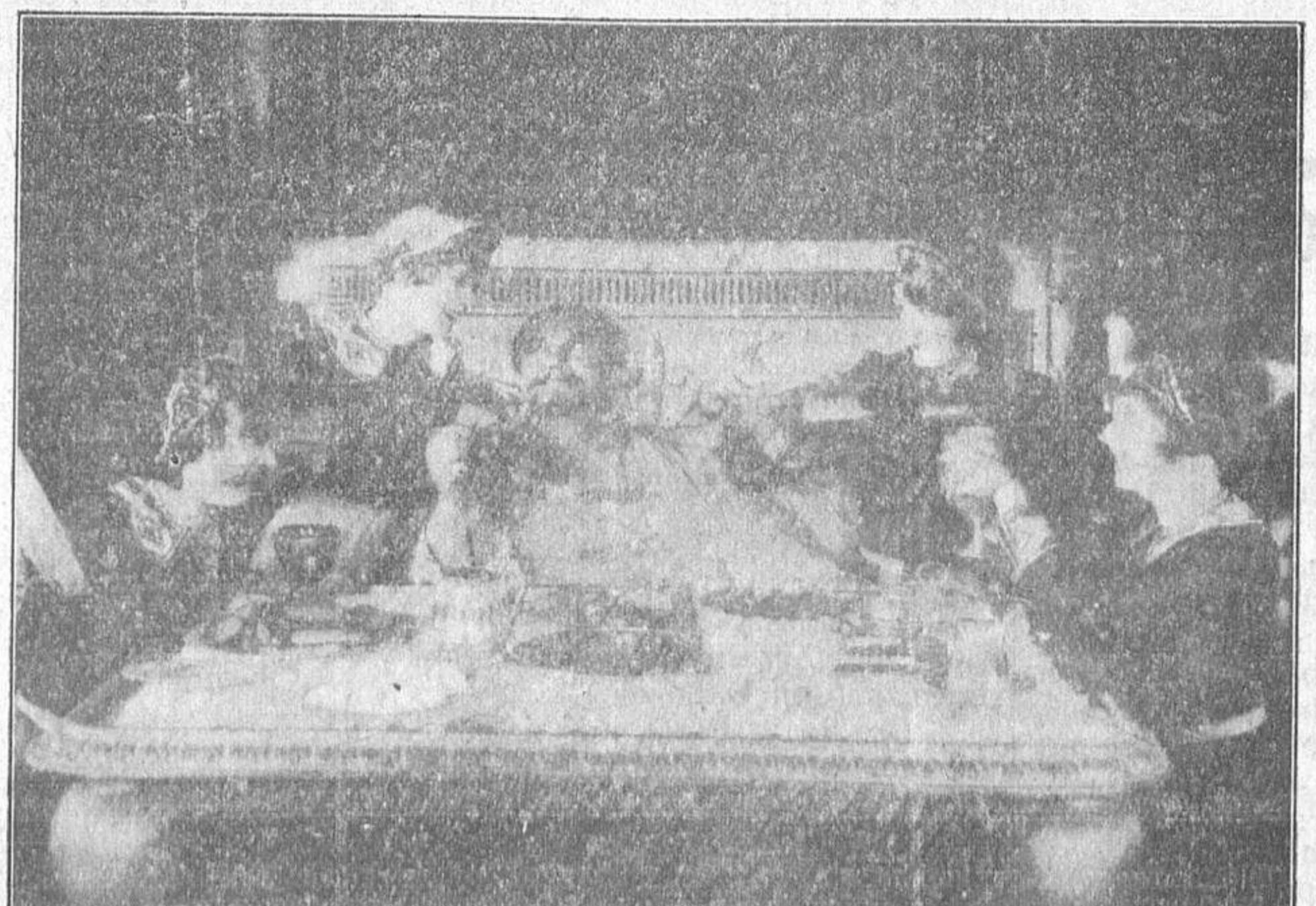
La importantísima firma Firts National ha realizado de una manera irreprochable, la bellísima alta comedia cinematográfica titulada "La odisea de una duquesa", que en breve será proyectada en uno de nuestros coliseos y una de cuyas escenas reproduce el fotógrafo.