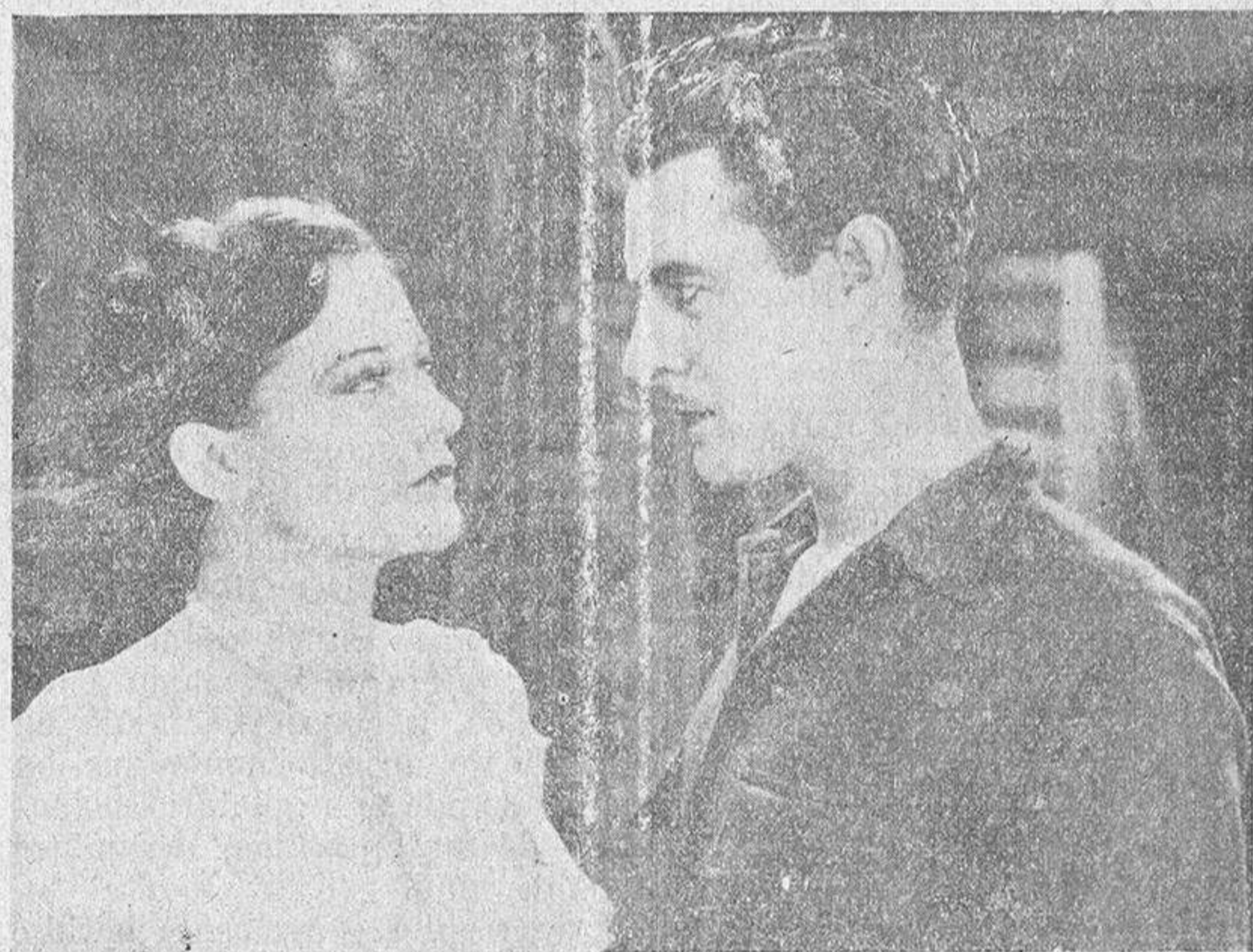
El famoso galán Jhon Gilbert y la gran artista Joan Crawford, en una escena de la bellísima película "Filibusteros modernos". Jhon Gilbert, en esta nueva producción, es el aventurero audaz y valeroso, todo corazón, que lucha por la reparación de los males, a la vez que por conseguir el amor de su vida.

Una de las habilidades de Fred Niblo es haber sabido manejar inmensas masas humanas—en "Ben-Hur" intervienen hasta 150.000 personas—sin que se fundan en ella los personajes que destacan en la película, al punto de poder seguir por mercados y calles que