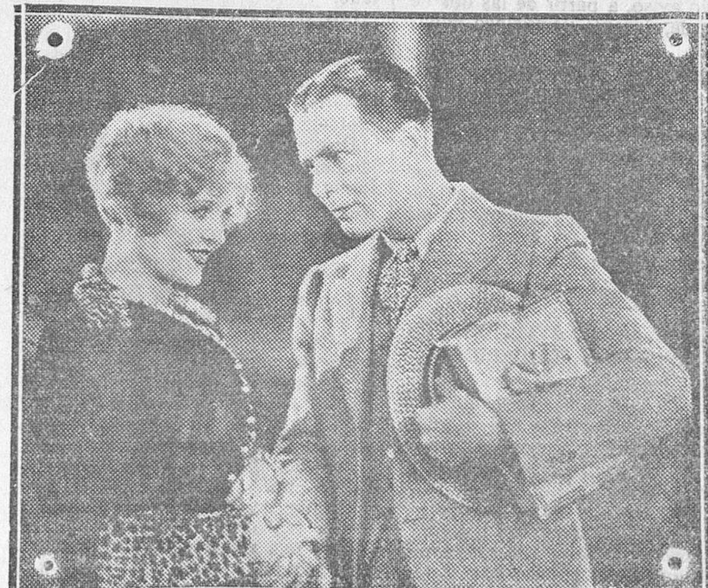
La bellísima "estrella" Phyllis Haver y el notable actor Harrison Ford, en la graciosísima película titulada "Radiomania"