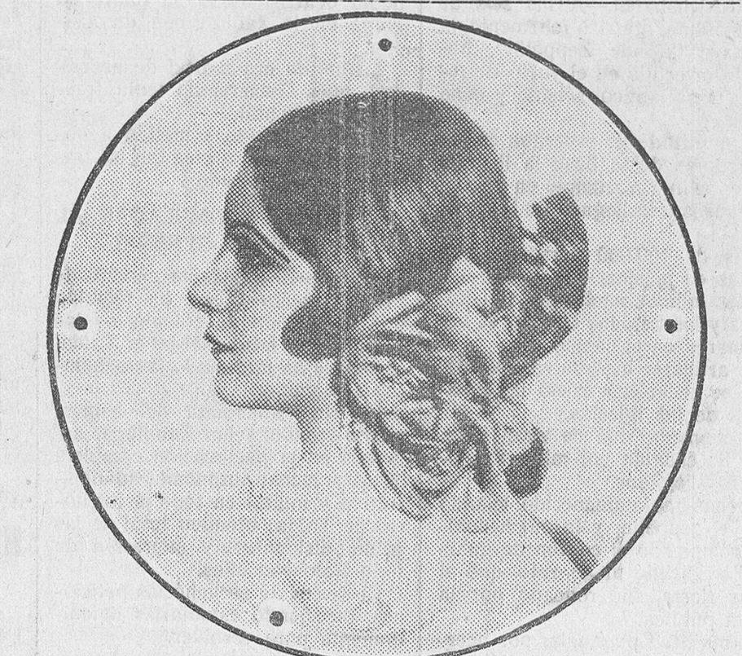
He aquí a la mejicana Enriqueta Valenzuela, la humilde "extra" ascendida por méritos indiscutibles, a "star" cinematográfica. Desde el oscuro trabajo remunerado por horas, Enriqueta Valenzuela ha ascendido al primer plano donde se quiebran todas las miradas, todas las envidias y donde la gloria y la fortuna se rinde sin condiciones. Su belleza, su juventud, y, sobre todo, sus lindas manos, la han convertido en la Mona Rico que comenzará a filmar una película con Barrymore.