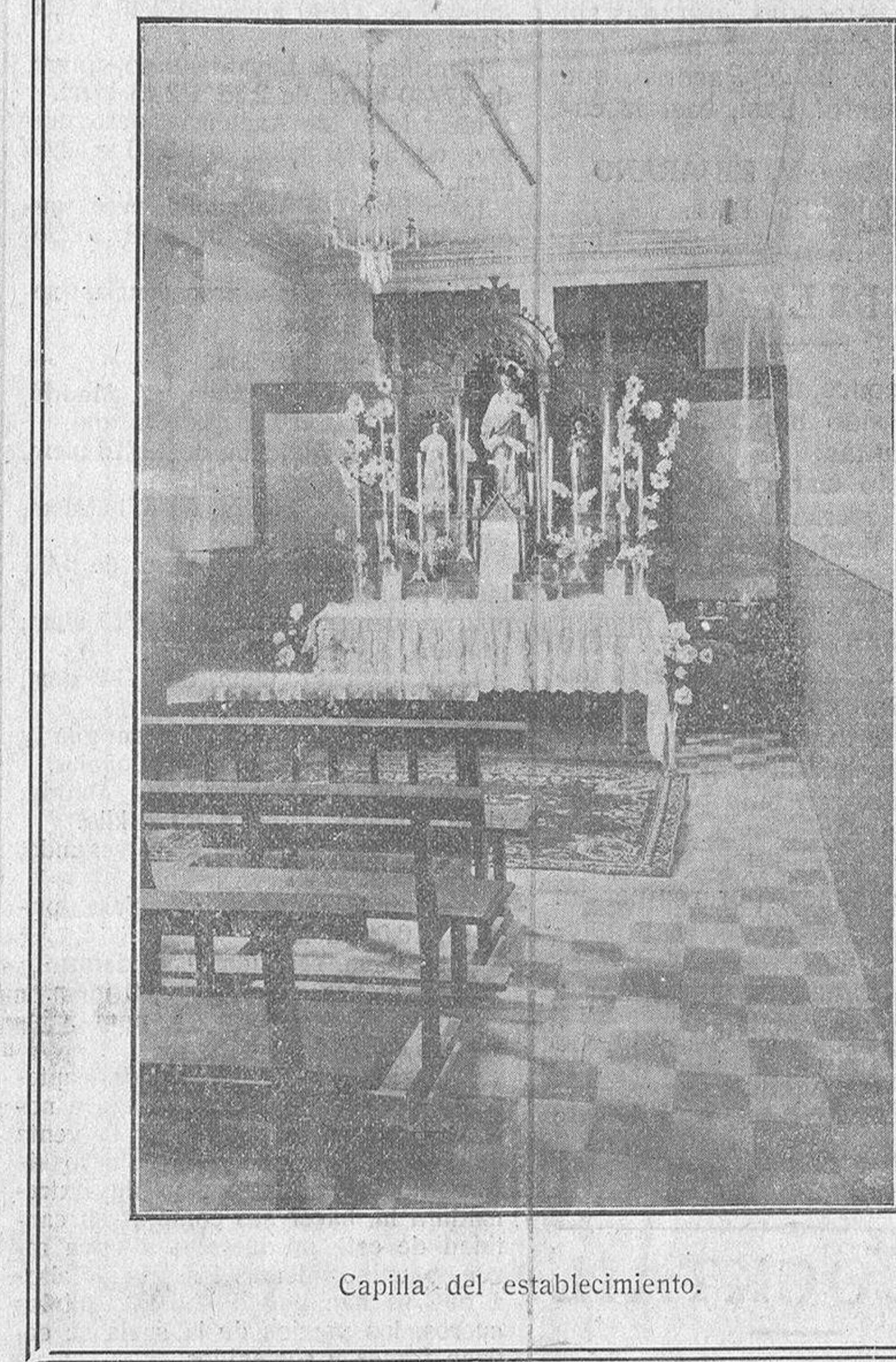
Capilla del establecimiento.

una parte de los beneficios del Banco Hipotecario, que ingresarán su capital con arreglo al mismo sistema a que está sujeto en la actualidad el Banco de España.