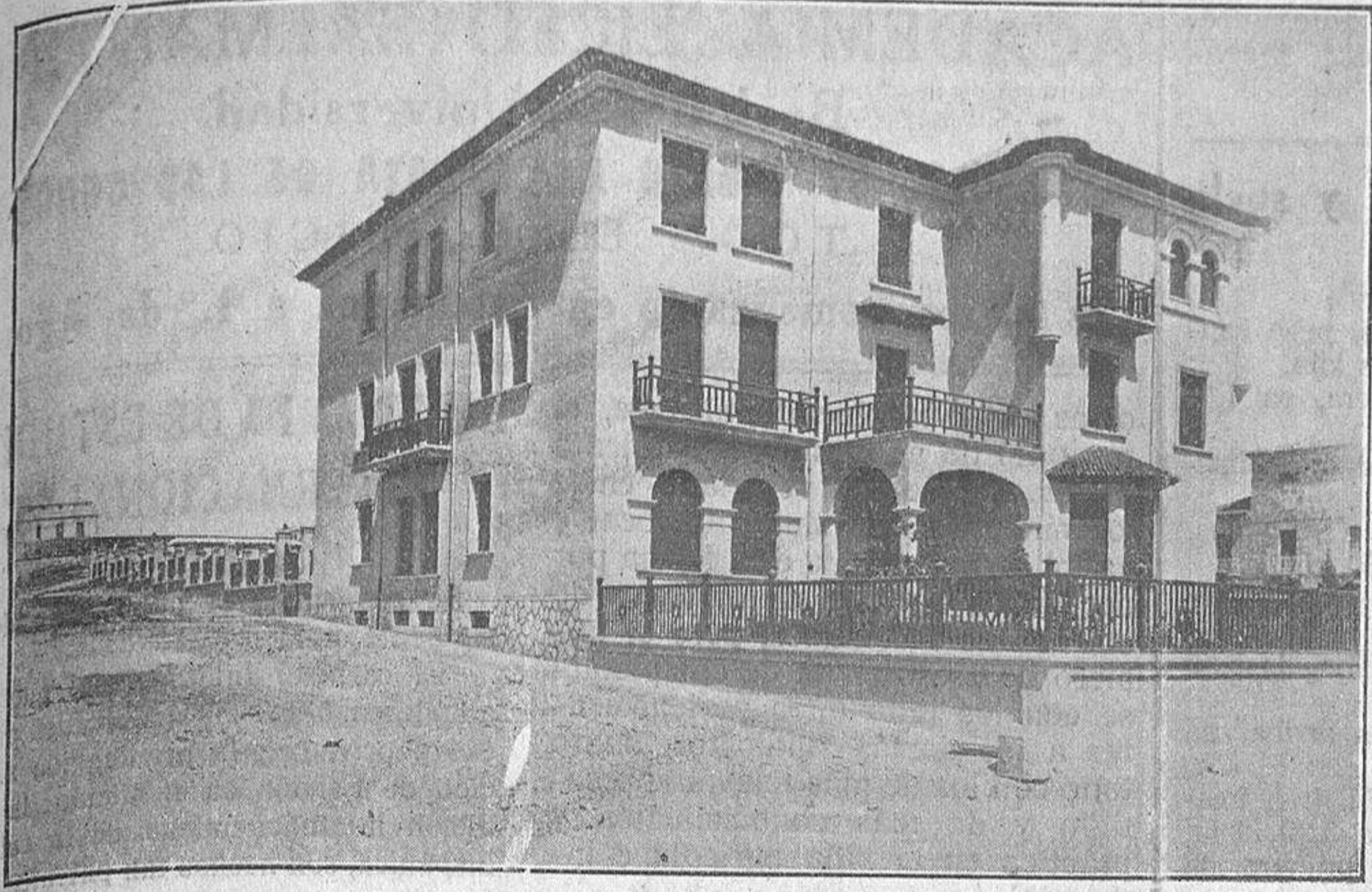
Perspectiva del edificio al comienzo de la calle don Alvaro Gil Sáez.