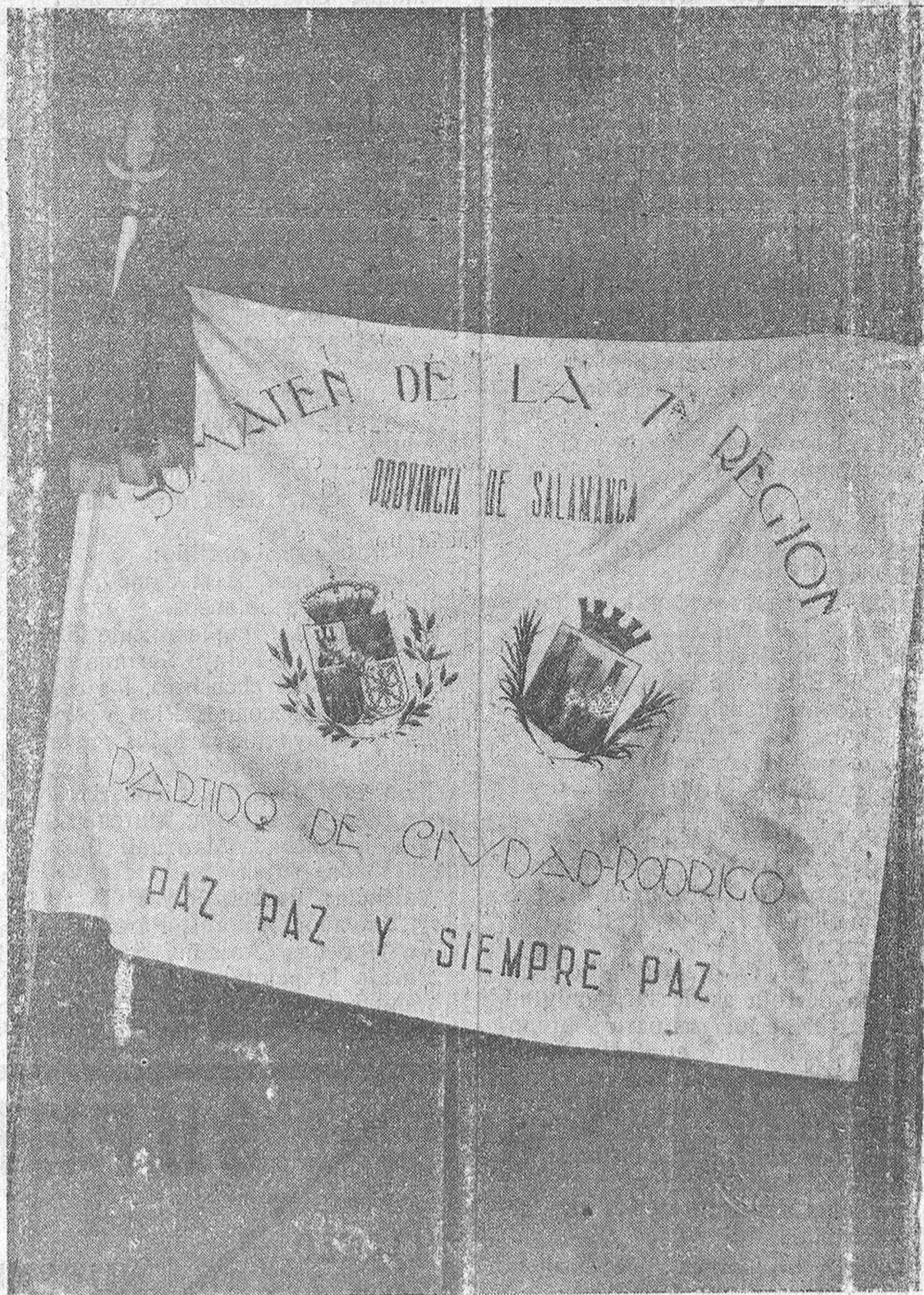
Bandera del Somatén de Ciudad Rodrigo.

Como anunciábamos en nuestra crónica, el domingo pasado tuvo lugar, con gran solemnidad, el acto de bendecir la bandera del Somatén, del partido de Ciudad Rodrigo, y el banderín del distrito, a cuyo acto asistieron bastantes representaciones de los pueblos, así como las autoridades locales, representaciones de Entidades, Corporaciones y numeroso público.